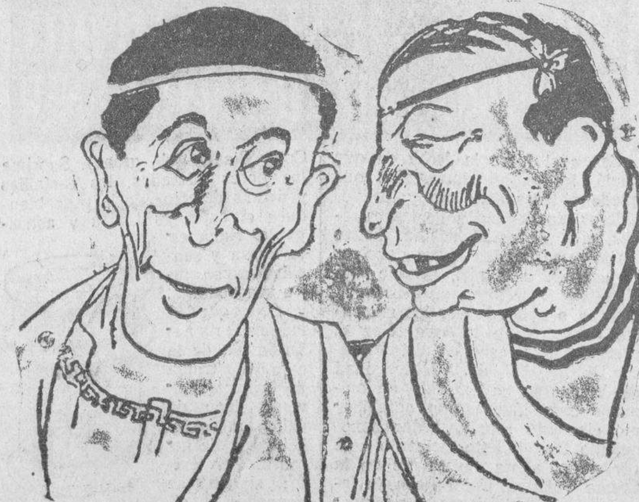
DUELISTAS... -Si, señor. Eres un bellaco, un majadero. No te tolero más tus bromas. Nos batiremos a veinte metros y a pistola. -Conformes con los veinte metros, pero... a espada. (Ric-Rac).

En Madrid se vende EL ADELANTO, en el kiosco de las Calatravas, calle de Alcalá.