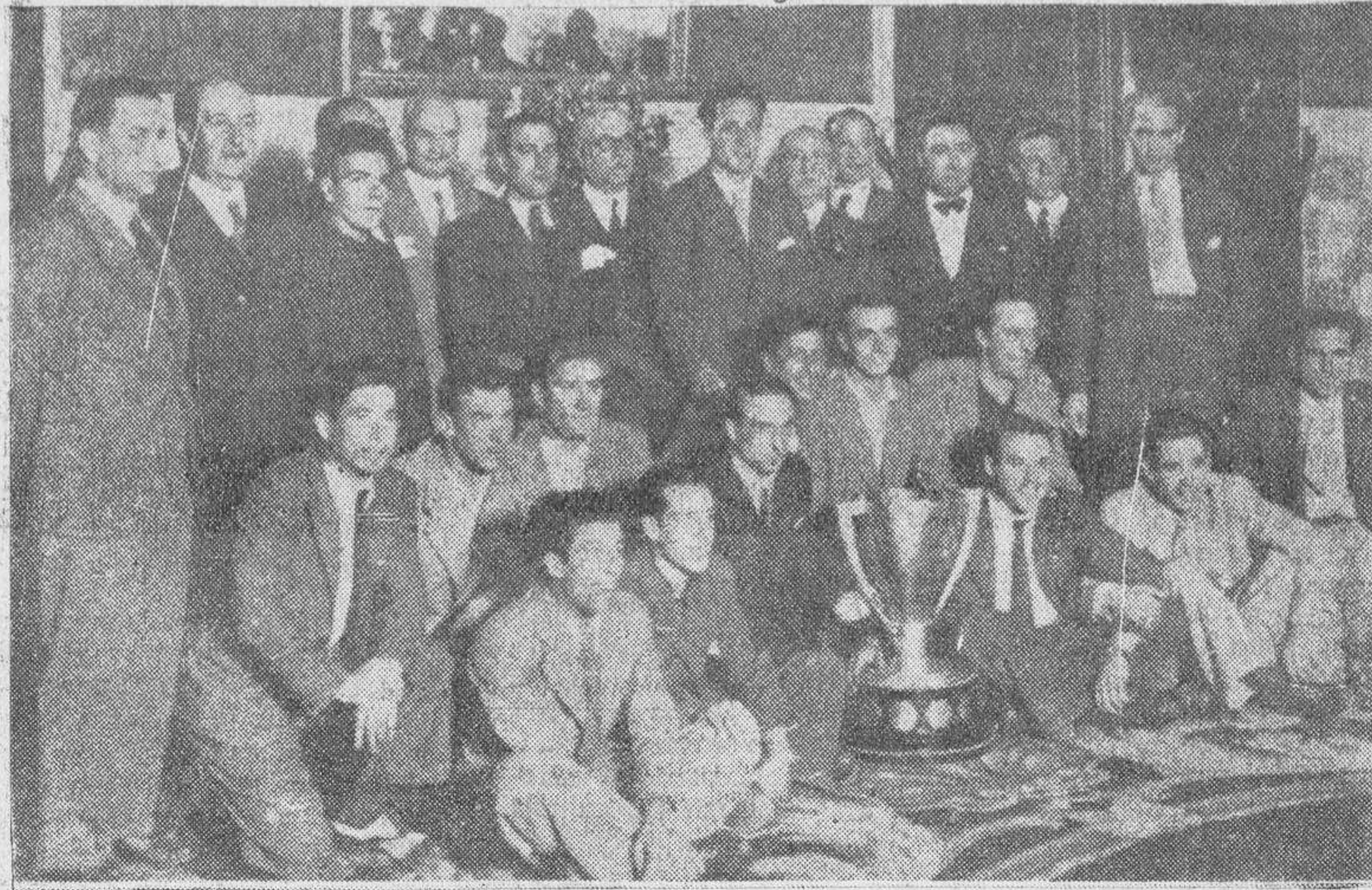
Los jugadores del Betis han sido objeto, en Sevilla, de un recibimiento realmente grandioso. Los bravos «equipiers» del club campeón de la Liga fueron recibidos oficialmente en el Ayuntamiento sevillano, donde aparecen con el alcalde, señor Contreras, y un grupo de concejales

Eusebia y la Santiago se arrojan sobre el mismo golpeándole con palos y una horca o tornadera? Si.