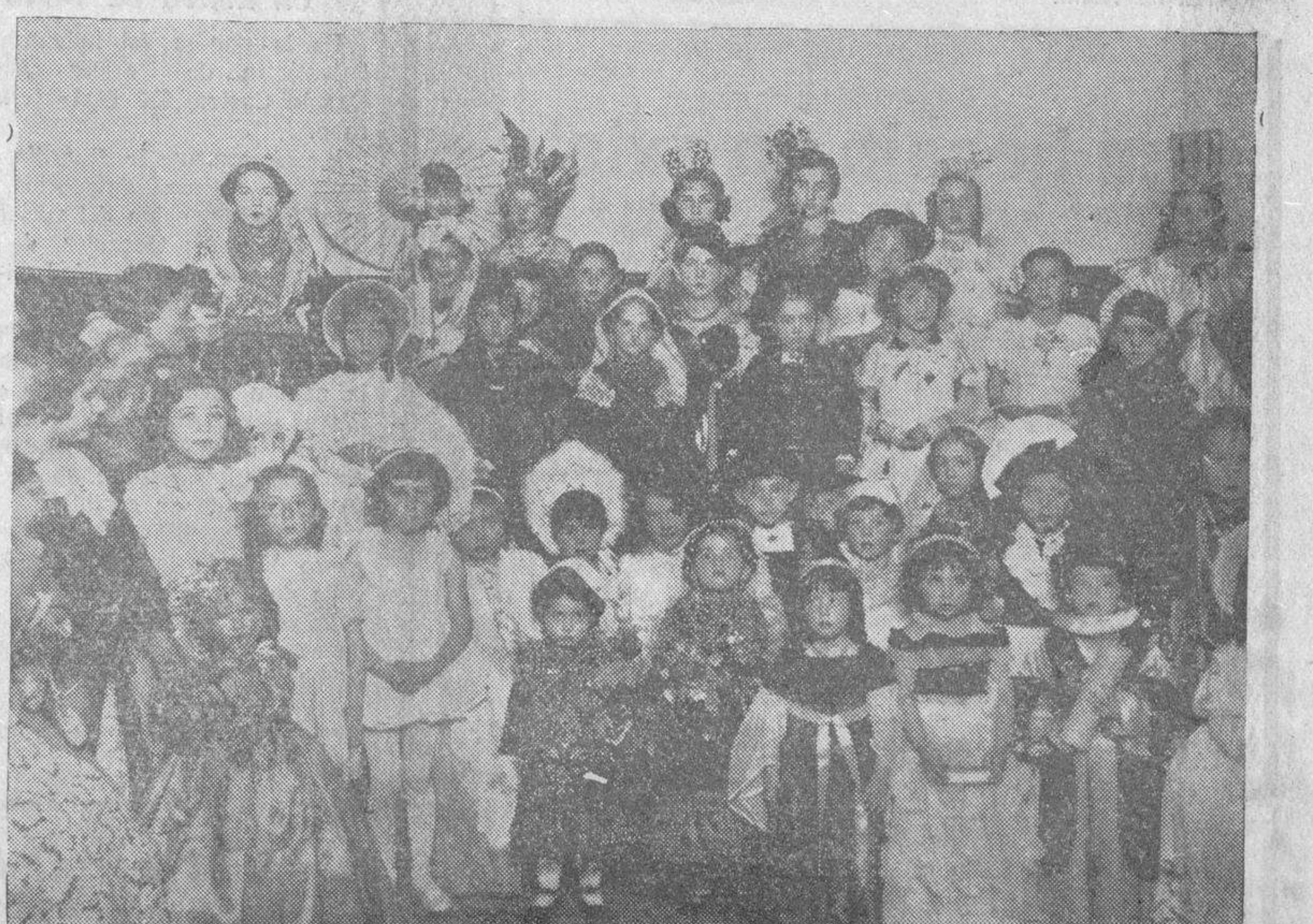
Niños y niñas que concurren al baile infantil del Casino, luciendo preciosos trajes.

En la Casa de Socorro fueron curados ayer Aurelio García, de