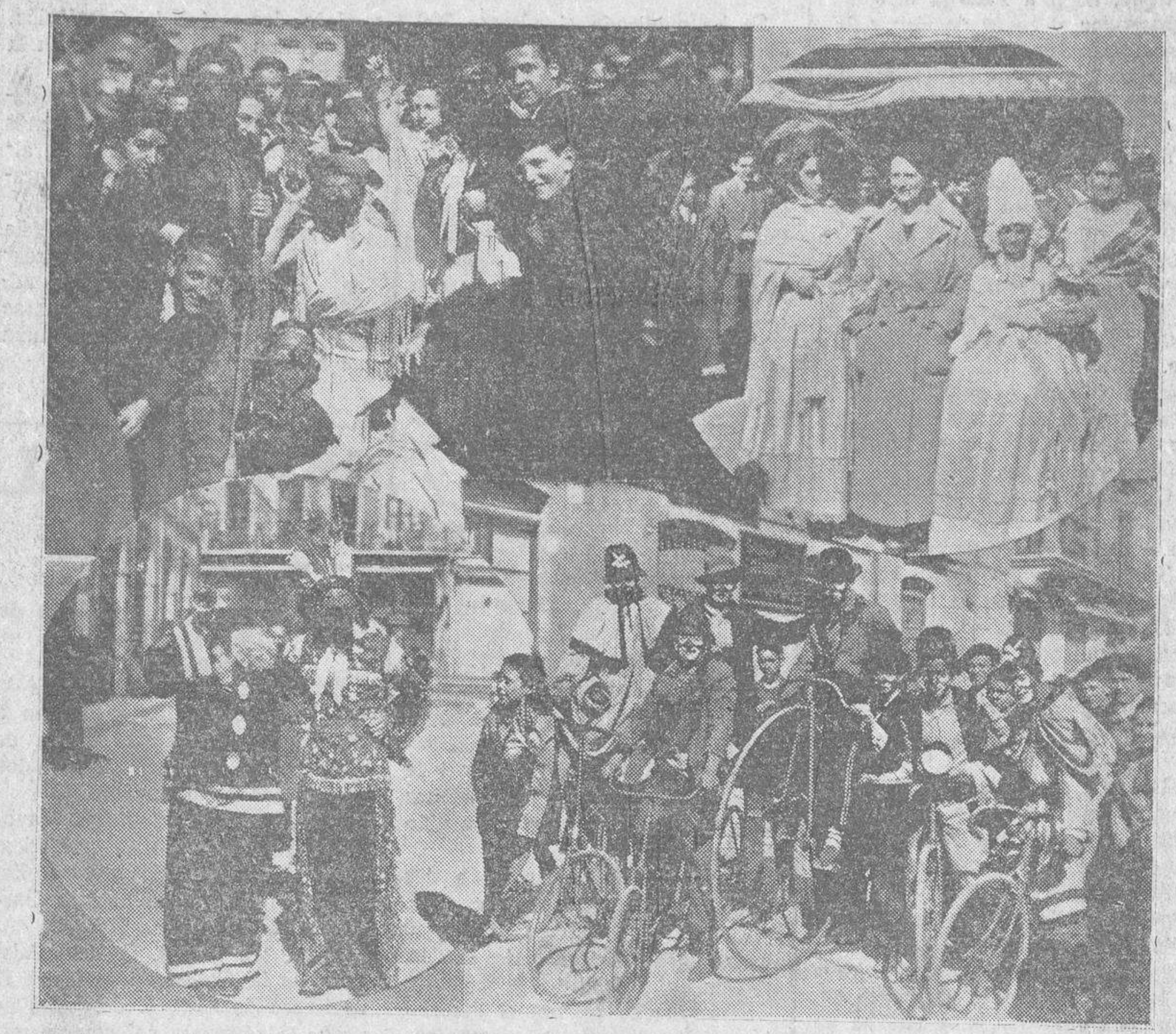
DEL CARNAVAL EN SALAMANCA. — Grupos de niñas, a pie y a caballo..., en bicicletetas, vistas el domingo en nuestra ciudad