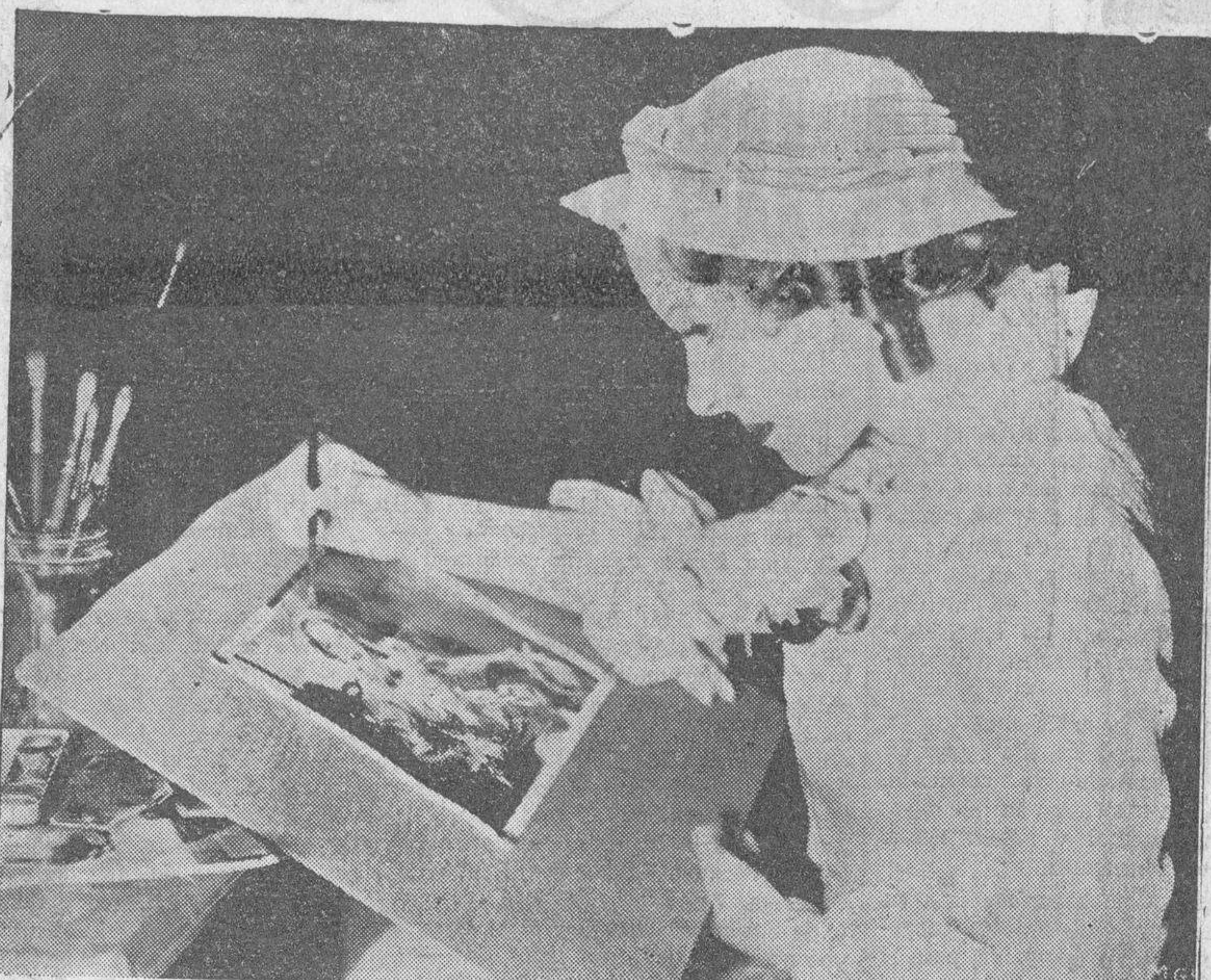
Helen Hayes, estrella del cine, se entretiene colorando fotografías en su camerino del estudio, durante los intermedios de la película que actualmente está filmando