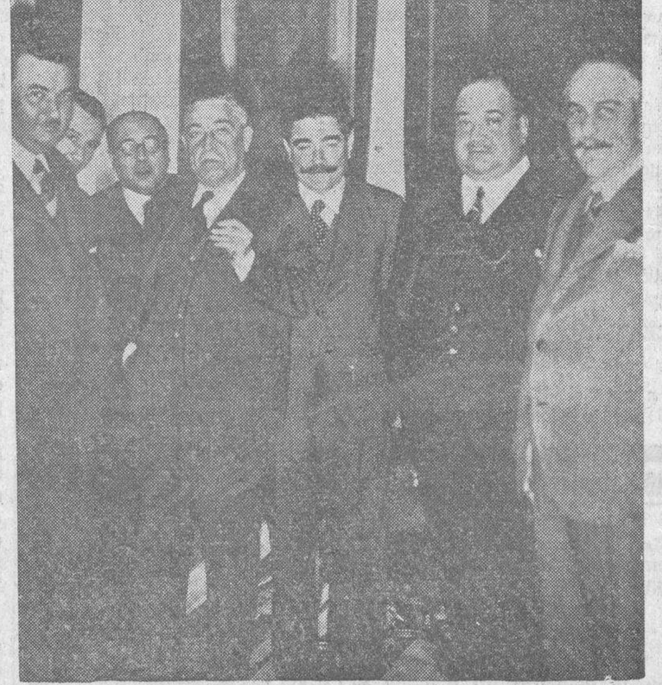
Los ministros de Agricultura, Instrucción, Obras Públicas y Gobernación, con otros representantes de las minorías gubernamentales, que estudian actualmente las modificaciones que han de introducirse en la ley Electoral

Continúa esta información en la página siguiente.