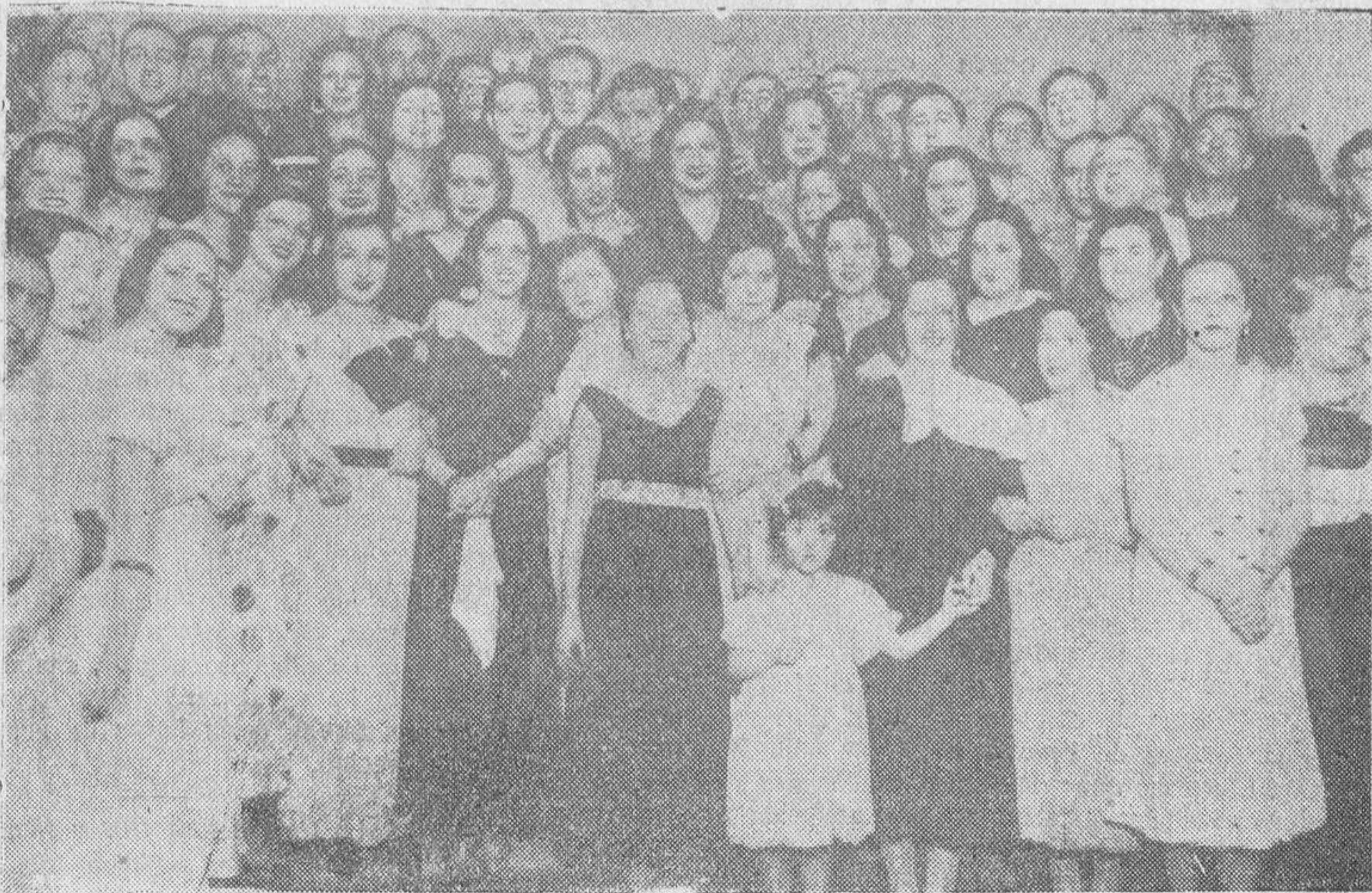
Grupo de concurrentes al baile con que los salmantinos, en Madrid, se despidieron del año en la «Casa Charra»