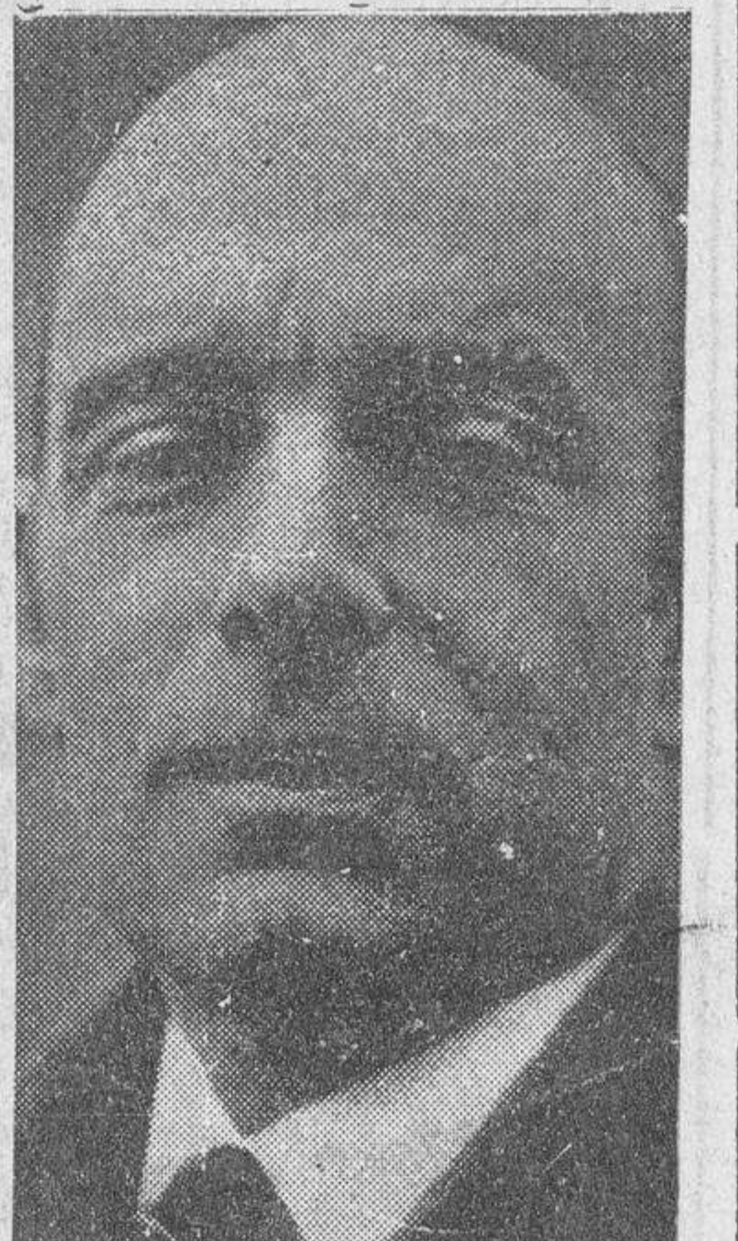
El ilustre médico don Pedro Ara, que ha sido nombrado académico de la Nacional de Medicina