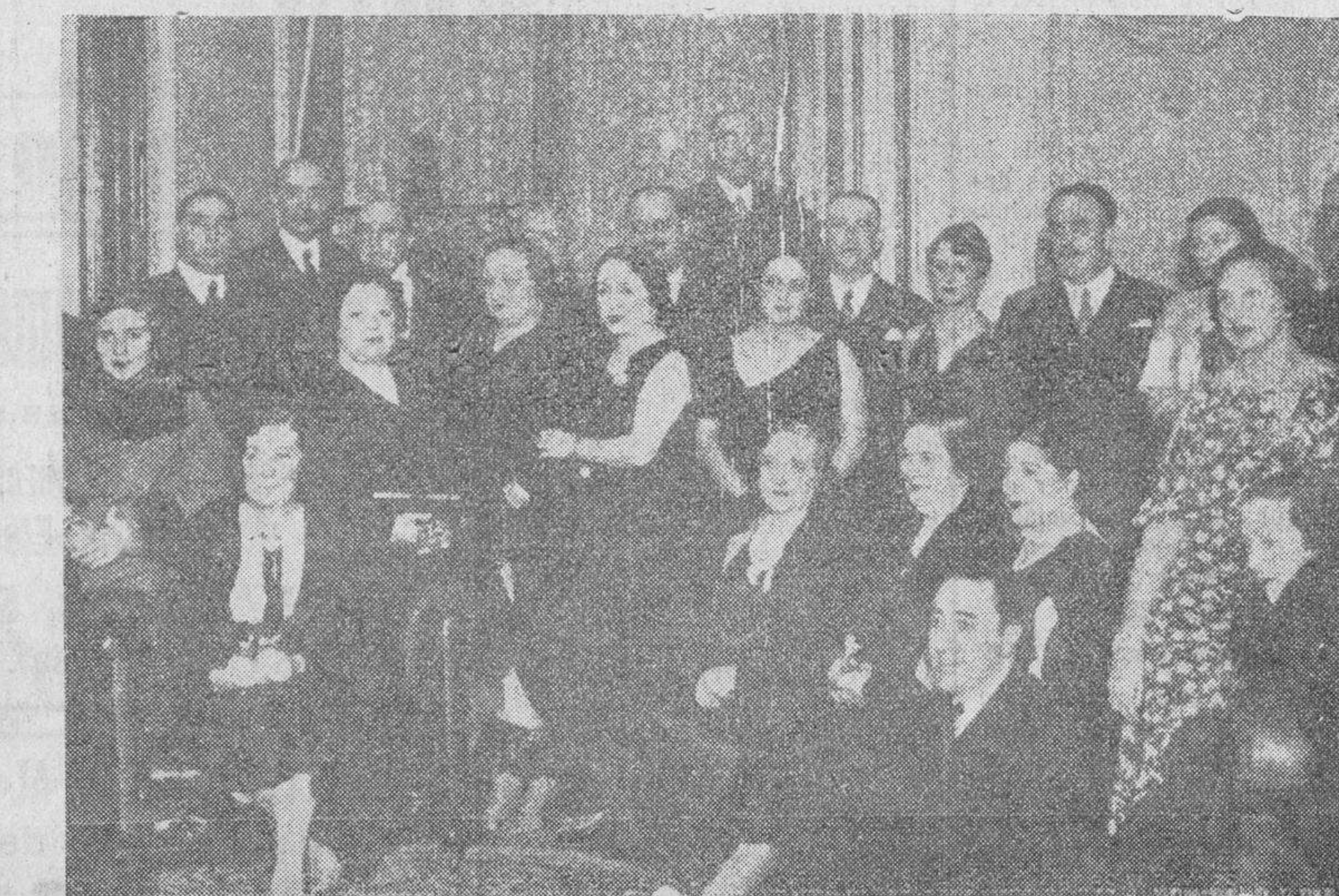
El ministro de la Gobernación, señor Vaquero, con distinguidas personalidades y damas, a quienes invitó a recibir el año en el Palacio de la Puerta del Sol