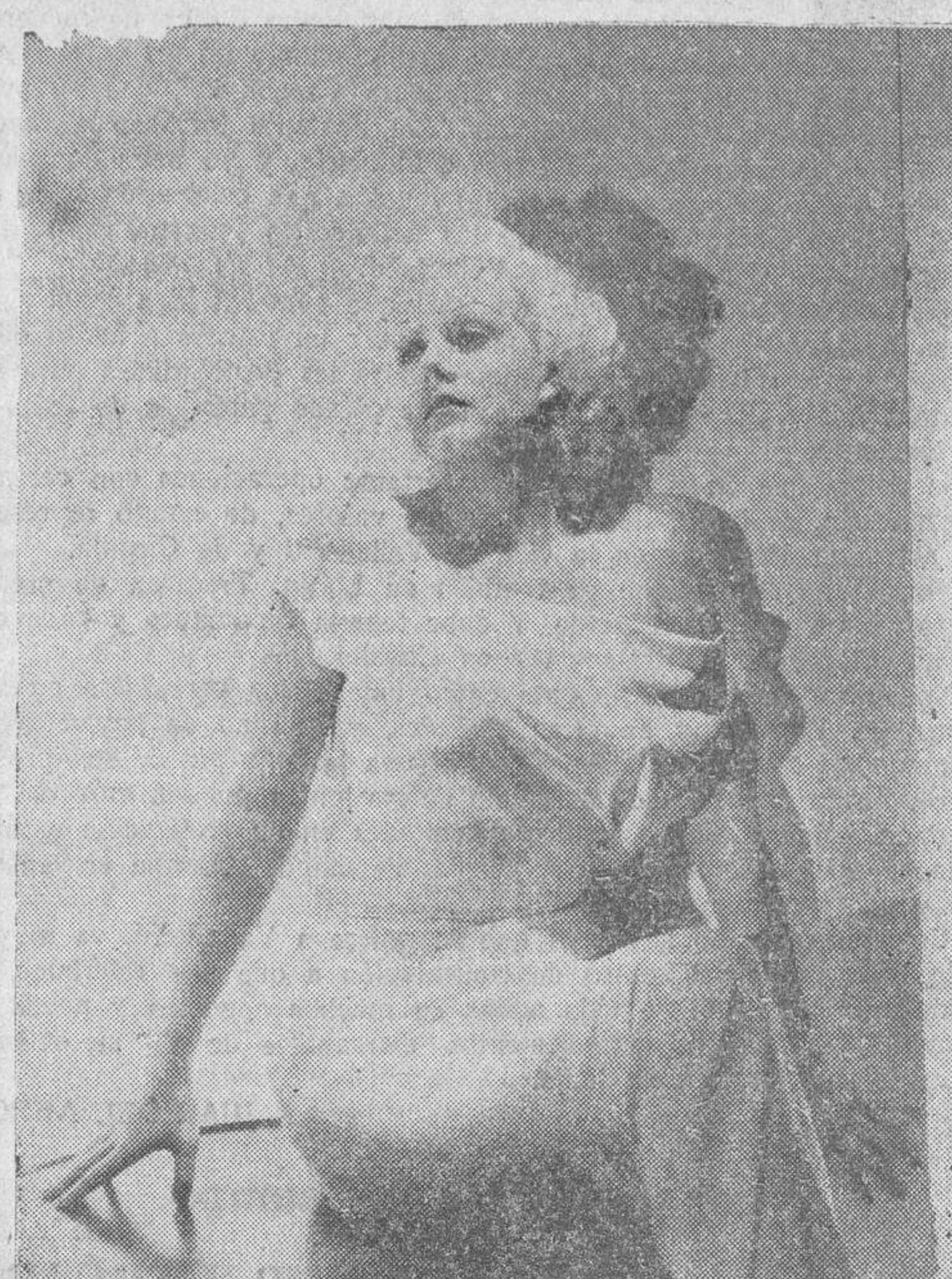
Jean Harlow, la bella «rubia platino» que ocupa sitio tan elevado entre las estrellas Metro-Goldwyn-Mayer.