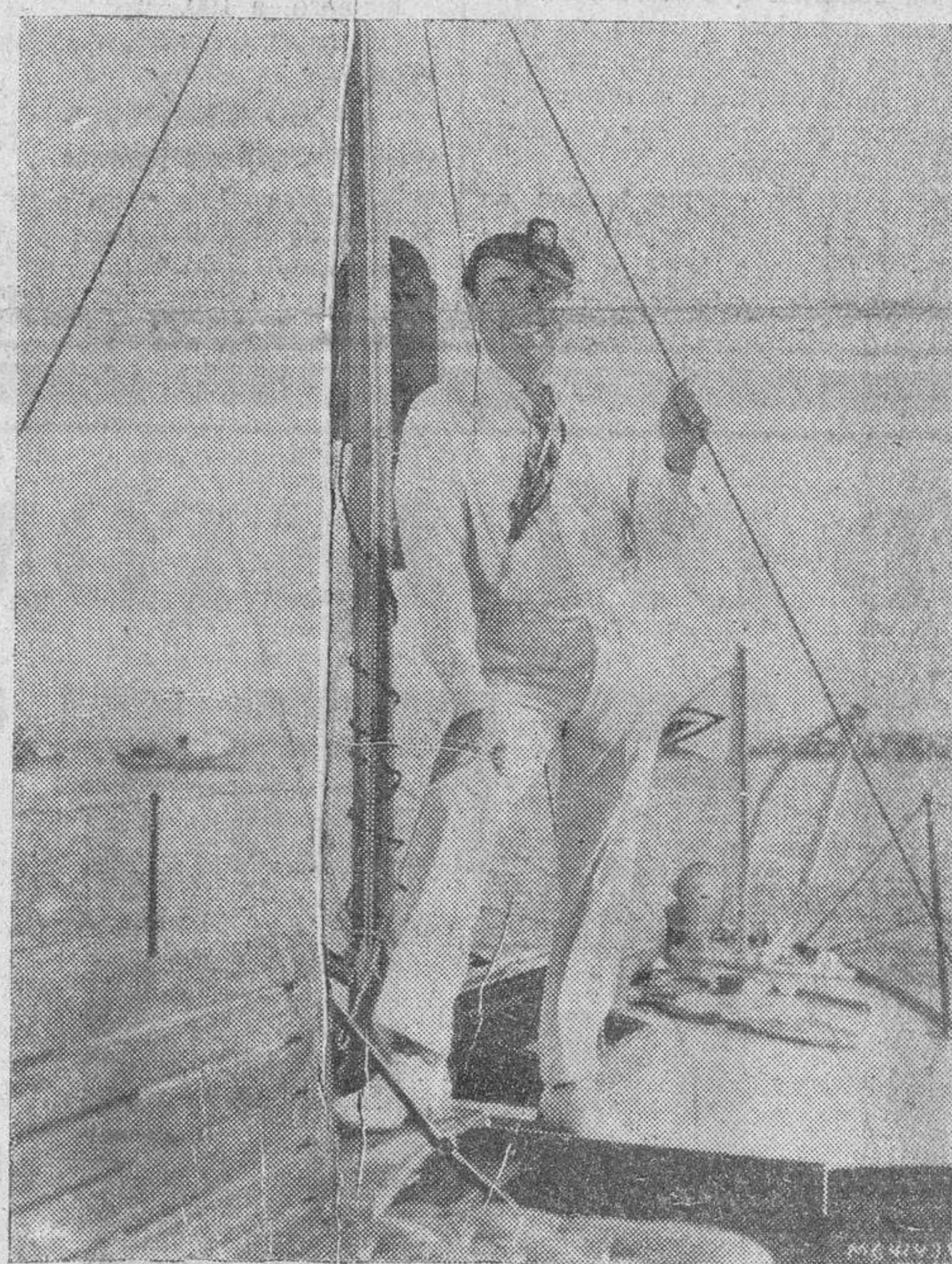
Leo Carrillo, a bordo de su yate «Thetis».