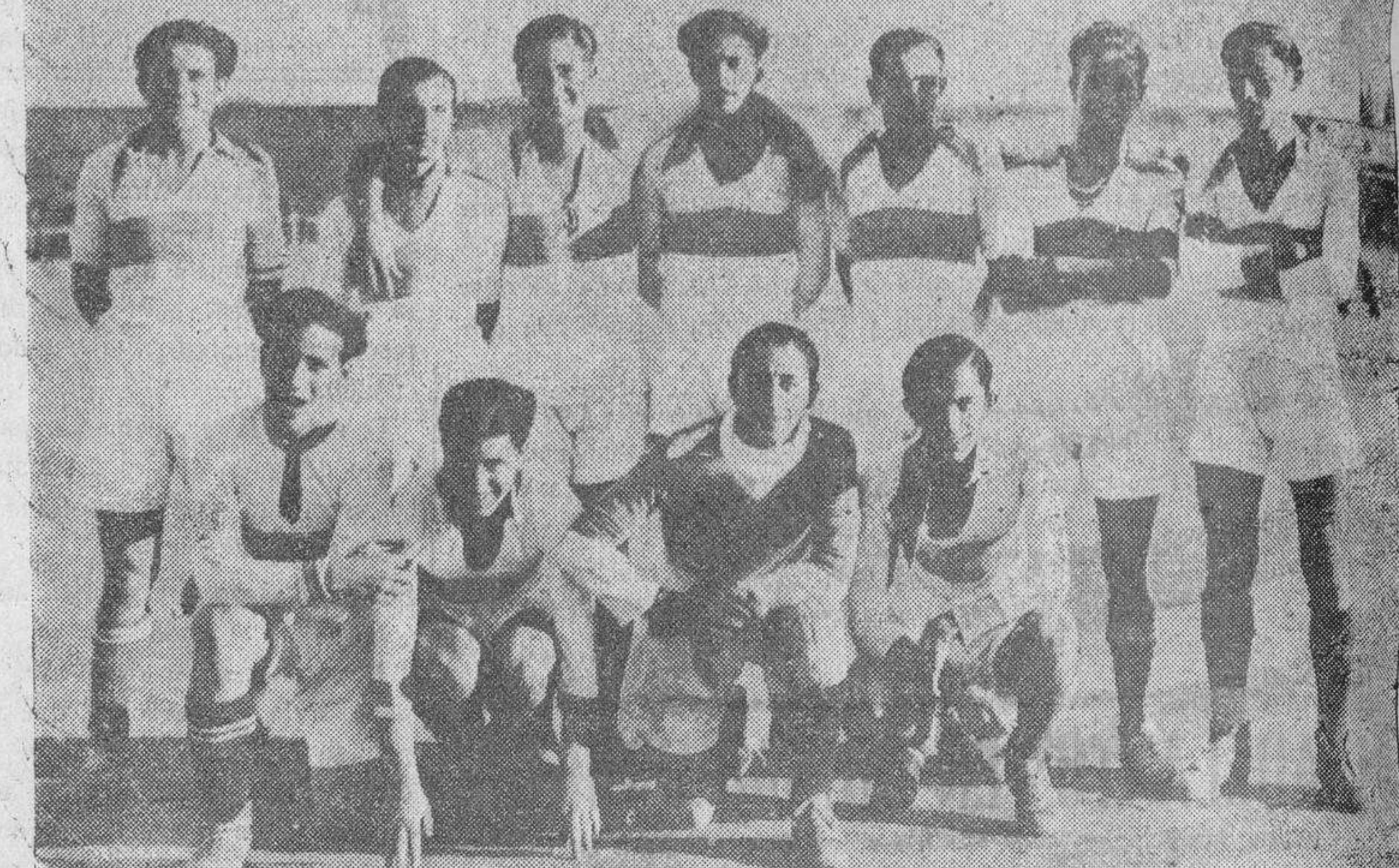
Los equipos de la U. D. Salamanca y Facultad de Medicina, que se enfrentaron el domingo, en partido de entrenamiento, venciendo el primero por 6-2.