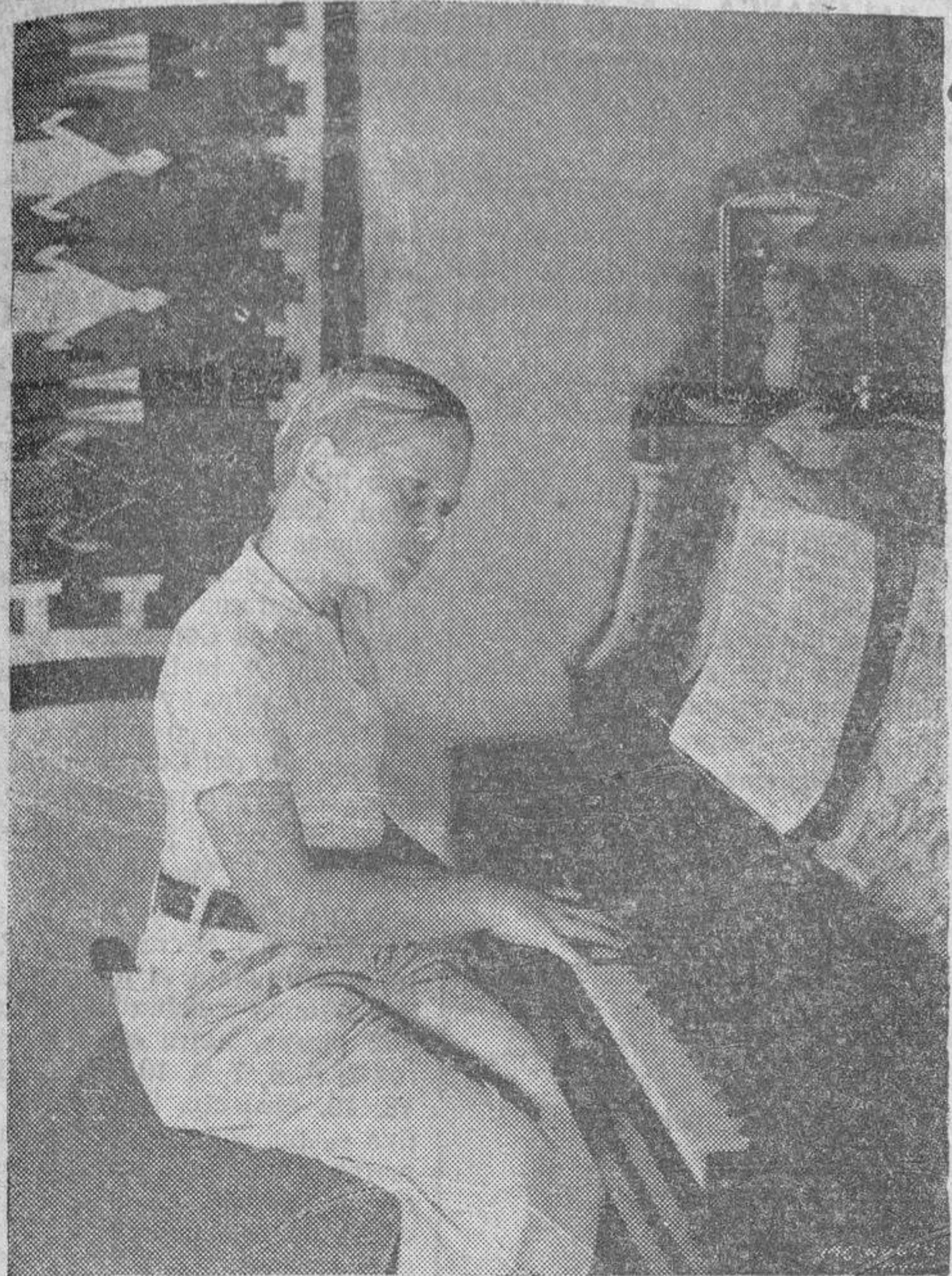
Jackie Cooper, la simpática estrella infantil, estudiando su lección al piano.