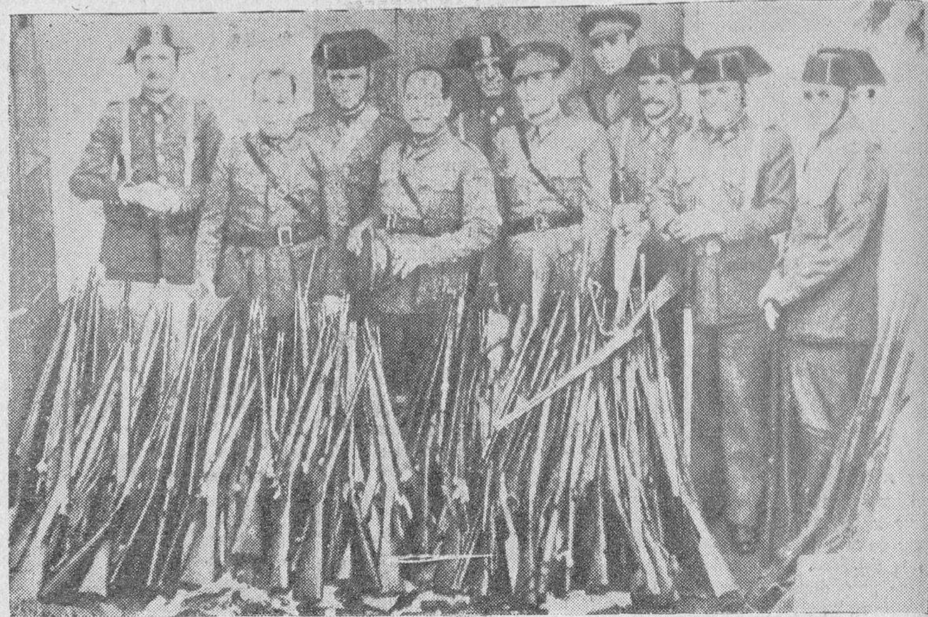
En Badalona, una vez dominado el movimiento, las fuerzas de la Guardia Civil y Carabineros recogieron, entre otras, estas armas que aparecen en la foto