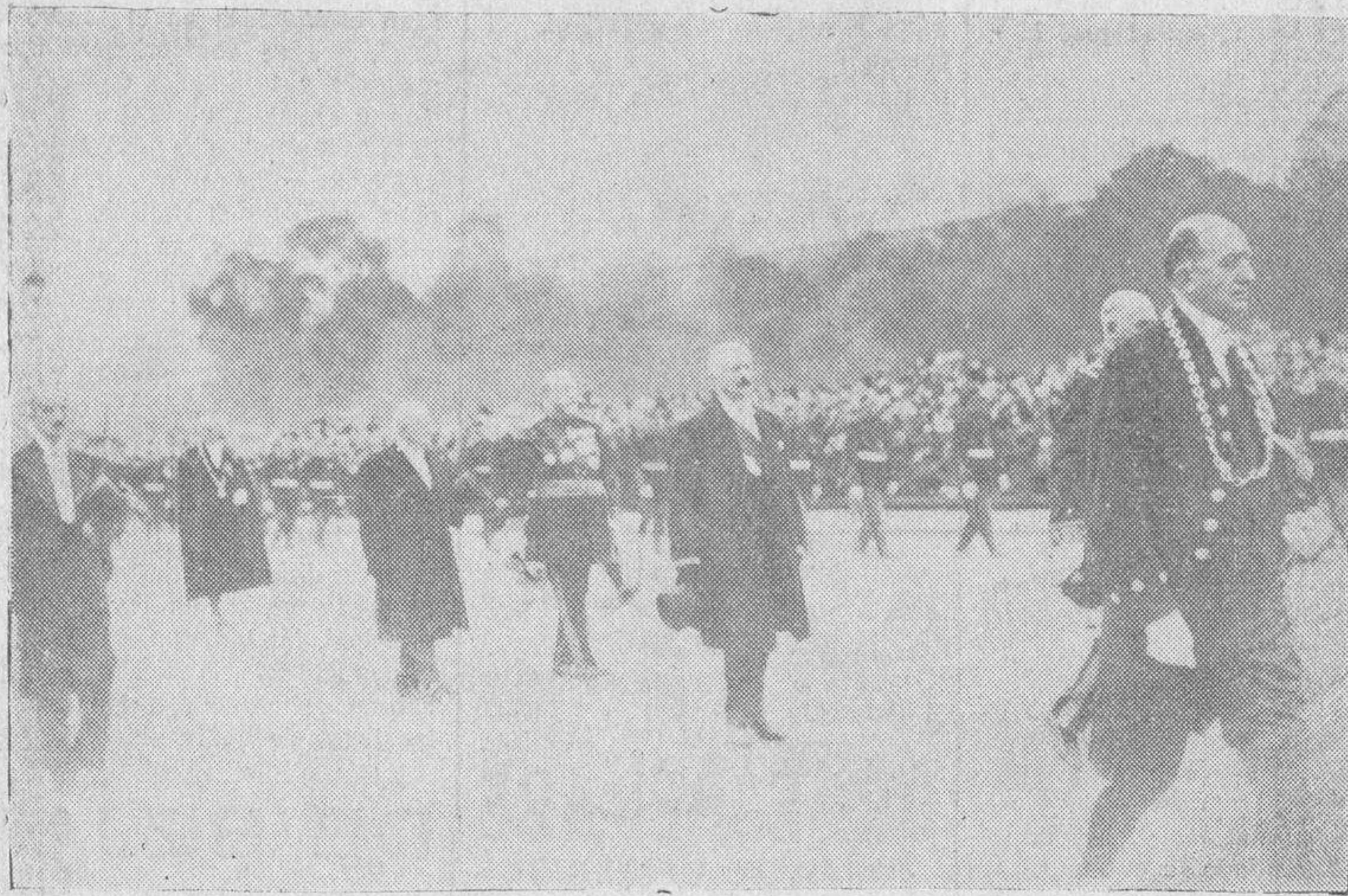
Los funerales nacionales en París, del ministro Barthou, asesinado en Marsella. -En primer término el Presidente de la República, Lebrun, en el cortejo fúnebre.

El marxismo y el comunismo, coaligados en una acción concén-