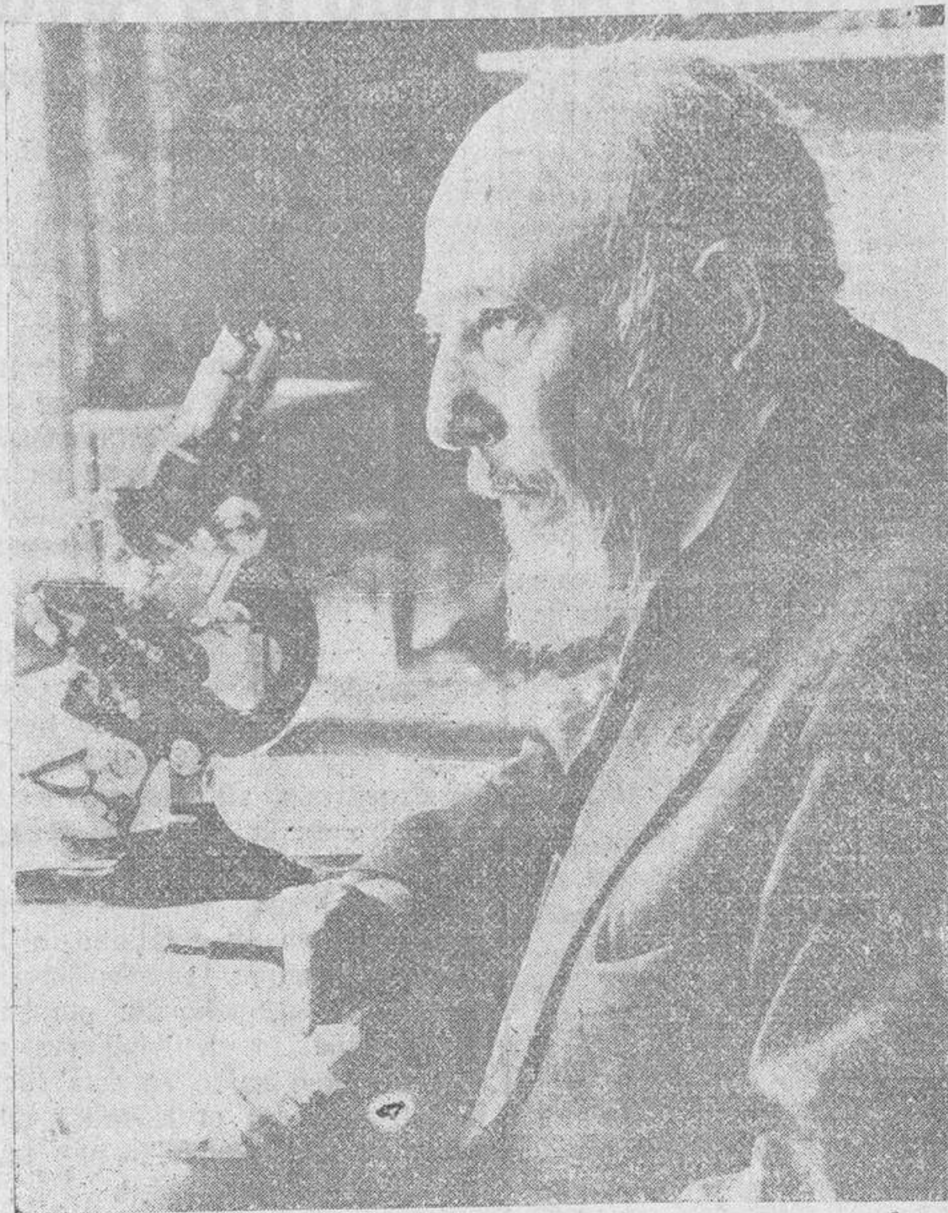
La noticia de la muerte