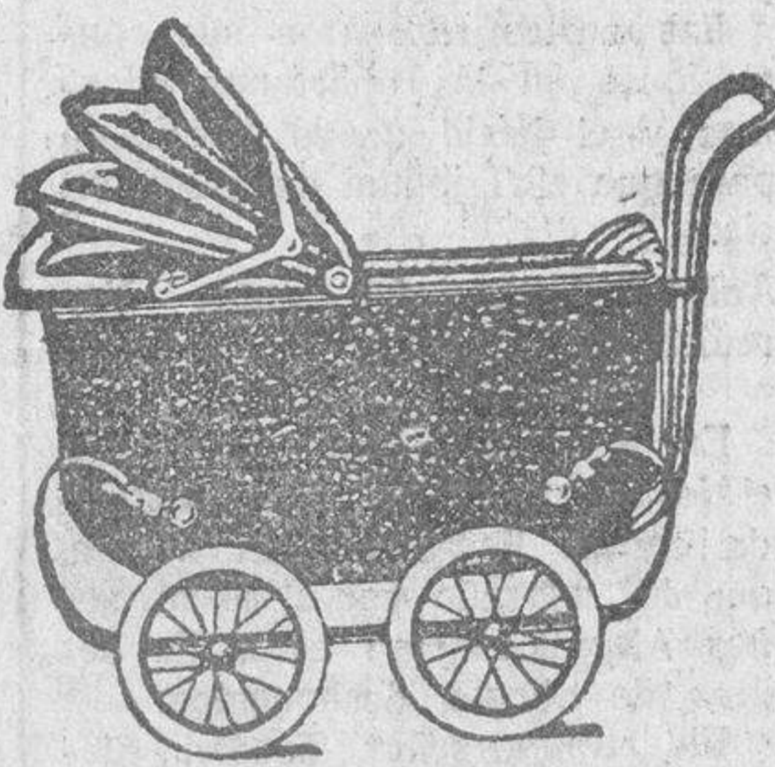
VENTAS CONTADO Y PLAZOS