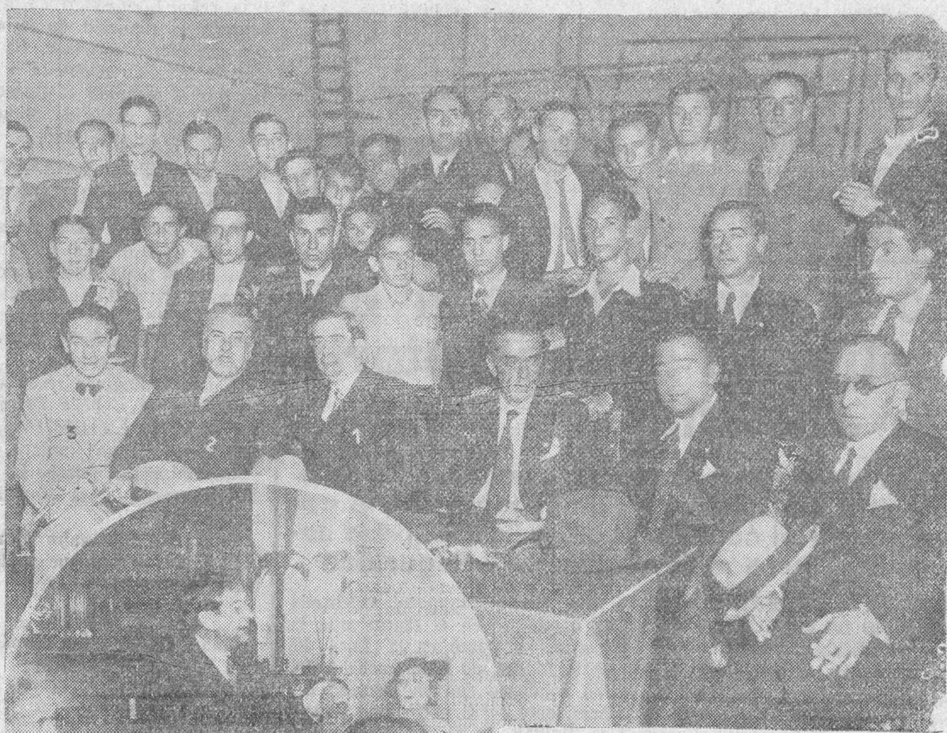
Presidencia del acto político de izquierdas, el día del domingo en el teatro Bretón, en la que figuraron don Marcelino Domingo (1), ex ministro de Instrucción Pública, don Francisco Barnés (2) y el ex gobernador civil de Salamanca, don Mariano Joven (3). En el círculo, don Marcelino Domingo, durante el discurso que pronunció a los postres del banquete que se celebró.

Asistieron alrededor de un centenar de comensales, y entre ellos, una representación del Partido Radical Democrata de Salamanca,