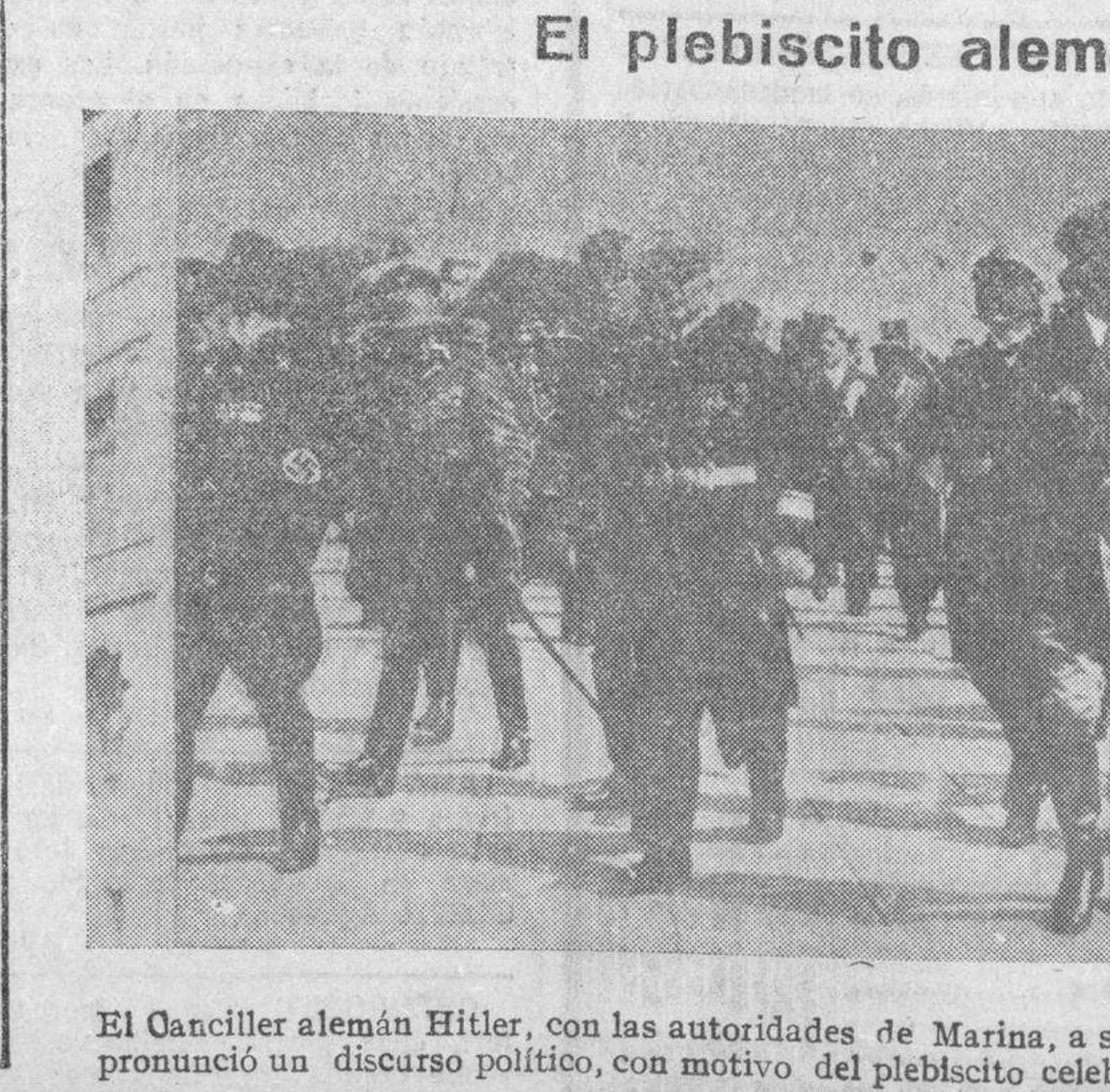
El Canciller alemán Hitler, con las autoridades de Marina, a su llegada a Hamburgo, donde pronunció un discurso político, con motivo del plebiscito celebrado el domingo en Alemania