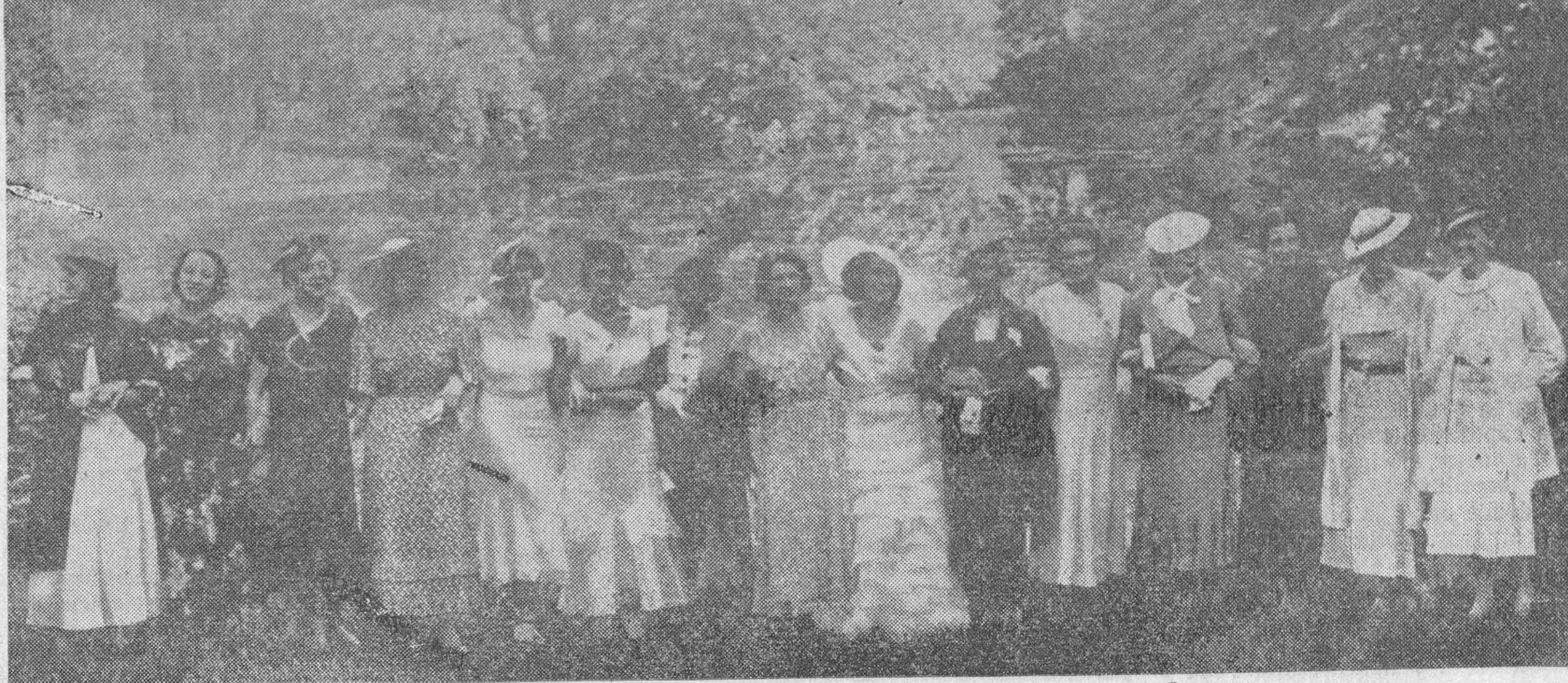
Las reinas de belleza elegidas por las distintas naciones europeas reunidas en el maravilloso Bosque de Bolonia, de París, antes de ir a Inglaterra, donde este año será elegida «Miss Europa»