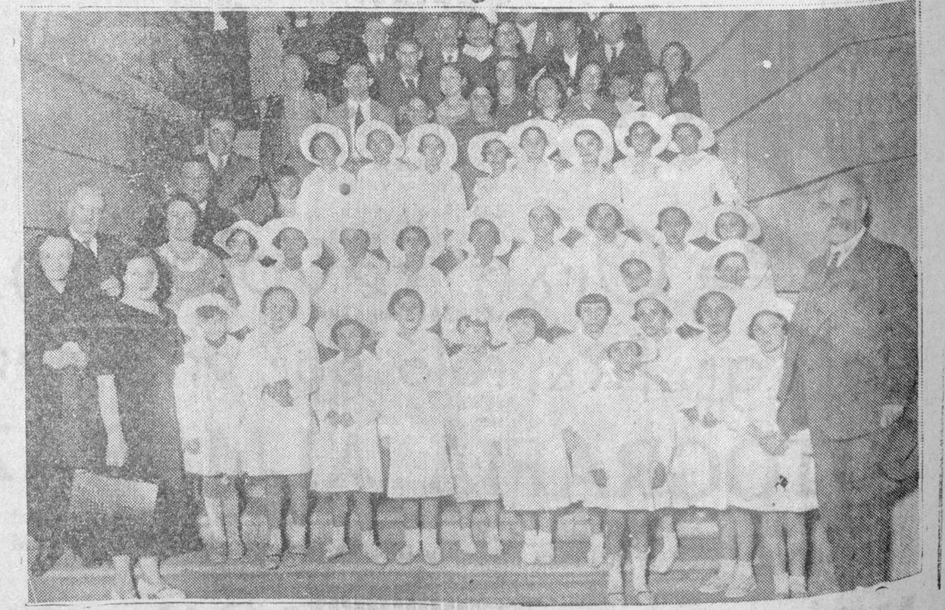
Grupo Escolar de niñas de Madrid y Salamanca que el Ministerio de Instrucción Pública envía a la Colonia de la Isla (Asturias).