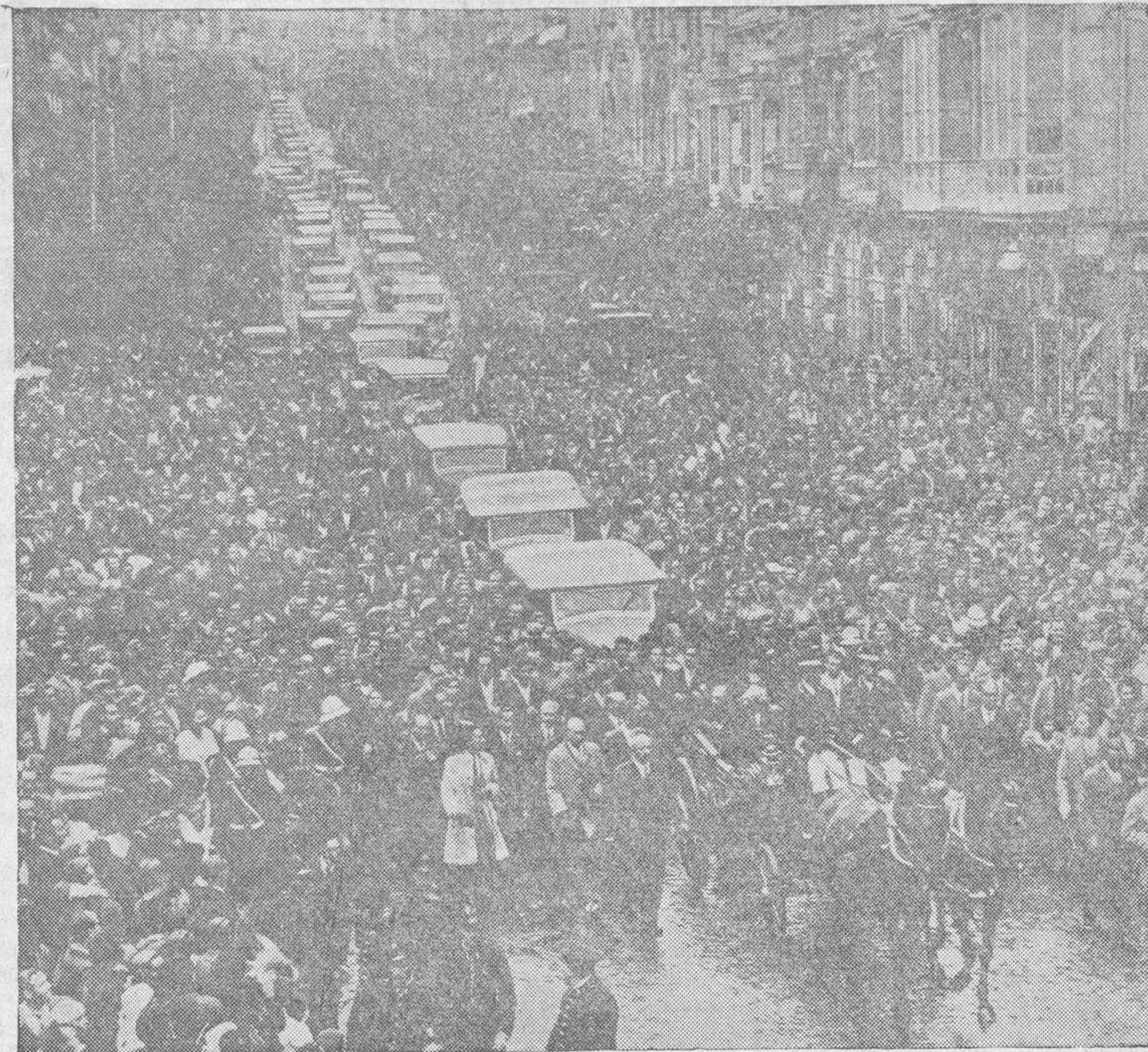
Imponente aspecto que ofreció una de las principales calles de Orense a la llegada de Su Excelencia el Presidente de la República, que ha sido objeto, en todo momento, del más cálido homenaje popular