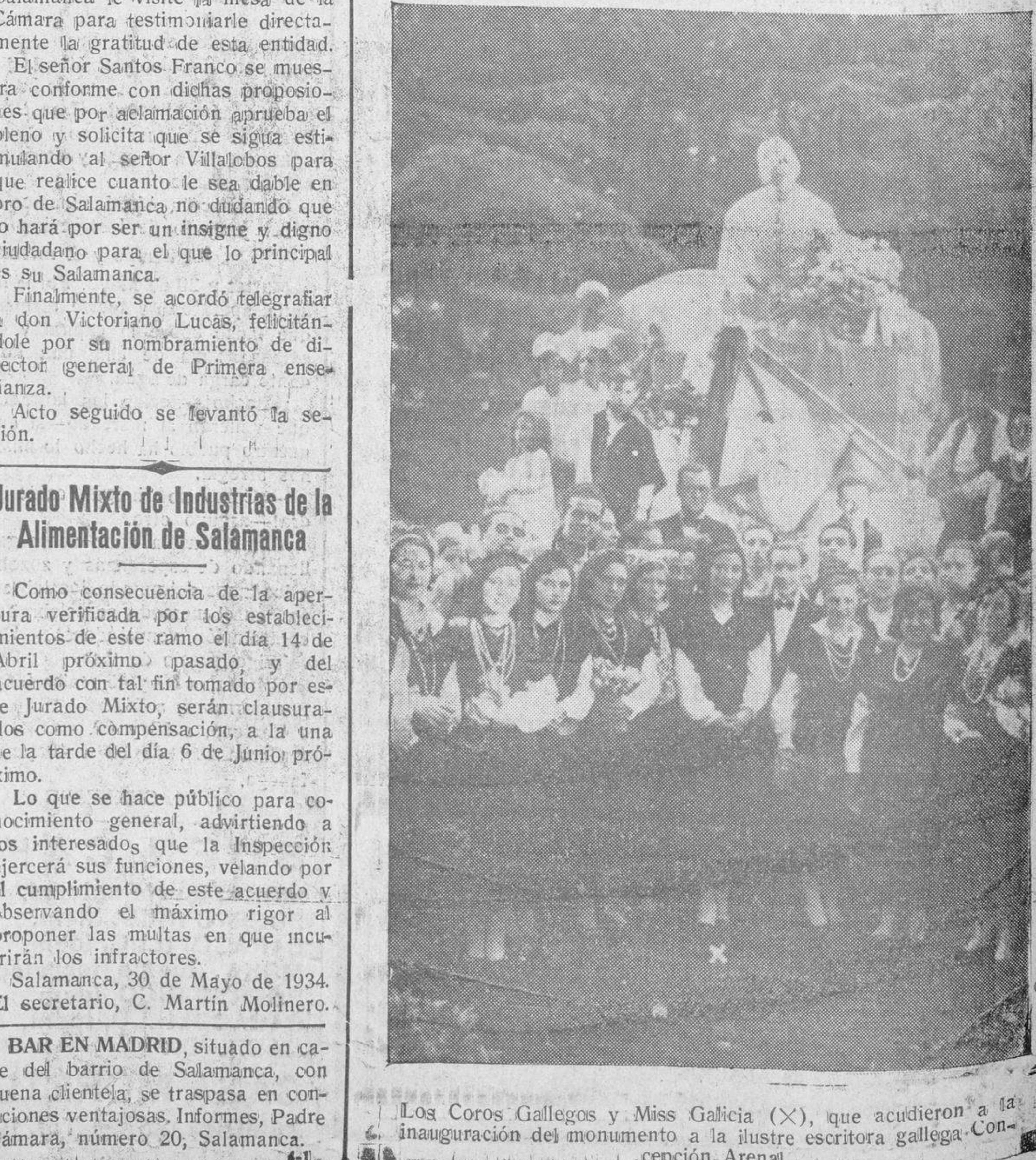
Los Coros Gallegos y Miss Galicia (X), que acudieron a la inauguración del monumento a la ilustre escritora gallega Concepción Arenal

revisar las liquidaciones cuyo importe haya sido satisfecho por los interesados, para ordenar en su caso, el reintegro de las cantidades indebidamente cobradas. En su consecuencia, los interesados pueden pasar de cuatro a seis de la tarde, excepto los sábados, por el domicilio de esta Cámara, Plaza de los Bandos, 4, donde serán informados por el servicio jurídico de cuantos extremos tienen relación con el asunto objeto del presente anuncio.—El presidente, Ludvino Corbo. SE VENDE la casa número 8 del Paseo de la Alamedilla, frente a la Escuela Elemental del Trabajo. Para informes, Paseo de las Carmelitas, 14 (Herradero). VACA HOLANDESA , superior, se vende. Informarán, en Villar y Macías, 6, entresuelo, derecha. EN ALBERCA , se alquilan dos casas de nueva construcción, con cochera y en sitio de muy buena vista, frente al Cuartel de la Guardia civil, a las afueras del pueblo. Darán razón, Manuel Cereceda, en Alberca (Salamanca).