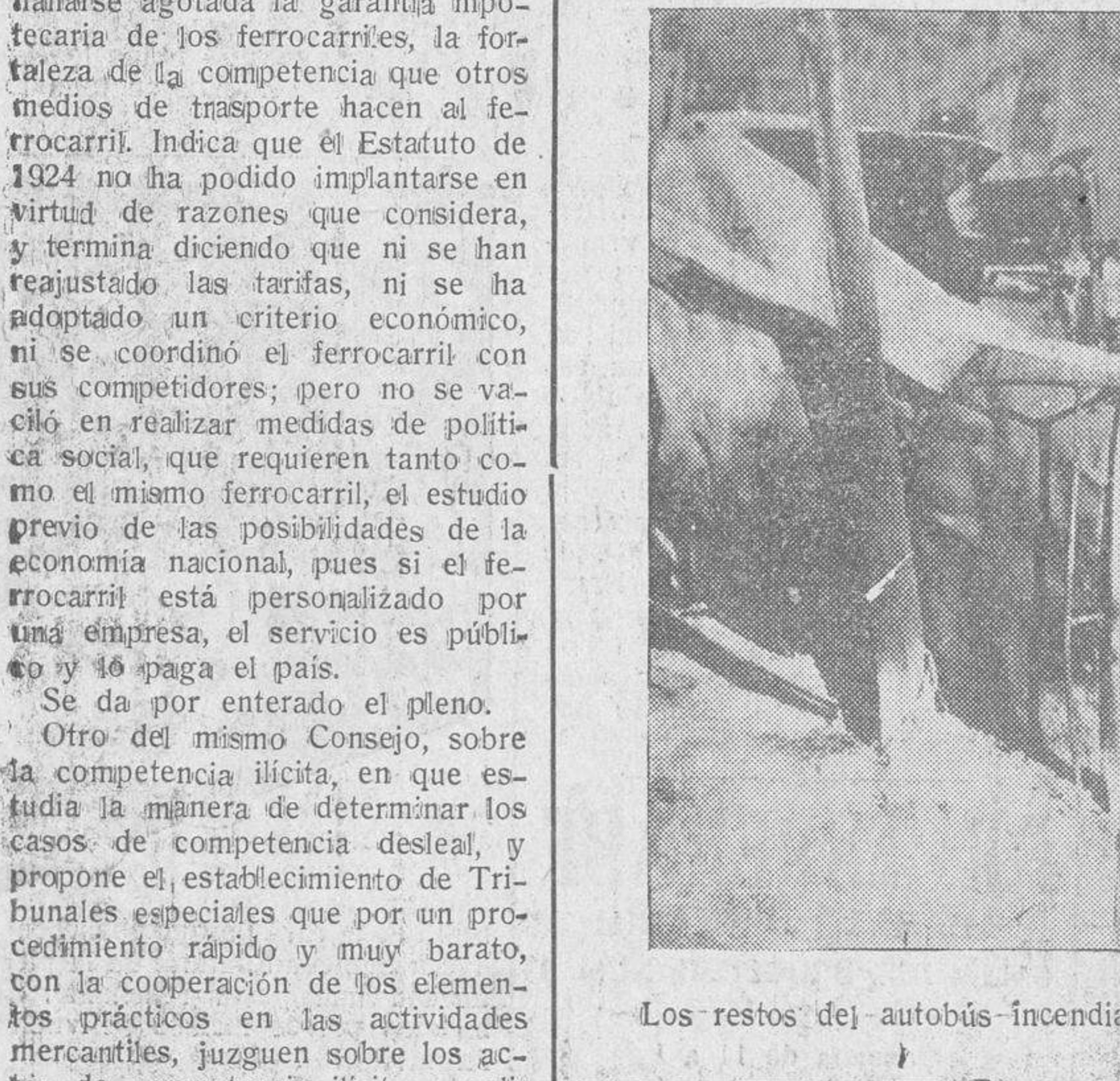
Los restos del autobús incendiado cerca de Bayona, en el que murieron trece turistas de Madrid, que se dirigían a París