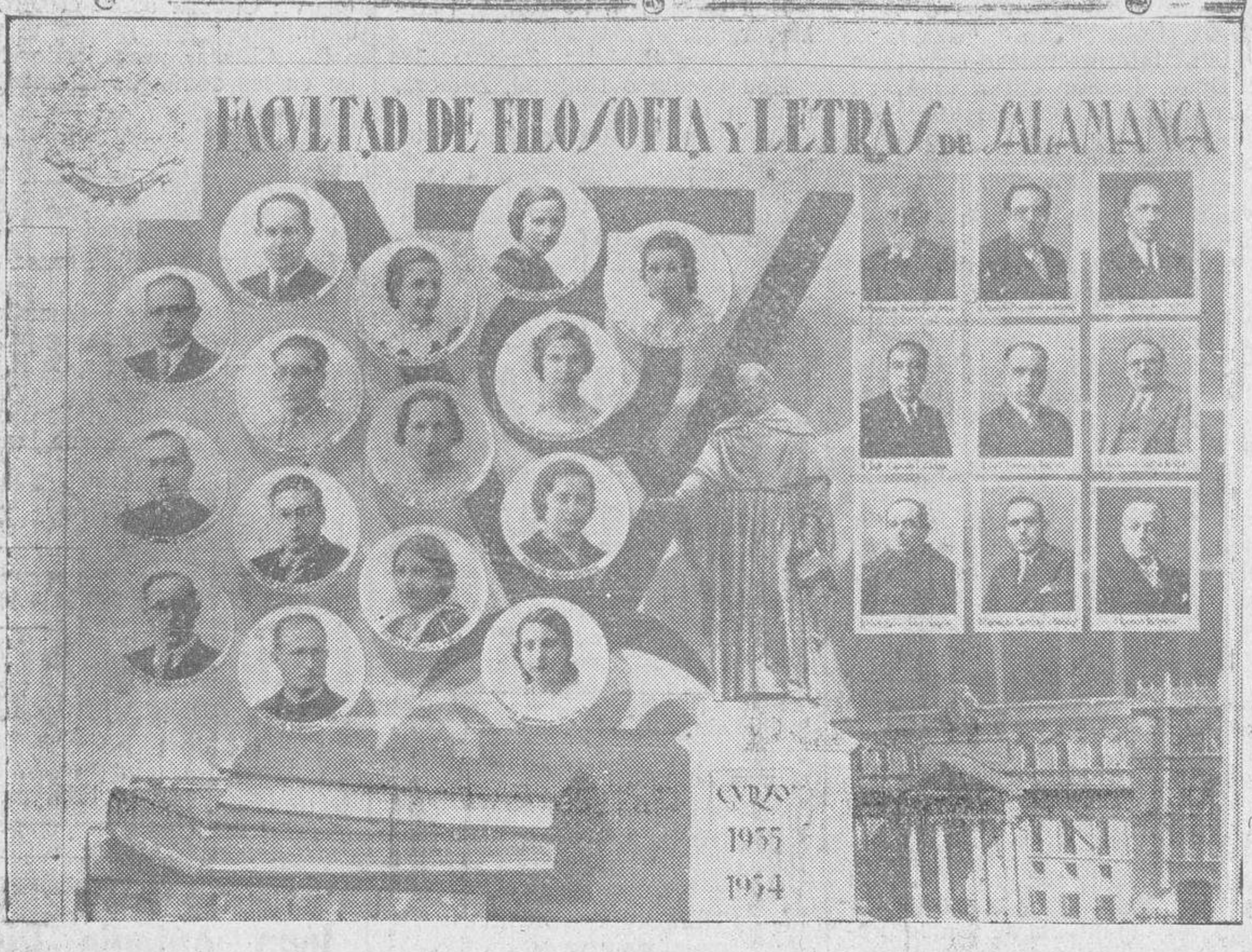
La orla de los alumnos de la Facultad de Filosofía y Letras, que terminan sus carreras, cuyos nombres publicamos en nuestro número de ayer.

EL DIA DE MAÑANA Sol: 4,47; pas. mer. 12,12; pón. 19,38. Luna: 23,25; pas. mer. 4,25; pón. 9,32. JUNIO 1 Viernes Stos. Inigo, abad; Pablo, Pánfilo, presbítero; Tespelo, Isquirión y Simeón, monjes.