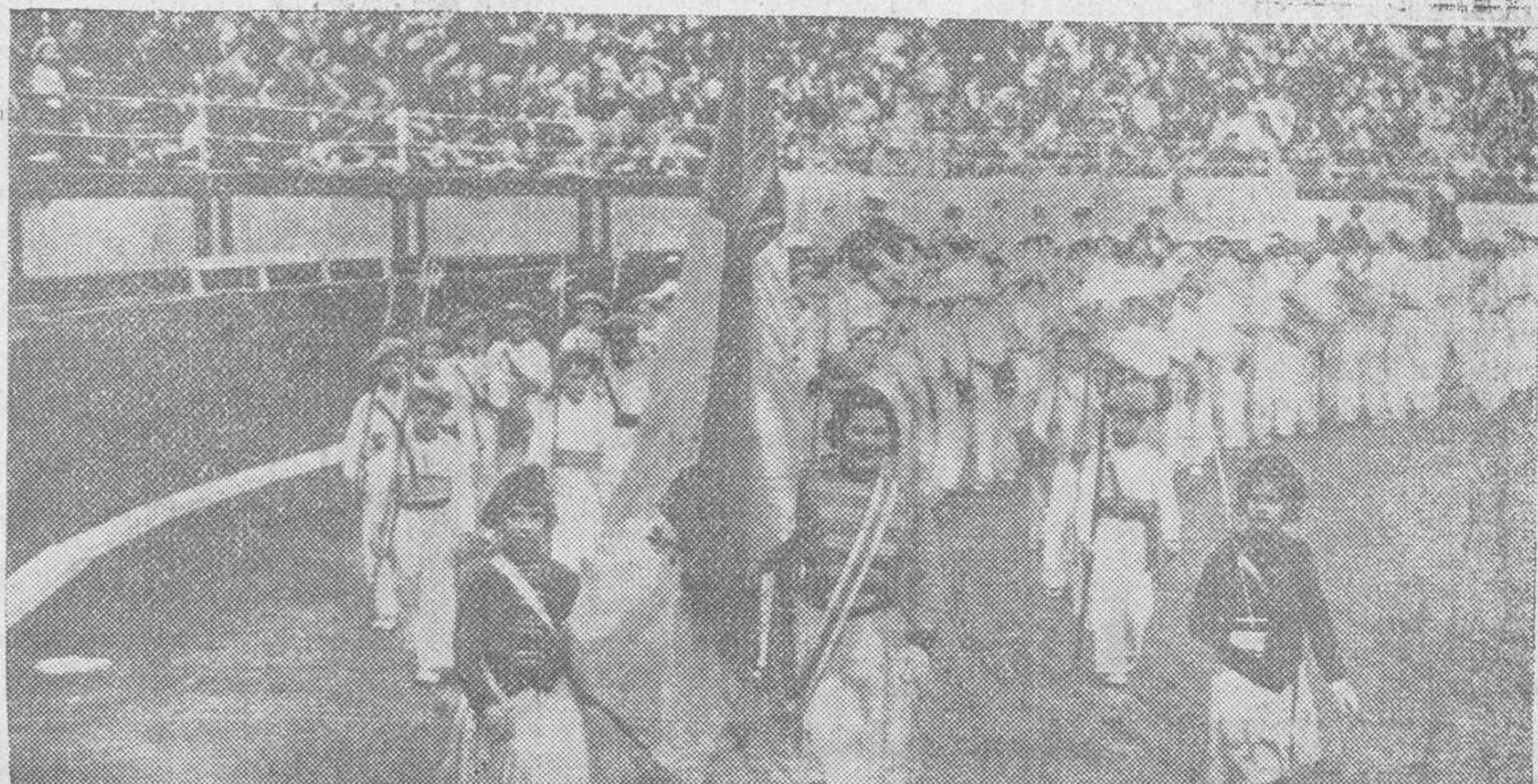
La sociedad Euskal Billera, de San Sebastián, celebró el domingo una fiesta a beneficio del Hospital y Osa de Misericordia de la capital donostiarra. La foto recoge el momento del desfile de la «tamborade»