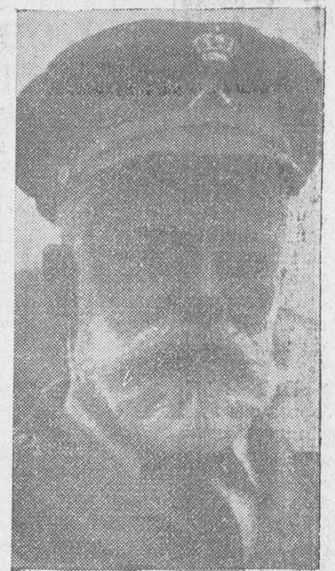
El general don Miguel Cabanellas, recientemente nombrado Inspector general de Carabineros