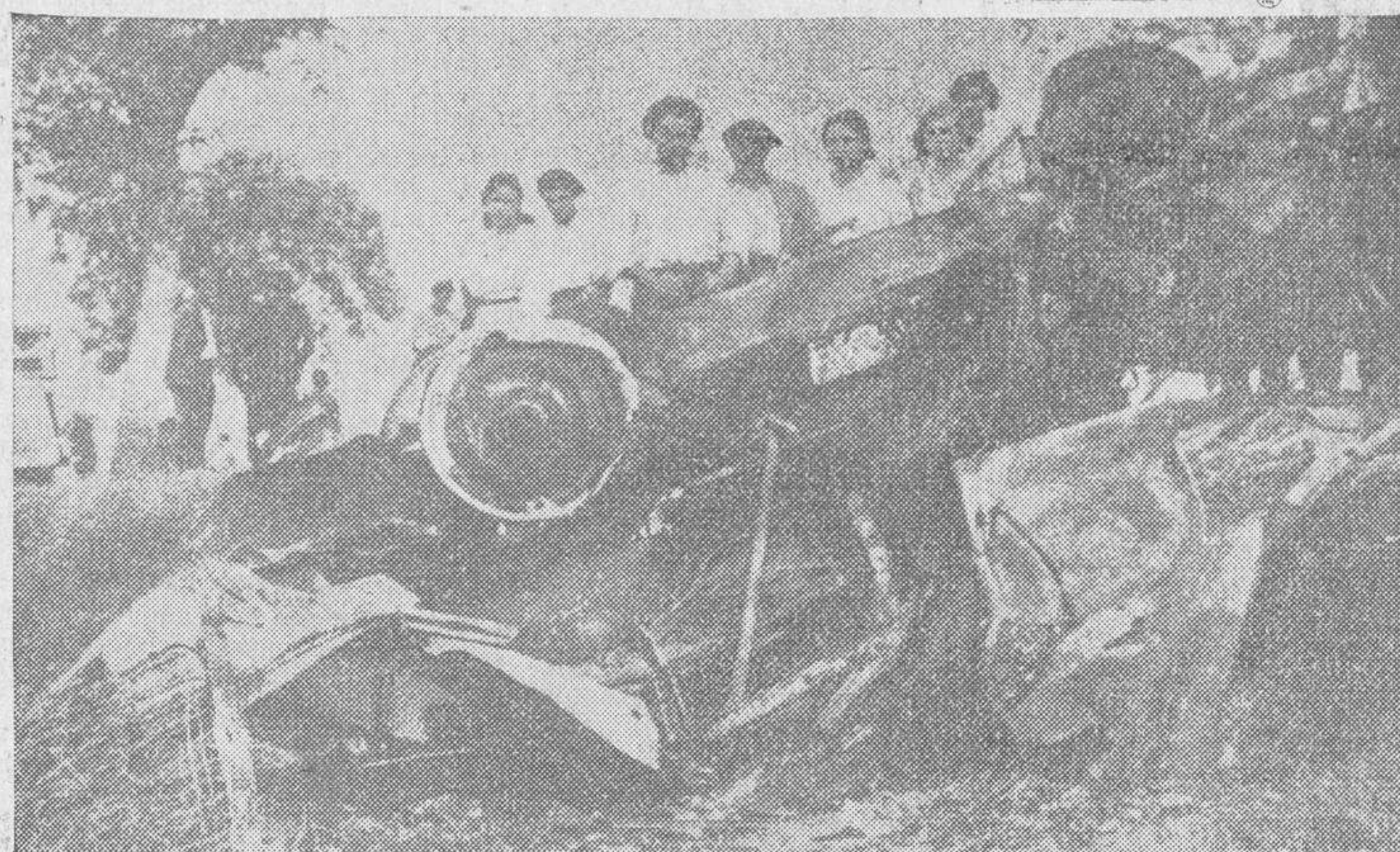
En el pueblo de San Asensio (Logroño), ocurrió el pasado domingo un trágico accidente automovilista, del que dimos cuenta en nuestro último número, al chocar un coche de turismo y una camioneta de mercancías. Resultaron cinco personas muertas y otras cuatro con heridas gravísimas. La foto muestra el estado en que quedó el coche de turismo