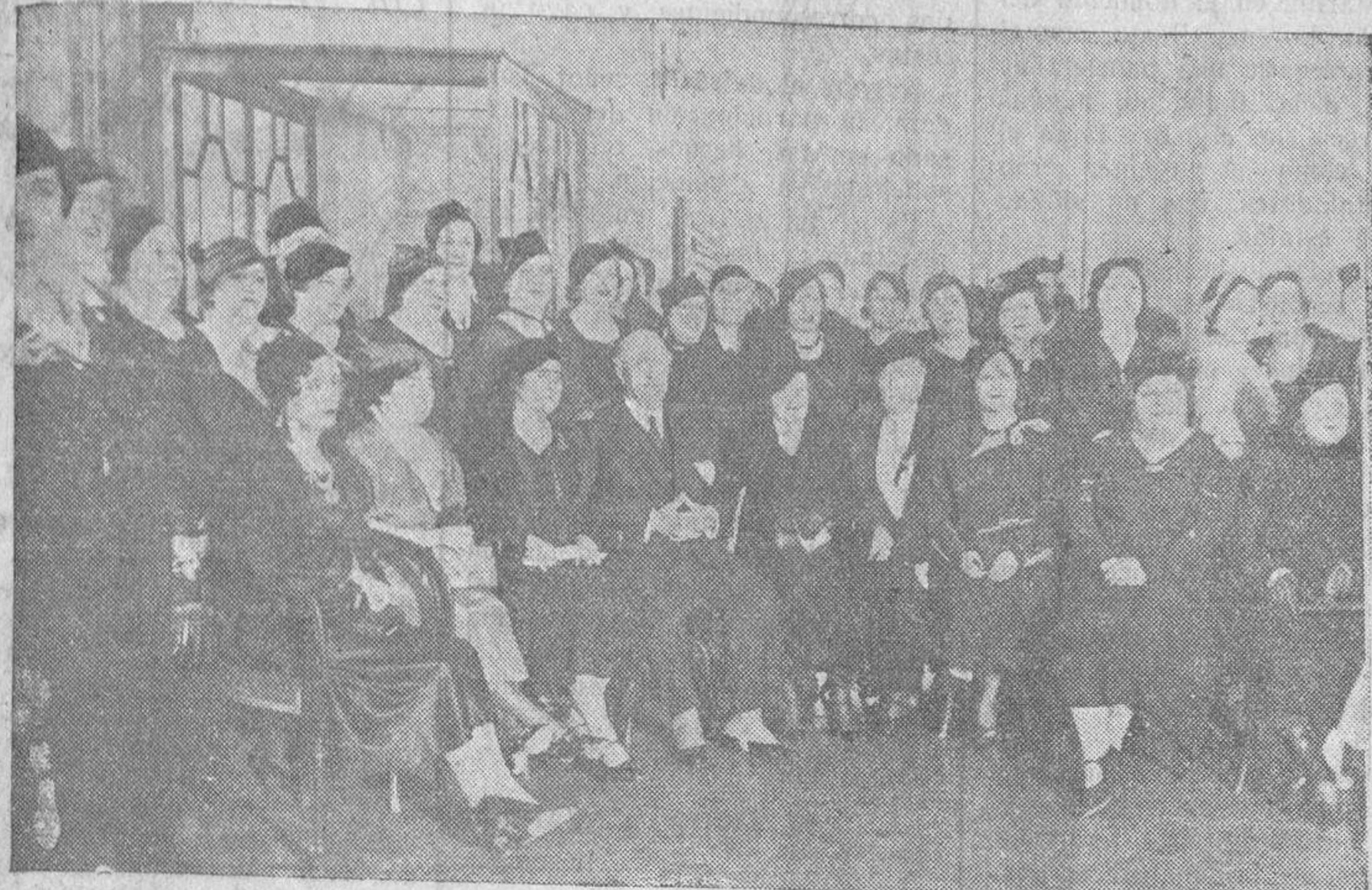
Las mujeres del grupo republicano radical, obsequian al presidente, señor Lerroux, con un banquete