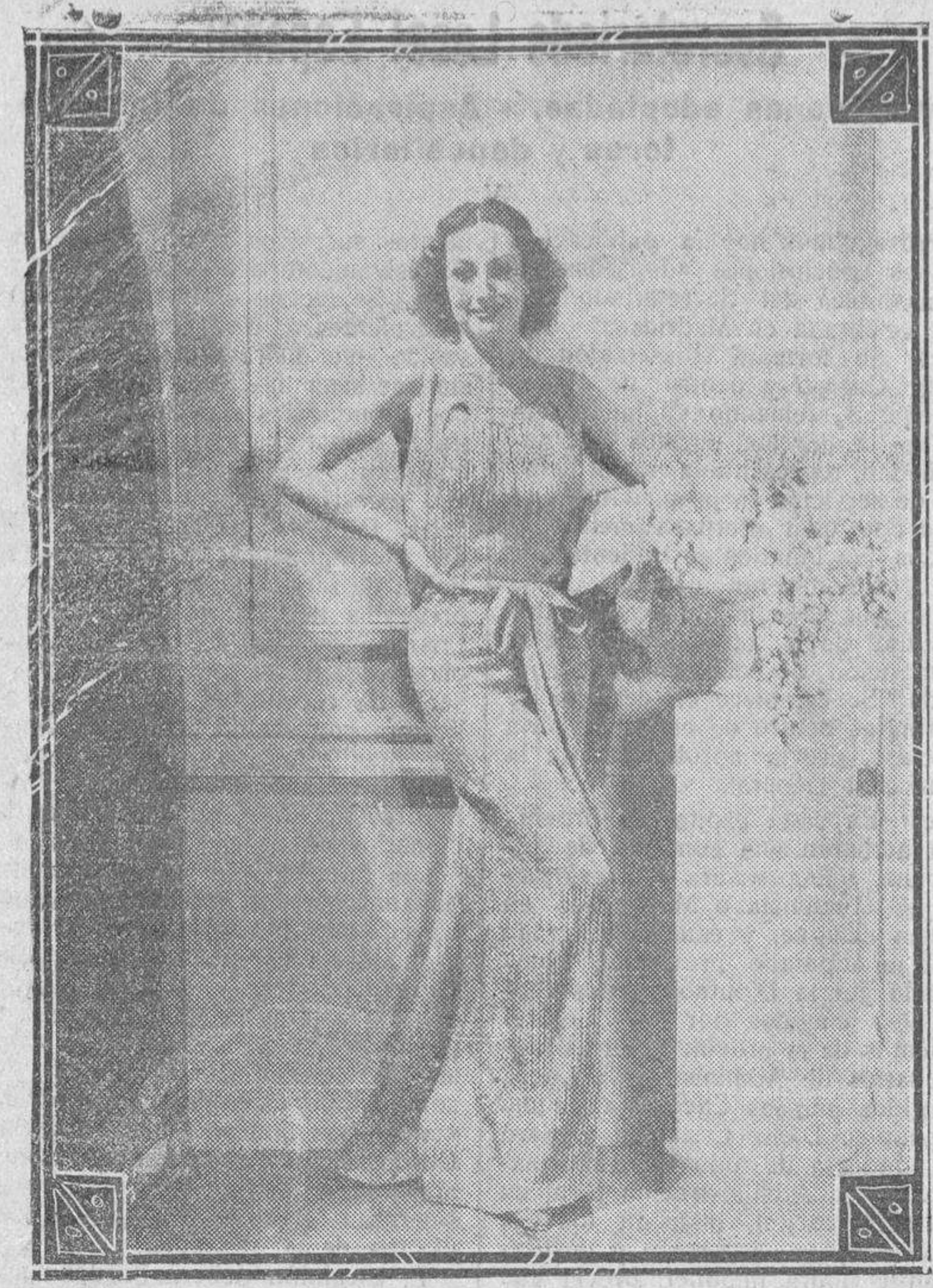
Joan Crawford, estrella de la Metro-Goldwyn-Mayer y una de las mujeres que mejor viste en la coloma cinematográfica

JULIAN COCA GASCON BANQUERO CASA FUNDADA EN 1893 CAJA DE AHORROS IMPOSICIONES Y REINTEGROS TODOS LOS DIAS LABORA- BLES. — PRACTICA TODA CLASE DE OPERACIONES DE BANCA Y BOLSA Salamanca y Guijuelo DOCTOR RESCO, NUM. 29 FILBERTO VILLALOBOS (EDIFICIOS DE SU PROPIEDAD)