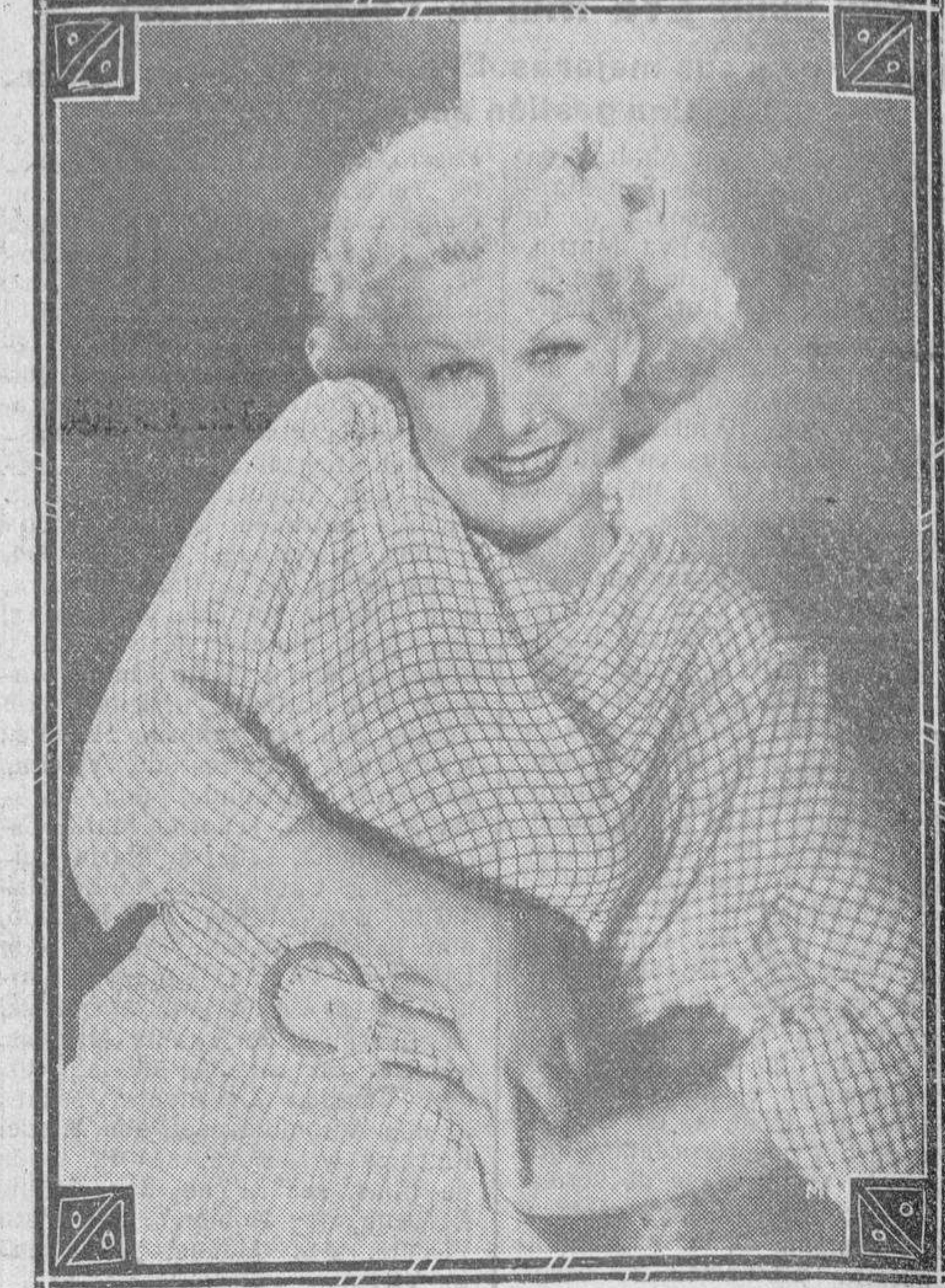
Jean Harlow, encantadora estrella de la Metro-Goldwyn-Mayer