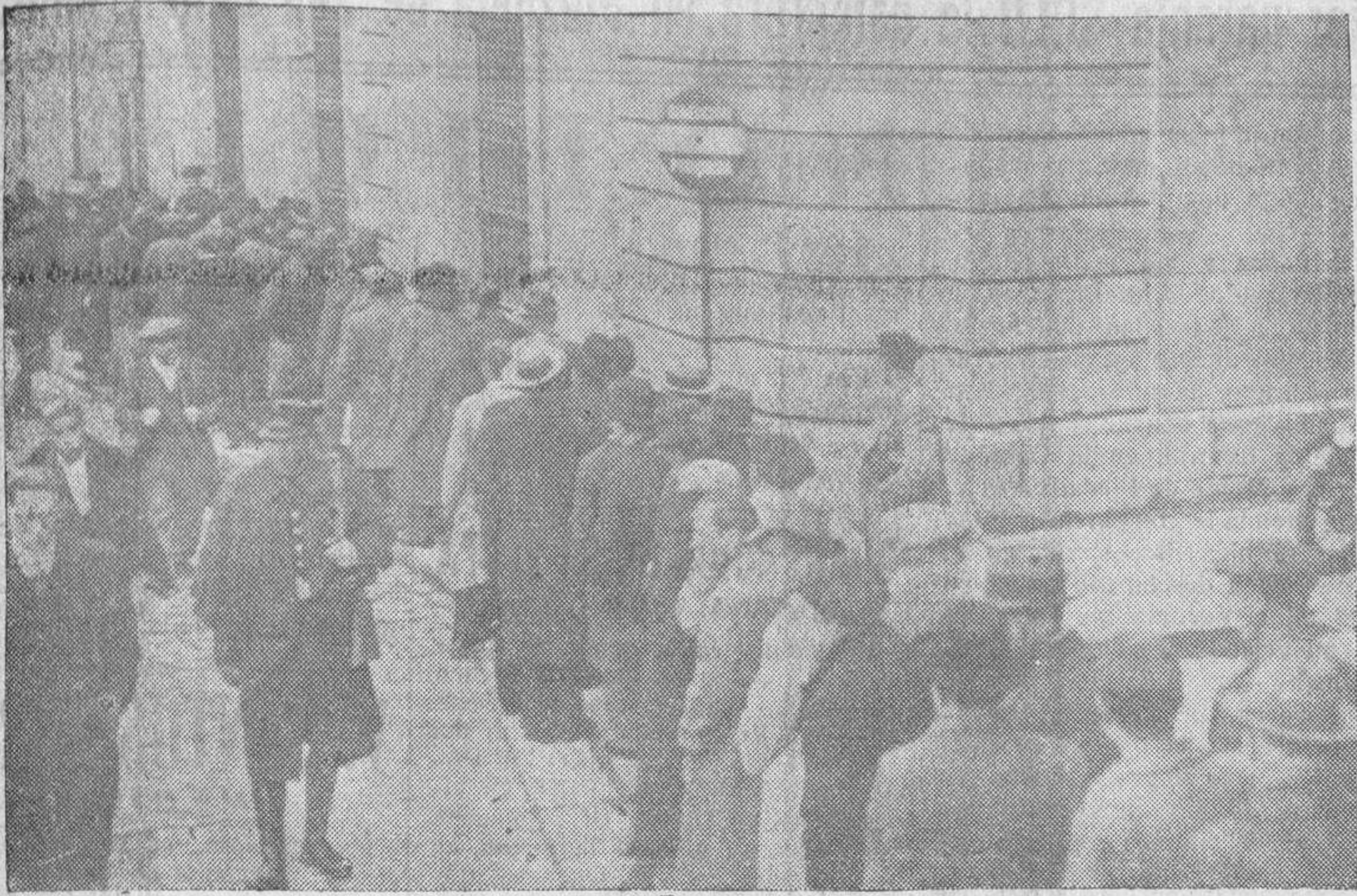
Debido a la huelga de Artes Gráficas no se publica más que la "Hoja Oficial", que para adquirirla hay que aguardar cola en el ministerio de la Gobernación