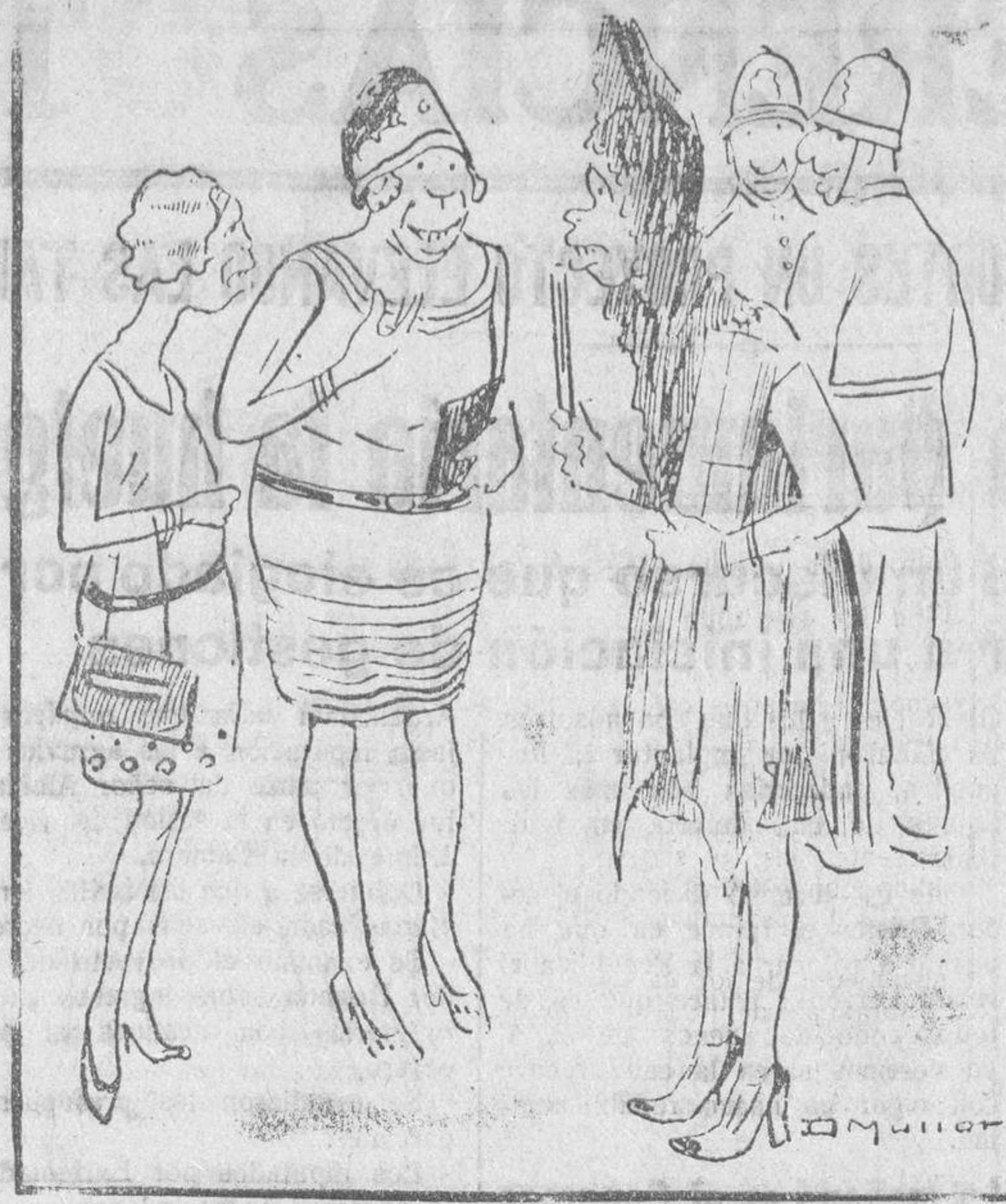
—Gracias a la nueva orden sobre los piropos, podemos ir tranquilos, porque estaban los hombres insoportables...

Los dos últimos eran suplentes. Según el fiscal, el hecho de autos constituía un delito de homicidio, con la circunstancia agravante de desprecio del sexo, por ser la finada una mujer, y otro de tenencia de armas, de los cuates acusaba como autor al procesado.