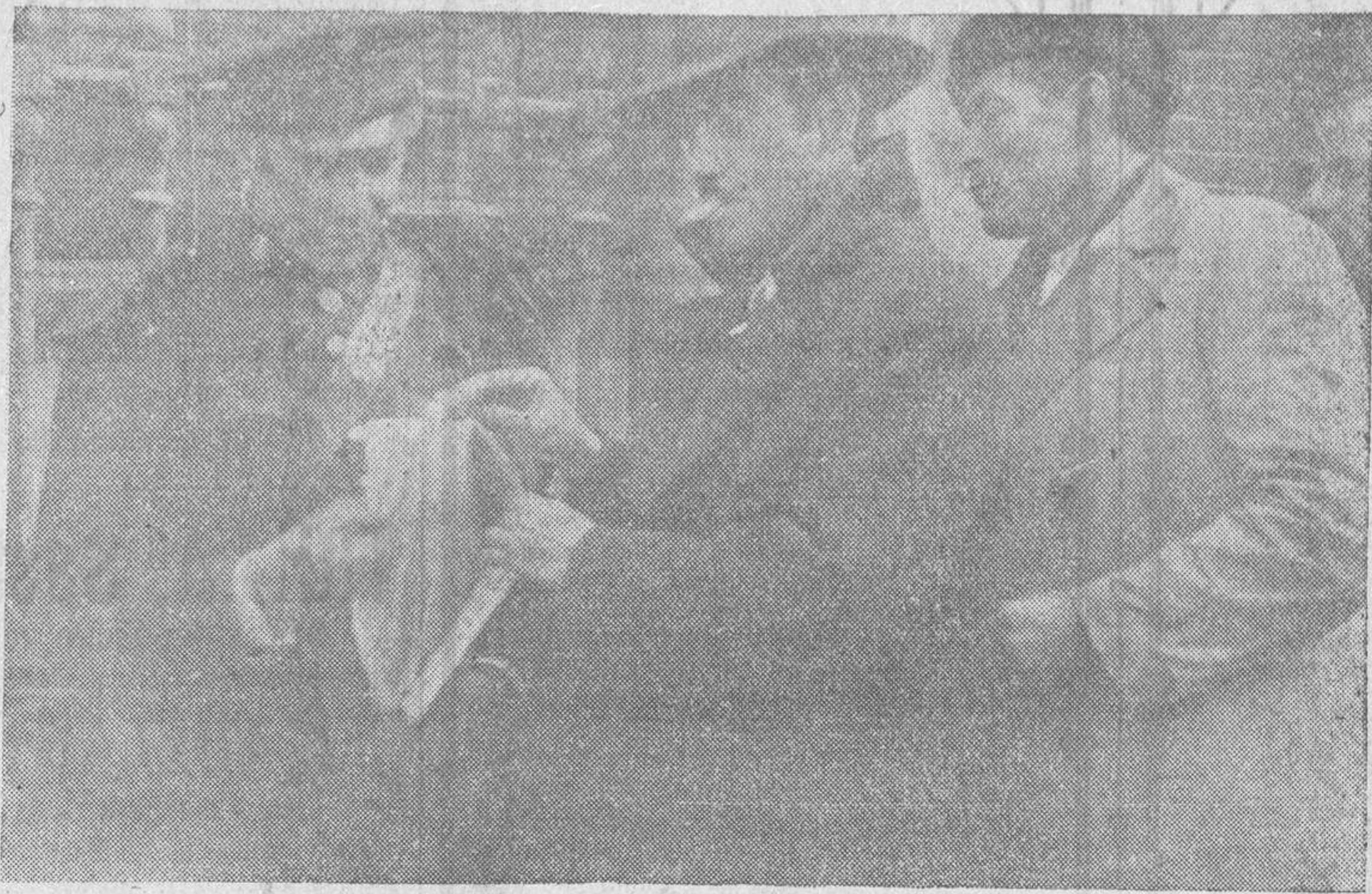
Debido a la huelga de periódicos, sólo se edita la "Hoja Oficial", la cual es vendida por los guardias de Seguridad