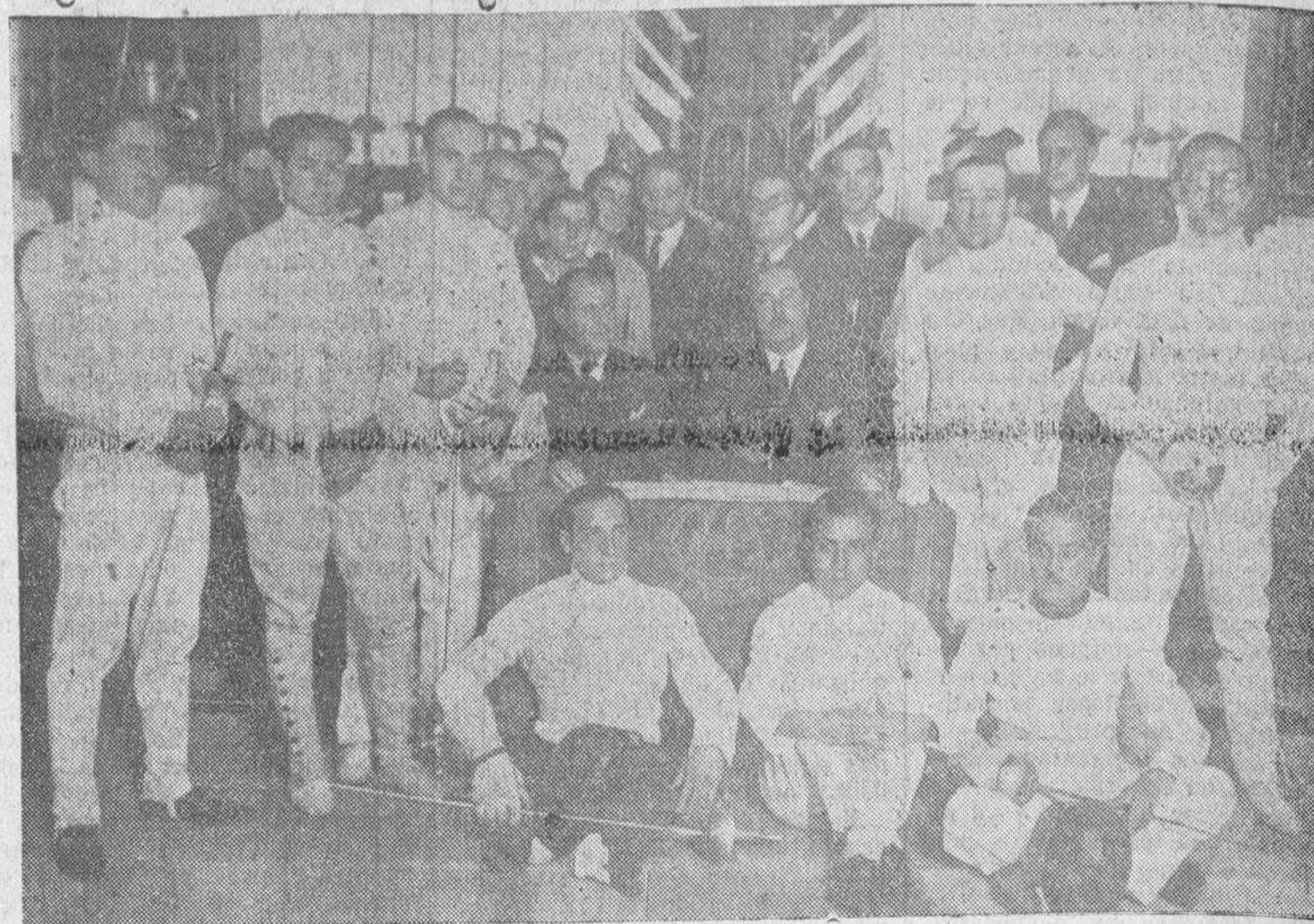
La asociación de esgrimidores, de Madrid, inaugura su temporada 1934, con un asalto a espada. Grupo de participantes y jueces