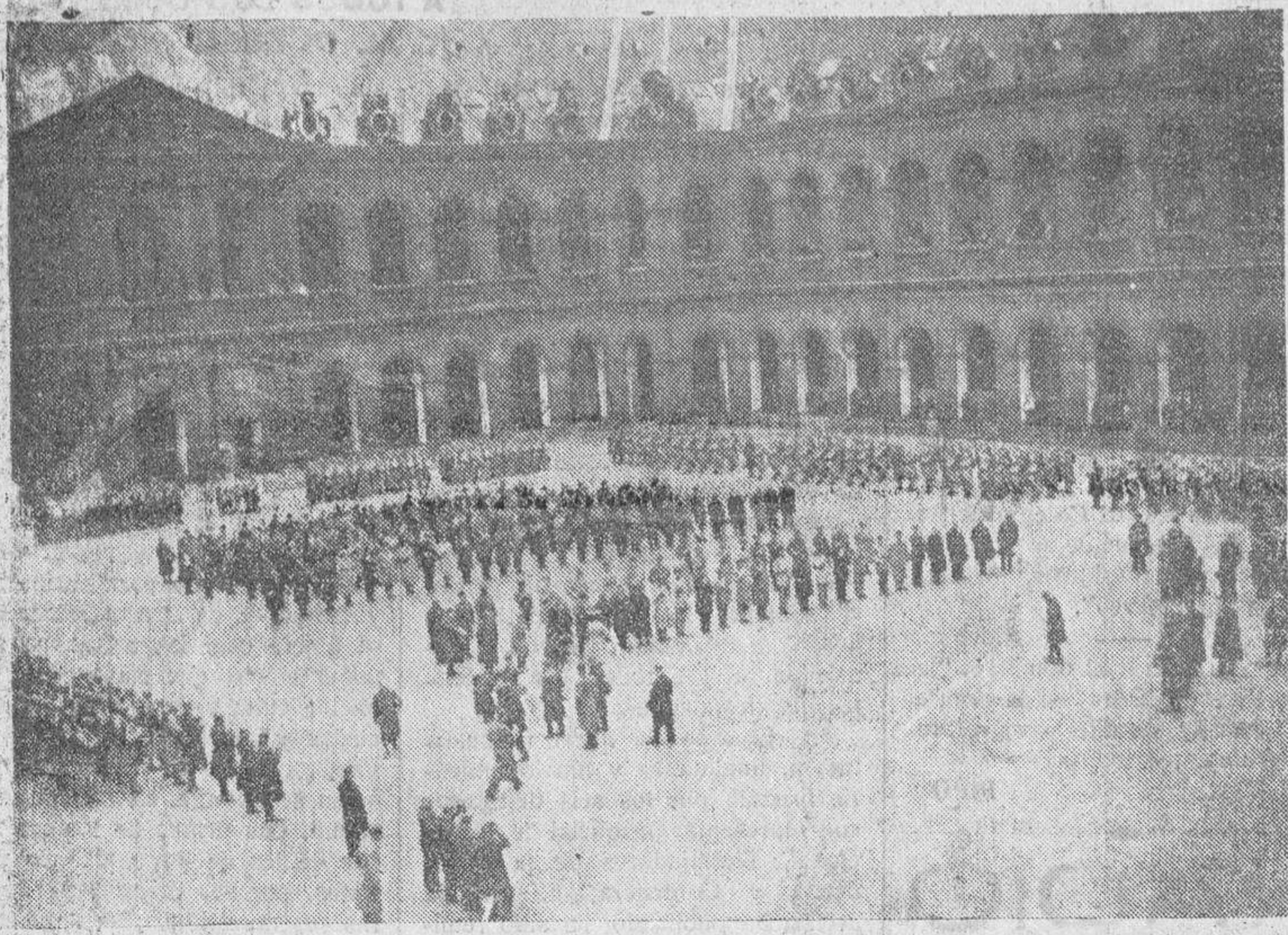
Recientemente se ha verificado en el patio de los Inválidos, de París, la ceremonia de imponer una centena de condecoraciones a héroes de la Gran Guerra, por los generales Weygand y Gouraud. El acto fue solemnisimo y constituyó una brillante prueba del patriotismo francés

Stos. Raimundo de Fitero, abad; Logino, Aristóbulo, Benigno y Nicandro, mrs.