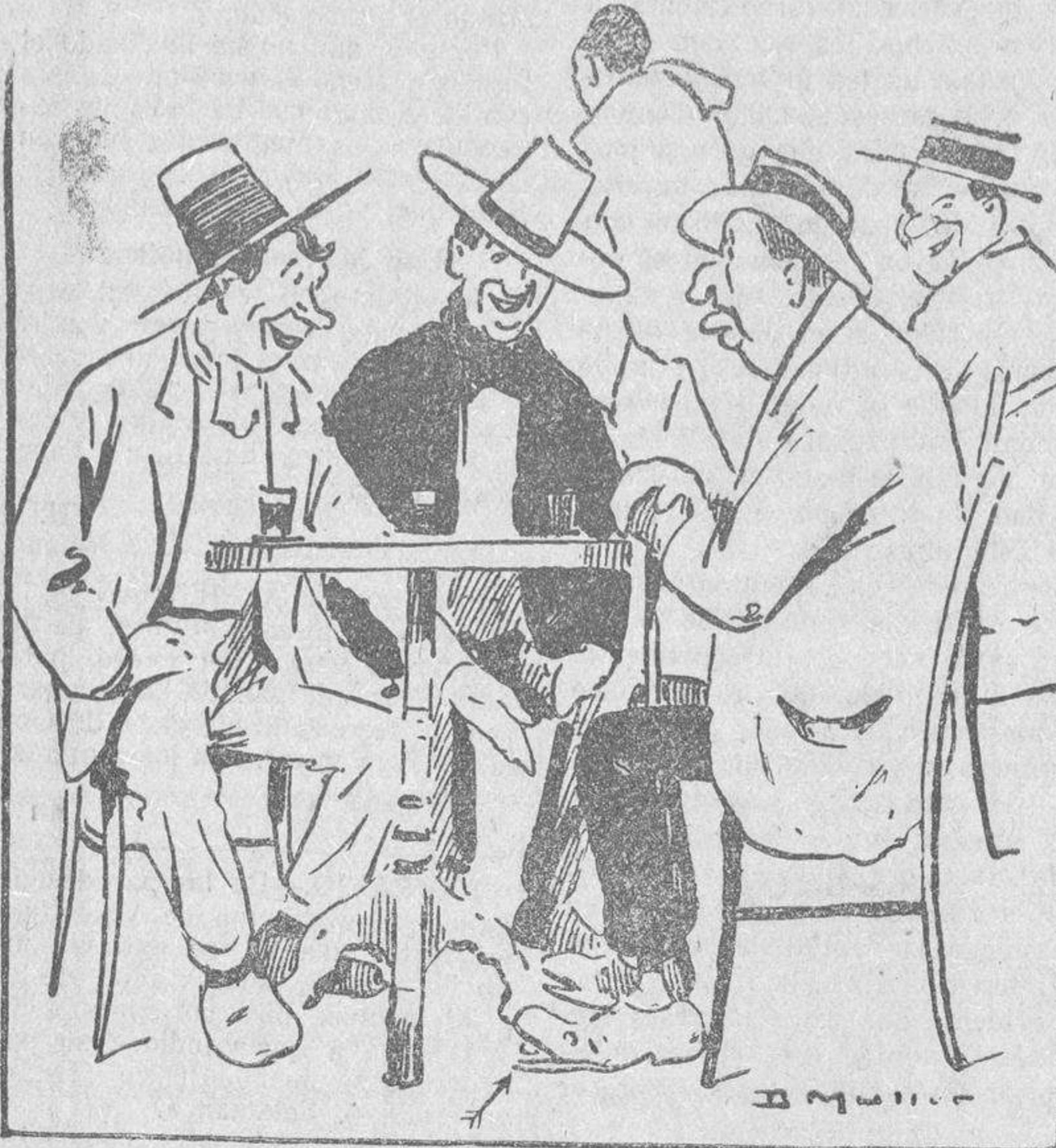
—Y ¿por qué no puede usted creer que soy procurador? —¡Hombre! No se comprende que, siendo usted procurador, no se haya procurado un par de zapatos...

Desde la mesa en que escribo, al través del balcón, contemplo toda una manzana de solares, encuadrada por calles de primer orden, que está vacante. Son más de dos hectáreas. Hace muchos años que está así. Sobre ella podrían construirse diez y seis hermosas casas; más de 500 hombres trabajarían durante dos años. Sin embargo no se trabaja. En Madrid hay 40.000 obreros parados; la vivienda es más cara y peor que en ninguna ciudad española. Sin embargo, sobre estos solares no se trabaja, porque el dueño no lo consiente si no le pagan un pre-