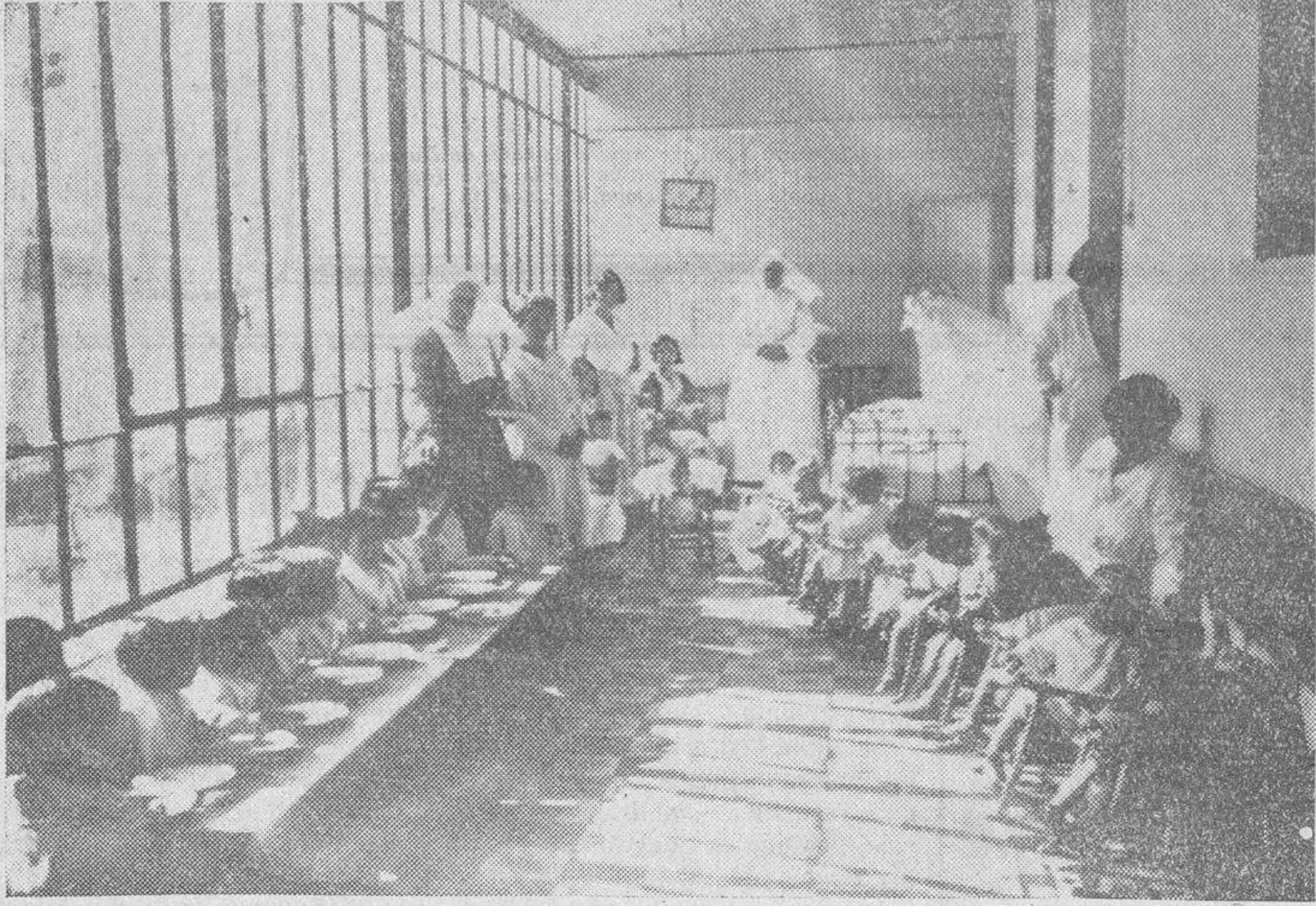
Los niños de la Casa-Cuna a la hora de la comida