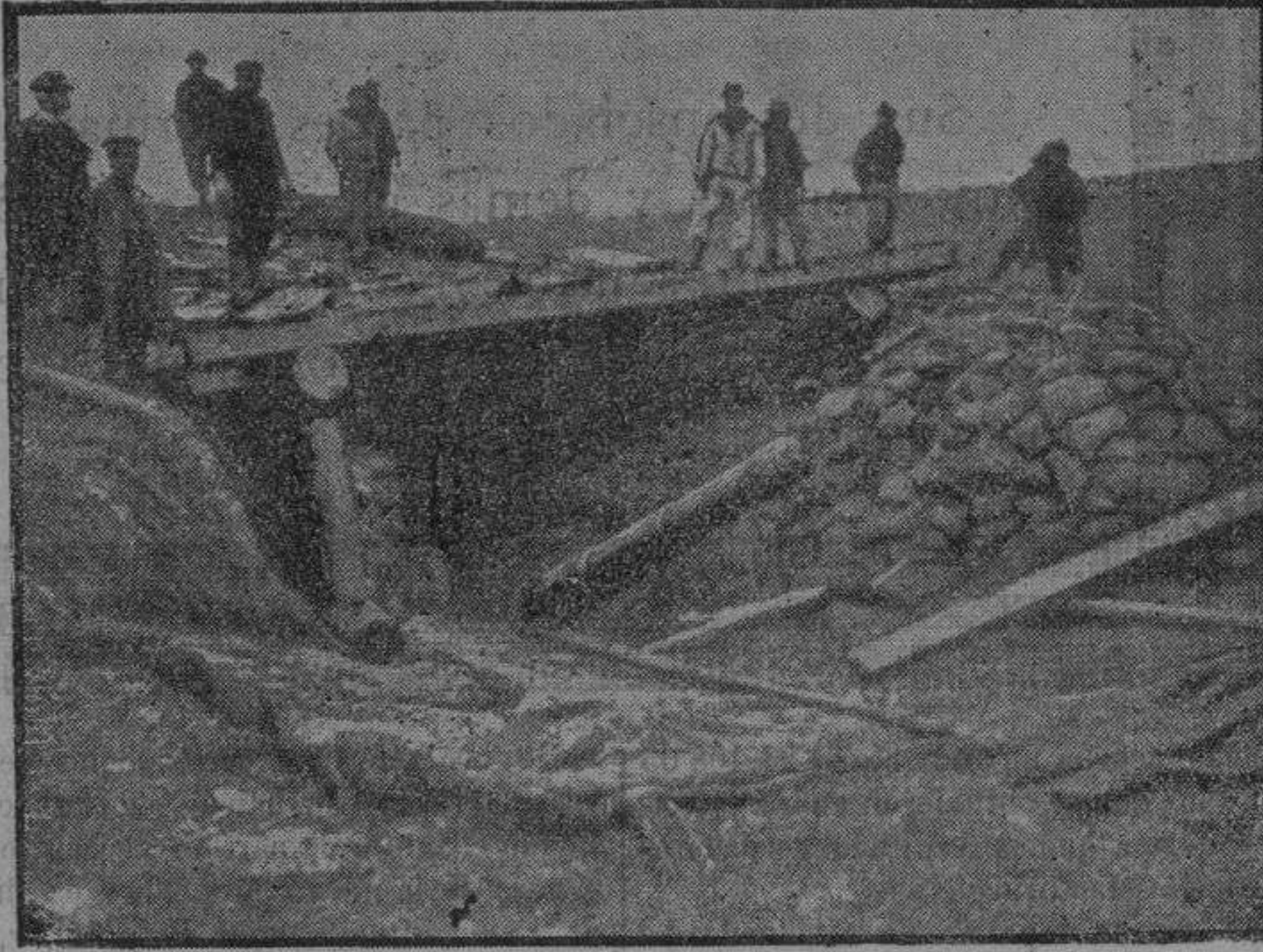
Casamata destruida en el frente del Meurthe et Moselie