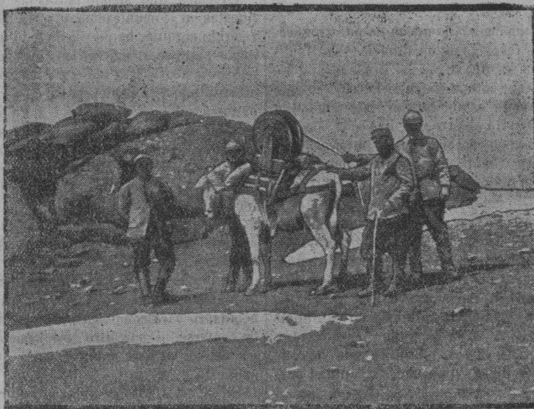
Ejército oriental.—Tendido de una línea telefónica