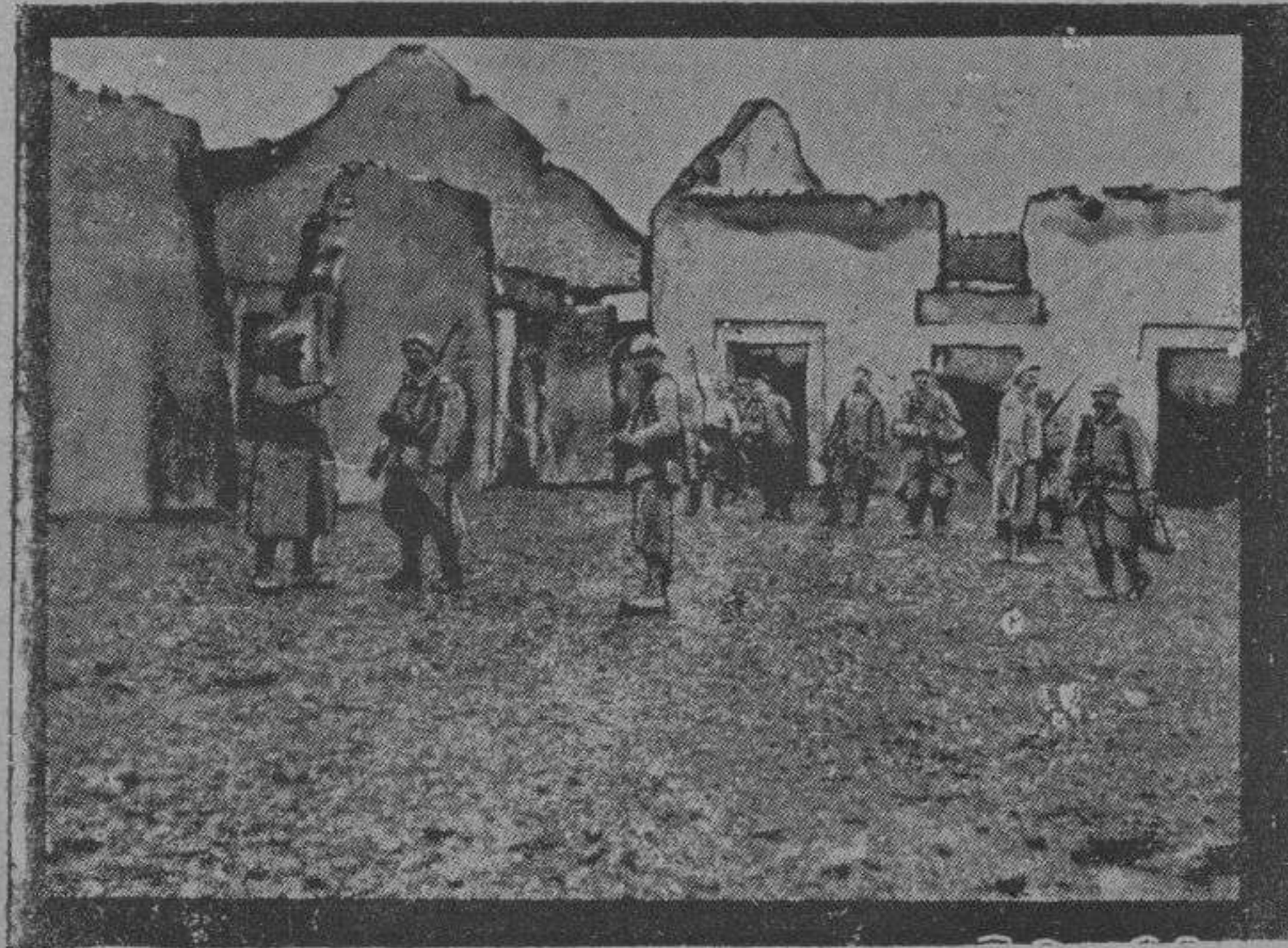
Bajo el fuego en las ruinas del Somme

sin conseguir su objeto, pues todos nos echamos a reír. Y unas chiquelas le gritaban: