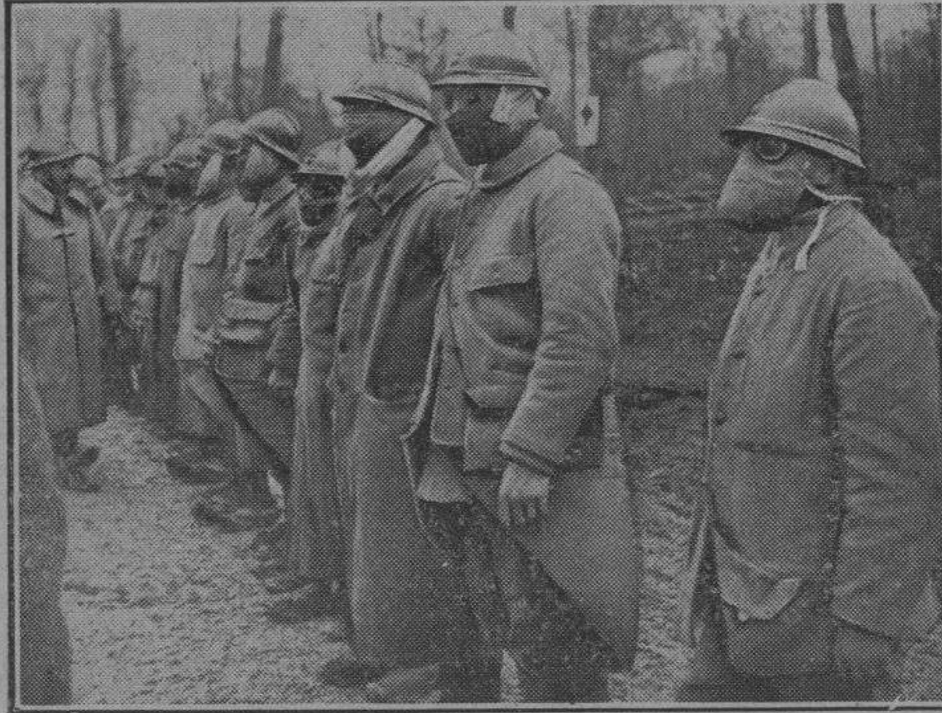
Antes de la partida de los soldados para las trincheras de primera línea, el jefe pasa la revista de las máscaras contra los gases asfixiantes

se deja caer en el sofá y, echando atrás la cabeza y sacando el busto, suspira á la vez que arroja la «charpe» sobre el respaldo de una «marquesita» y el manguito sobre una butaca.