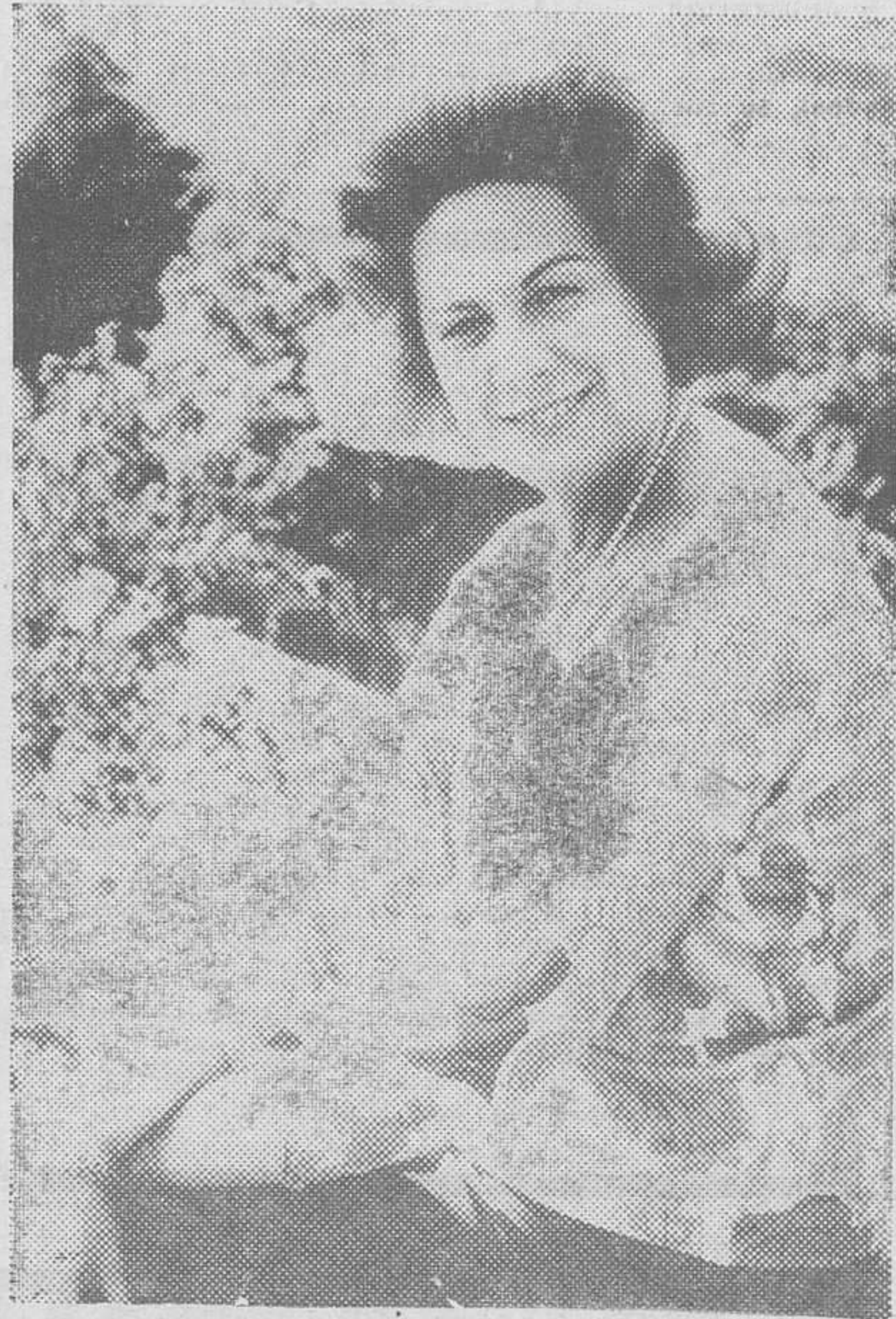
Para Renata Tebaldi, un collar de perlas colgado en un ángulo del espejo del camerino es garantía de suerte en el escenario.

También Yul Brynner insistió en que lo que cuenta es el trabajo y el talento. Lo que no impide que siempre lleve encima una muleta de jade. Pero explica que se trata de una «simple manía, frecuente en las personas que como él, viajan mucho. Muchos actores y actrices