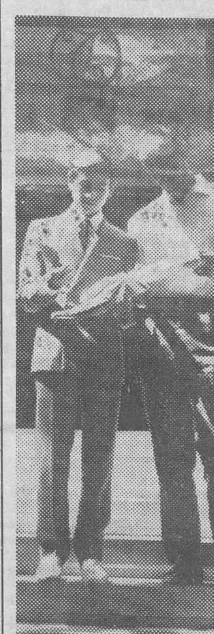
Madrid. — Los famosos matadores de toros, Antónete y Palomo Linares, salen del Satorio de Toreros, consultando sus «altas», después de los respectivos percances sufridos en los ruedos españoles y franceses, pues Antónete fue herido en Francia. Palomo está a punto de comenzar su «mes loco»: 31 corridas en 30 días