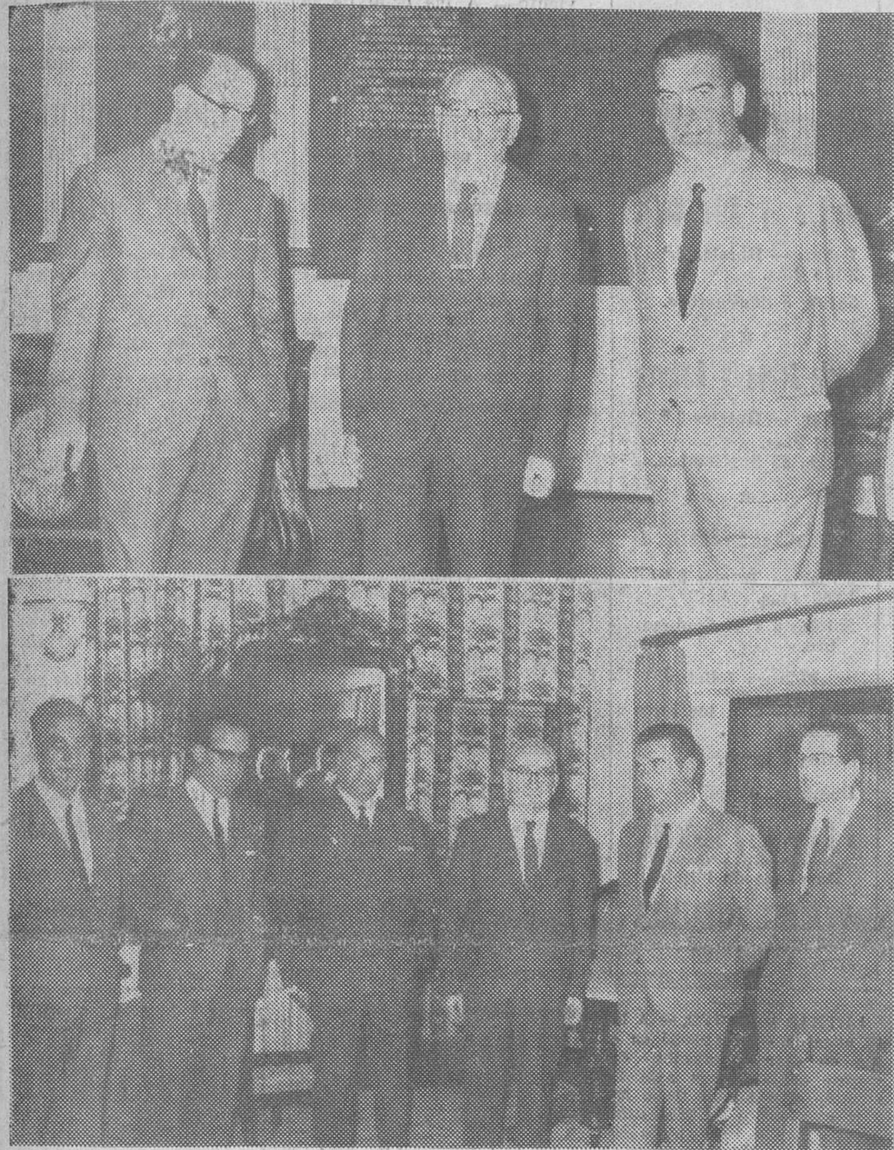
El director general de Urbanismo, en el curso del cambio de impresiones celebrado en el Ayuntamiento y reunido después con el gobernador civil accidental, alcalde de la ciudad, vicepresidente de la Diputación, primer teniente de alcalde y delegado provincial de la Vivienda.

Se amplía la zona del polígono residencial al casco viejo de Gamonal