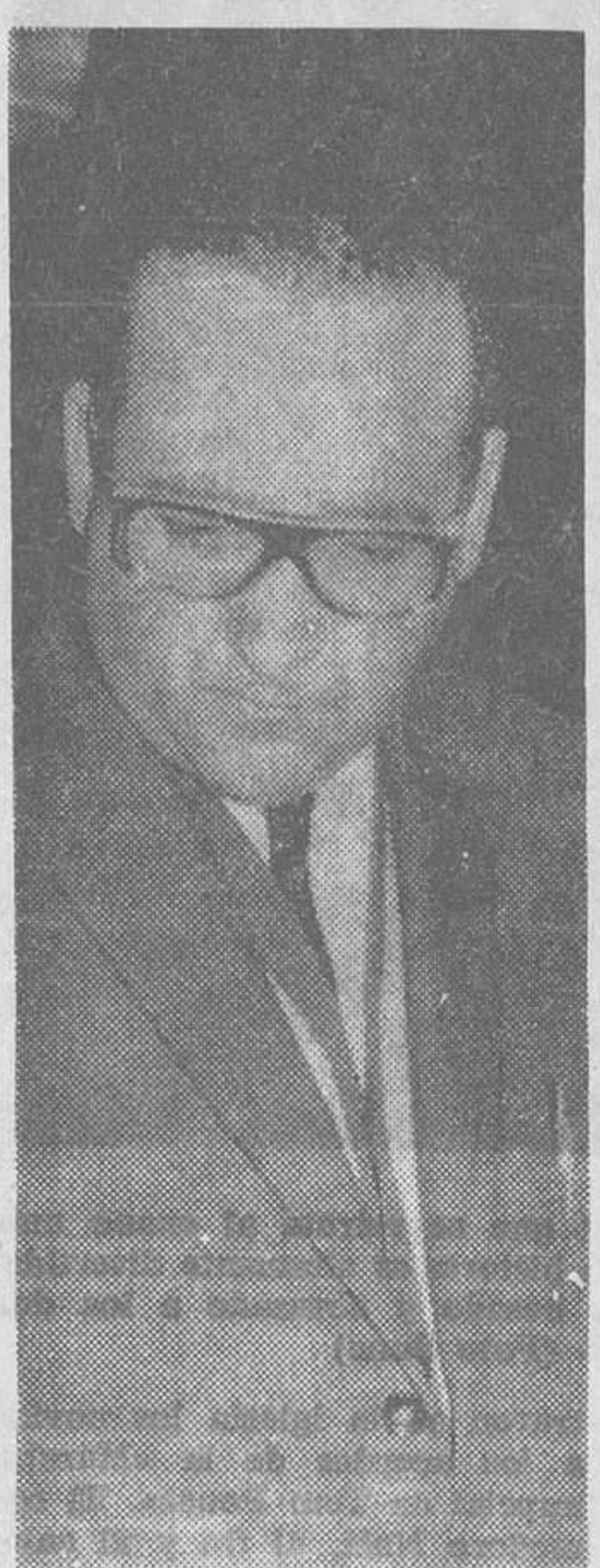
El maestro internacional cubano, Eleazar Jiménez Zerquera

des éxitos, como así lo he observado en la Costa del Sol. En el trato y en la forma de ser, los españoles son fabulosos. He dejado muy buenos amigos aquí, en Andalucía y anhelo volver pronto.