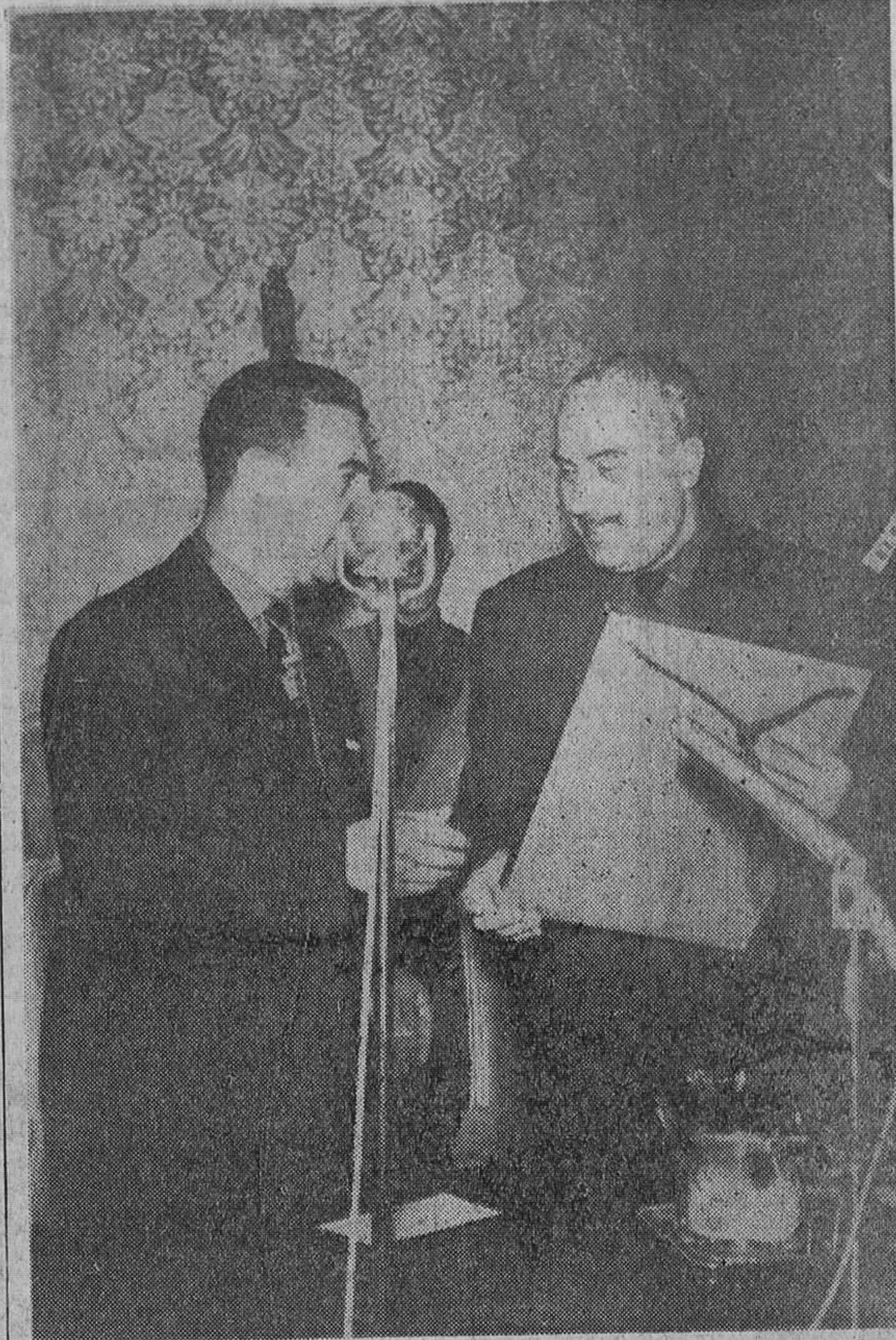
En acto solemne tuvo lugar ayer en el palacio provincial la imposición de la Medalla de Oro de la provincia de Burgos al Frente de Juventudes.

Asistieron al acto nuestras autoridades y jerarquías nacionales