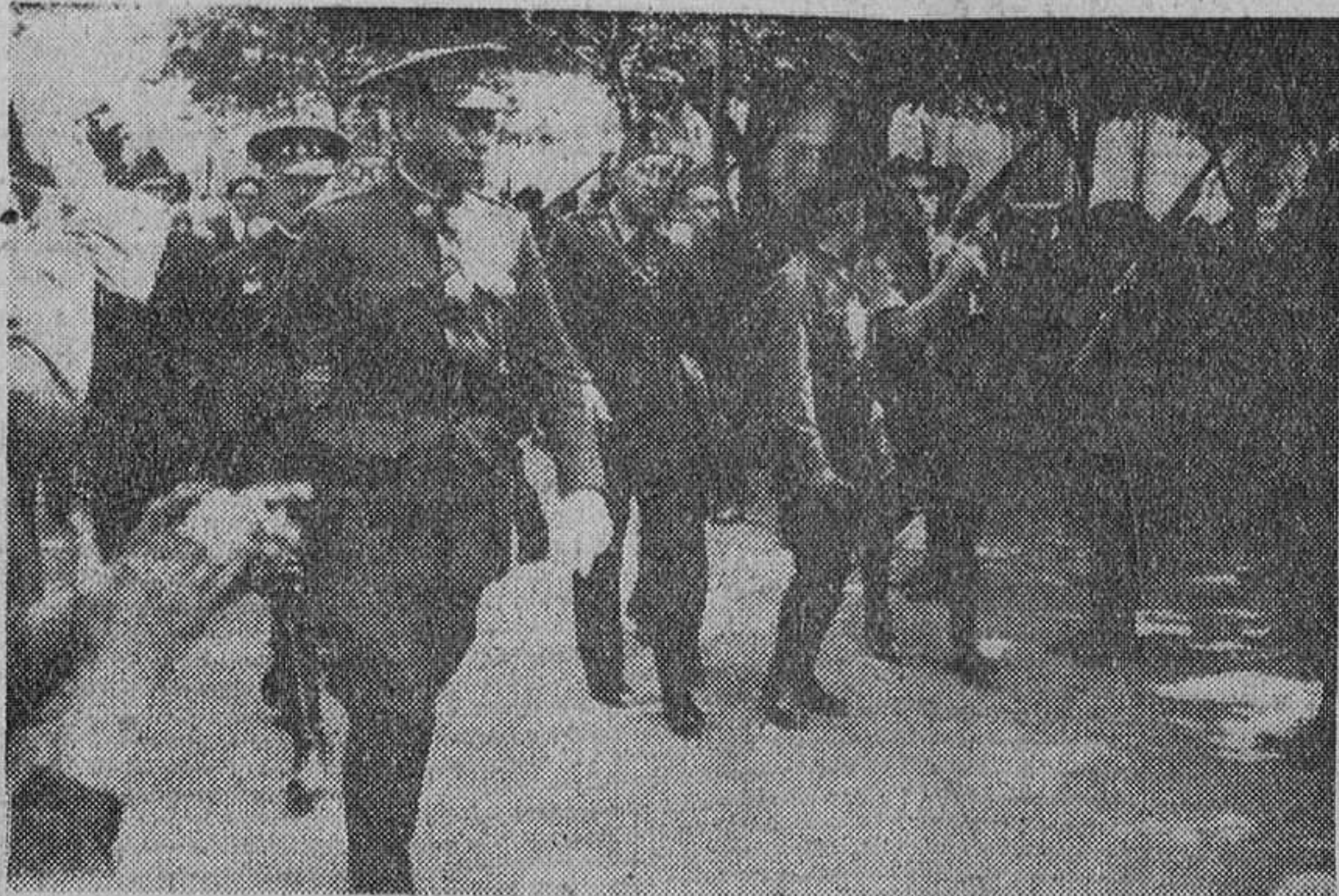
El general Mola, jefe del Ejército del Norte, revista en Pamplona una formación de requetés, poco después de iniciarse la Cruzada.

De cómo cumplió dan fe la escandalosa campaña desencadenada contra él por la revolución que se