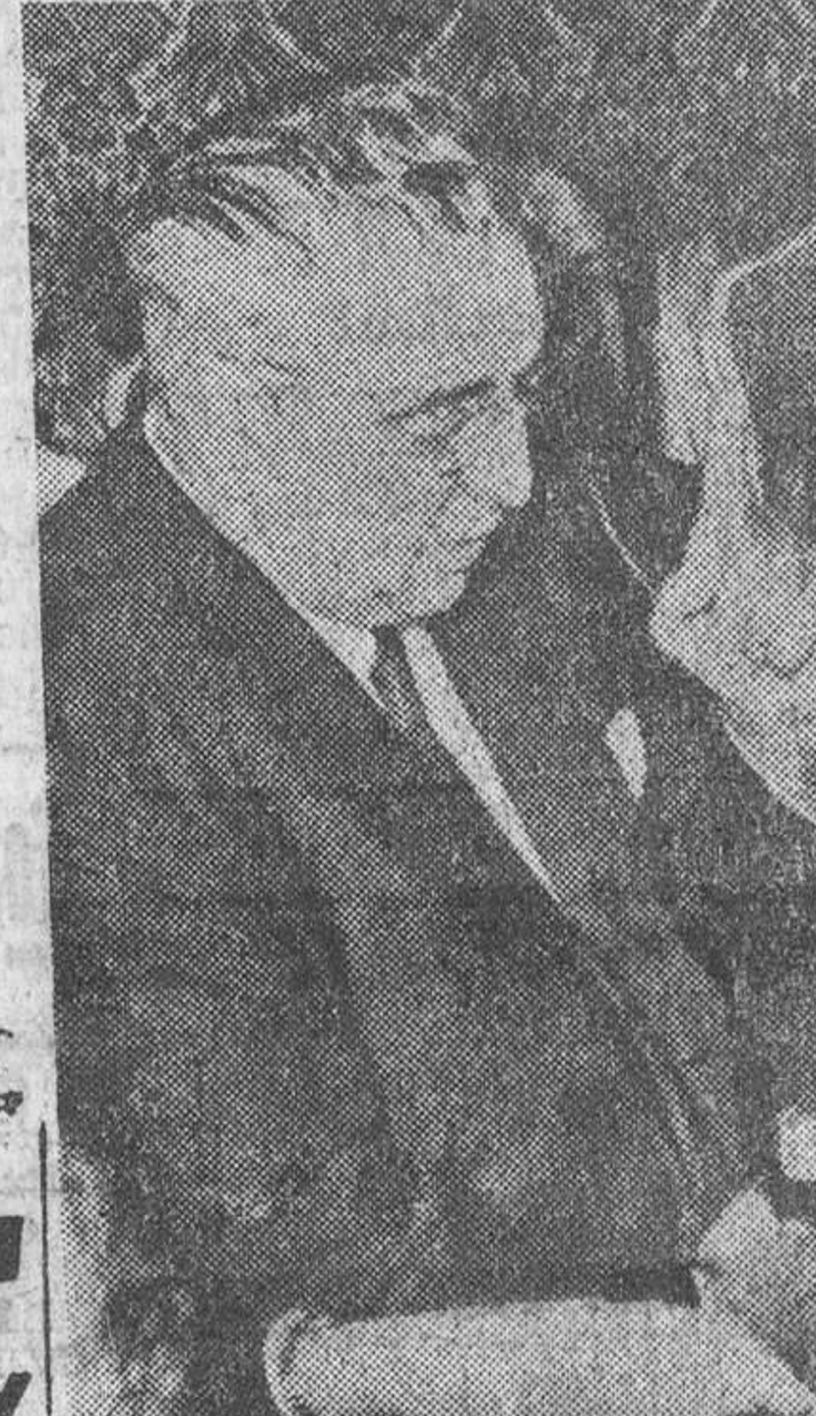
El exministro de Asuntos Exteriores, don Alberto Martín Artajo, durante su brillante conferencia de anoche.