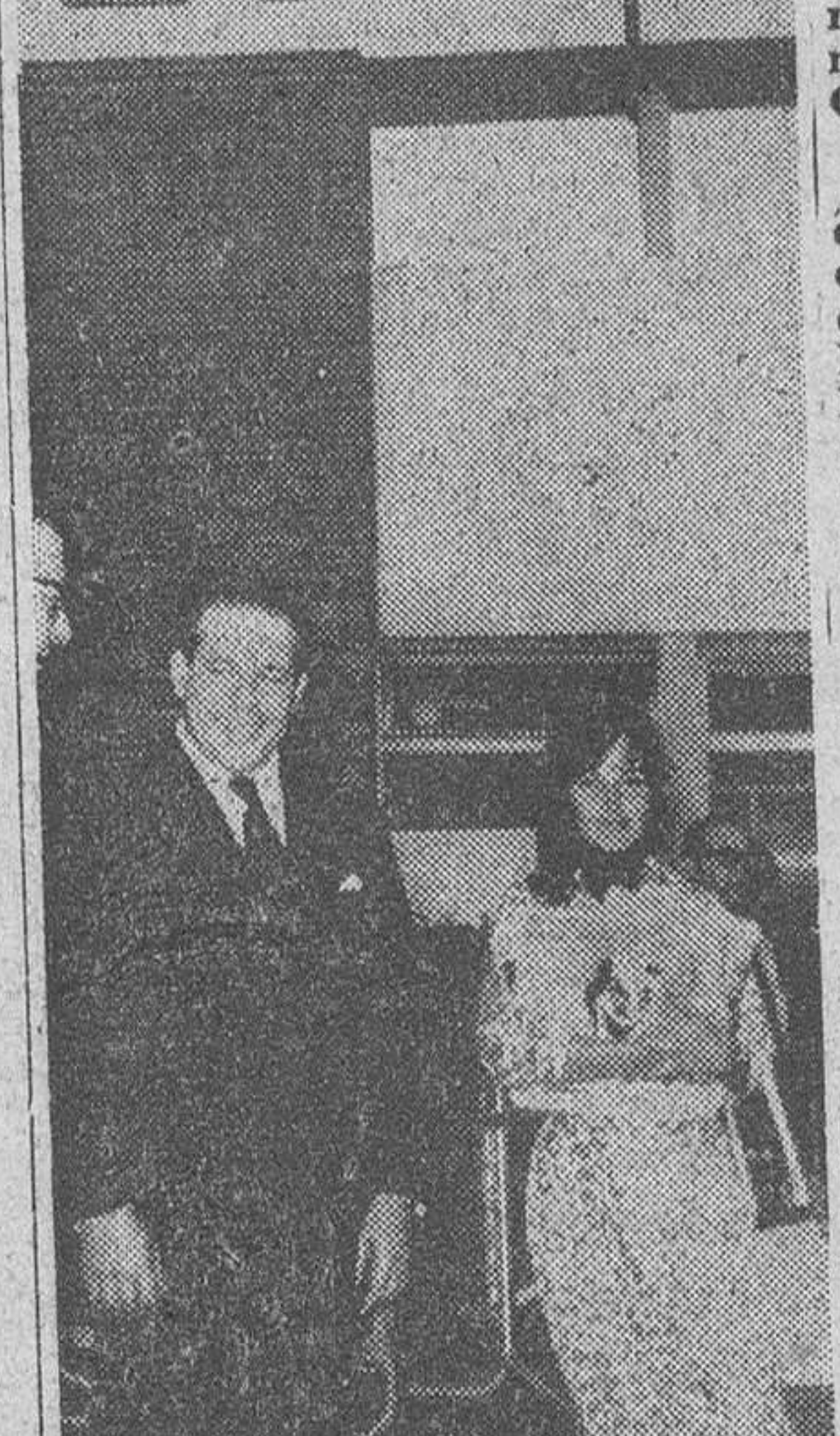
Barcelona. — El vicepresidente del Brasil, Joao Goulart, acompañado de su esposa, a su llegada a Barcelona, para pasar la noche con sus hijos de verano en Lloret de Mar.

te la demanda de los ministros de las fuerzas armadas; ha anunciado que se encuentra unánimemente en favor de Goulart y ha retardado prácticamente a los jefes militares a que cierran el Congreso por la fuerza. Mientras tanto, la red de emisoras