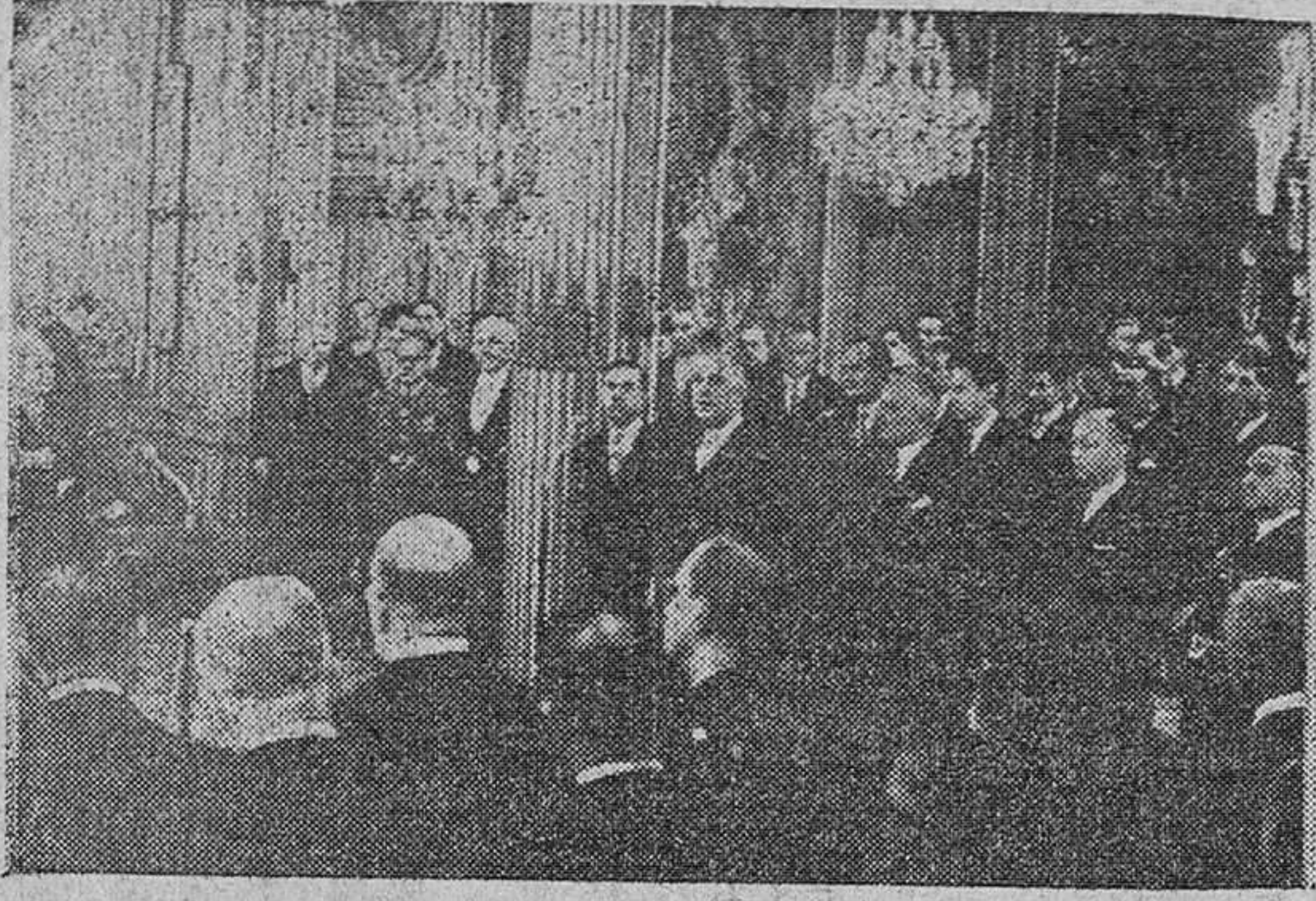
El Gobierno francés felicita a De Gaulle al comenzar el año

París.—En el Palacio del Eliseo, han tenido lugar una serie de recepciones en las que el general De Gaulle fue cumplimentado por el Gobierno, Cuerpo Diplomático y autoridades civiles y militares, con motivo del Año Nuevo. En la fotografía, el presidente de la República responde al señor Parodi (a la izquierda) que lo felicita en nombre del Gobierno