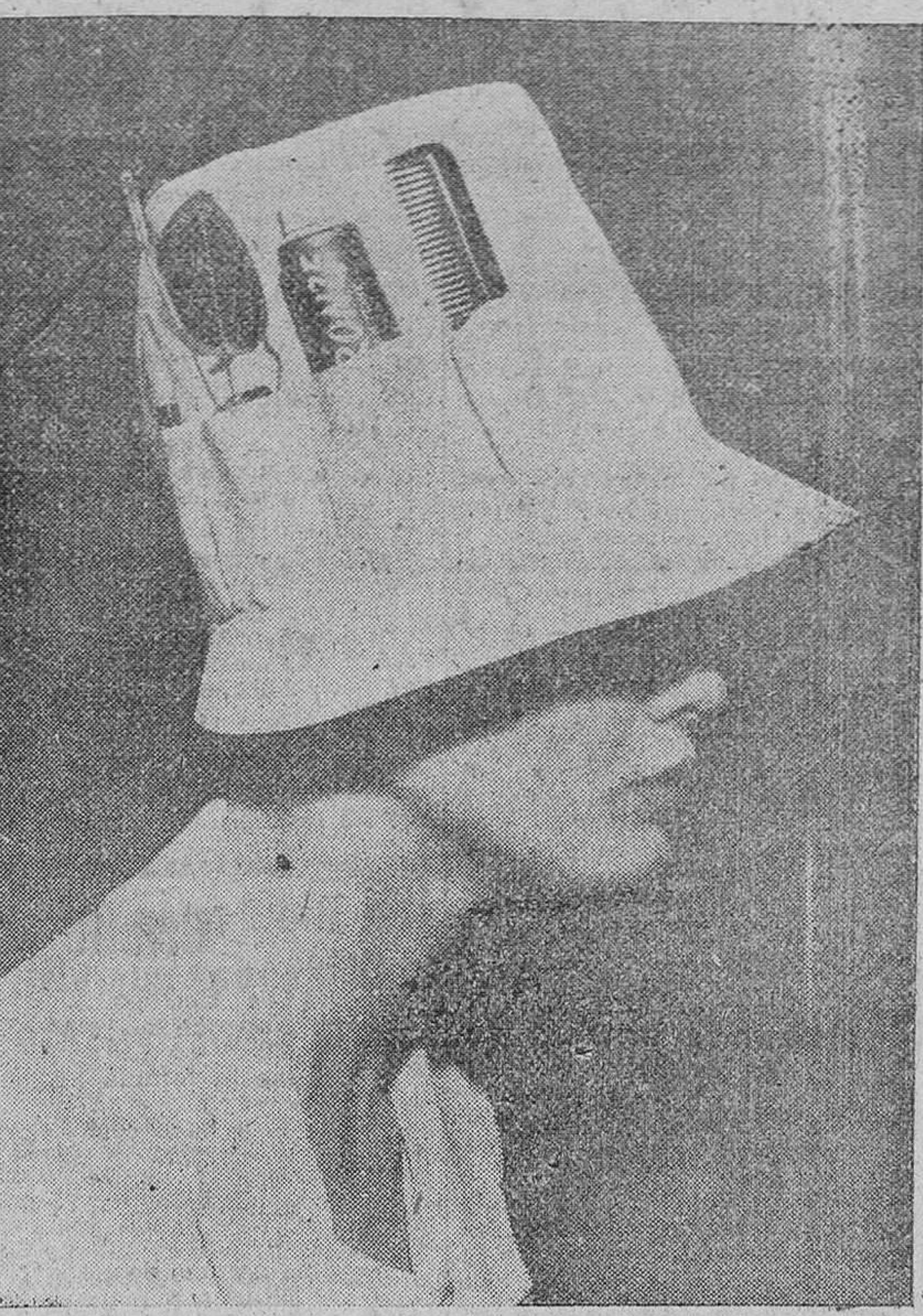
LONDRES. — Dentro de la colección de nuevos modelos de sombreros para campo y playa, en la próxima temporada veraniega, un sombrero inglés ha presentado este gorrito que evita los engorros de las bolsas de mano. El peine, el bofrato, las gafas y hasta la crema contra las quemaduras del sol podrán llevarse en adelante en la cabeza.