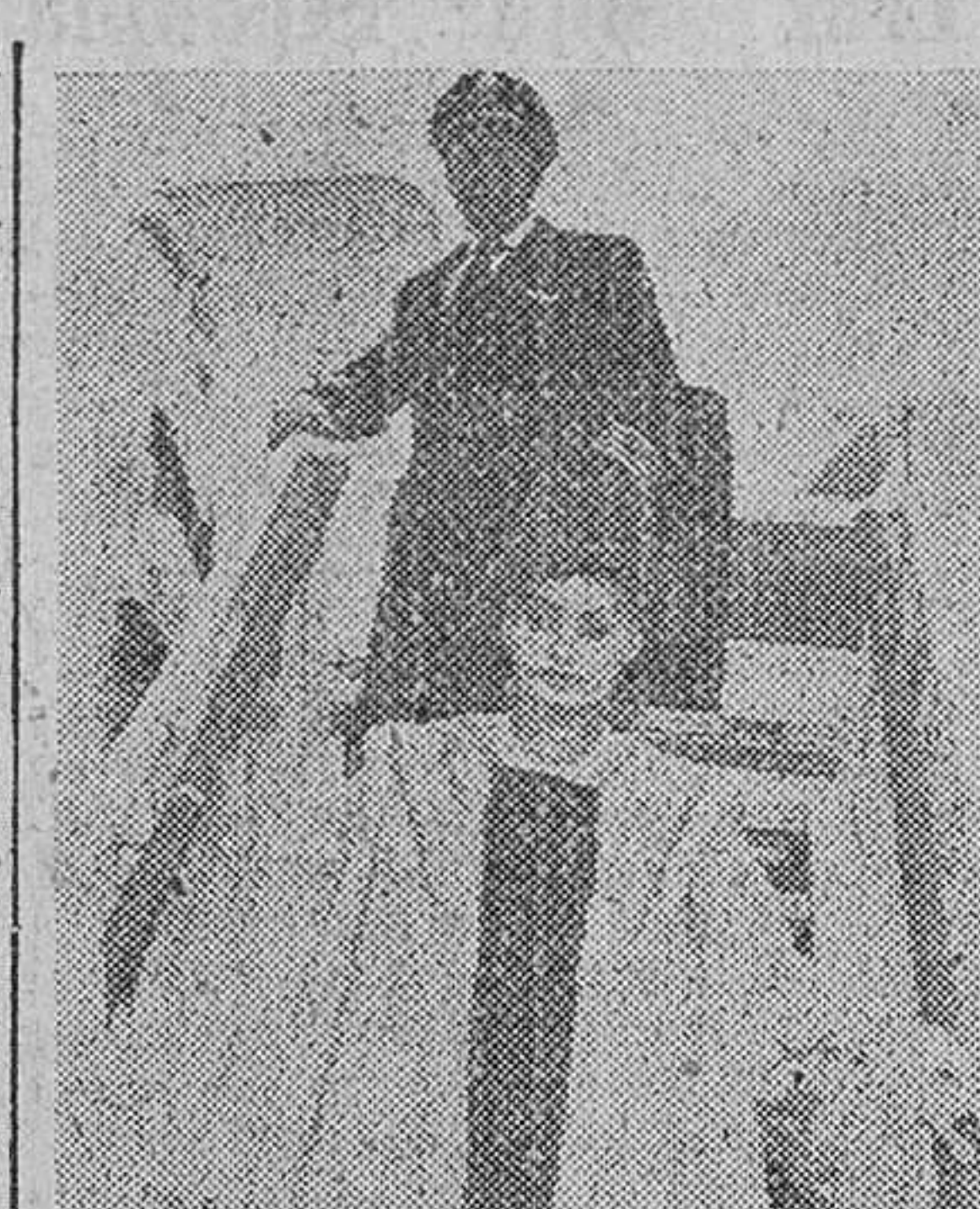
Sofía Loren, la Doña Jimena de "El Cid", a su regreso a España para proseguir el rodaje de aquella película, tras sus breves vacaciones navideñas, transcurridas en Milán. En la foto, aparece descendiendo del avión a su llegada a Barajas.

MADRID. — (Servicio especial de A.R.G.S. Prohibida la reproducción). — El secreto más recóndito de la femineidad es la necesidad que experimenta toda mujer de ser dominada. Ella, por naturaleza, es sentimentalmente como un niño que solo se siente seguro cuando se sabe amparado por una persona superior que le guía y lo protege. Este infantilismo de la mujer no es cuestión de edad. Dura hasta la muerte.