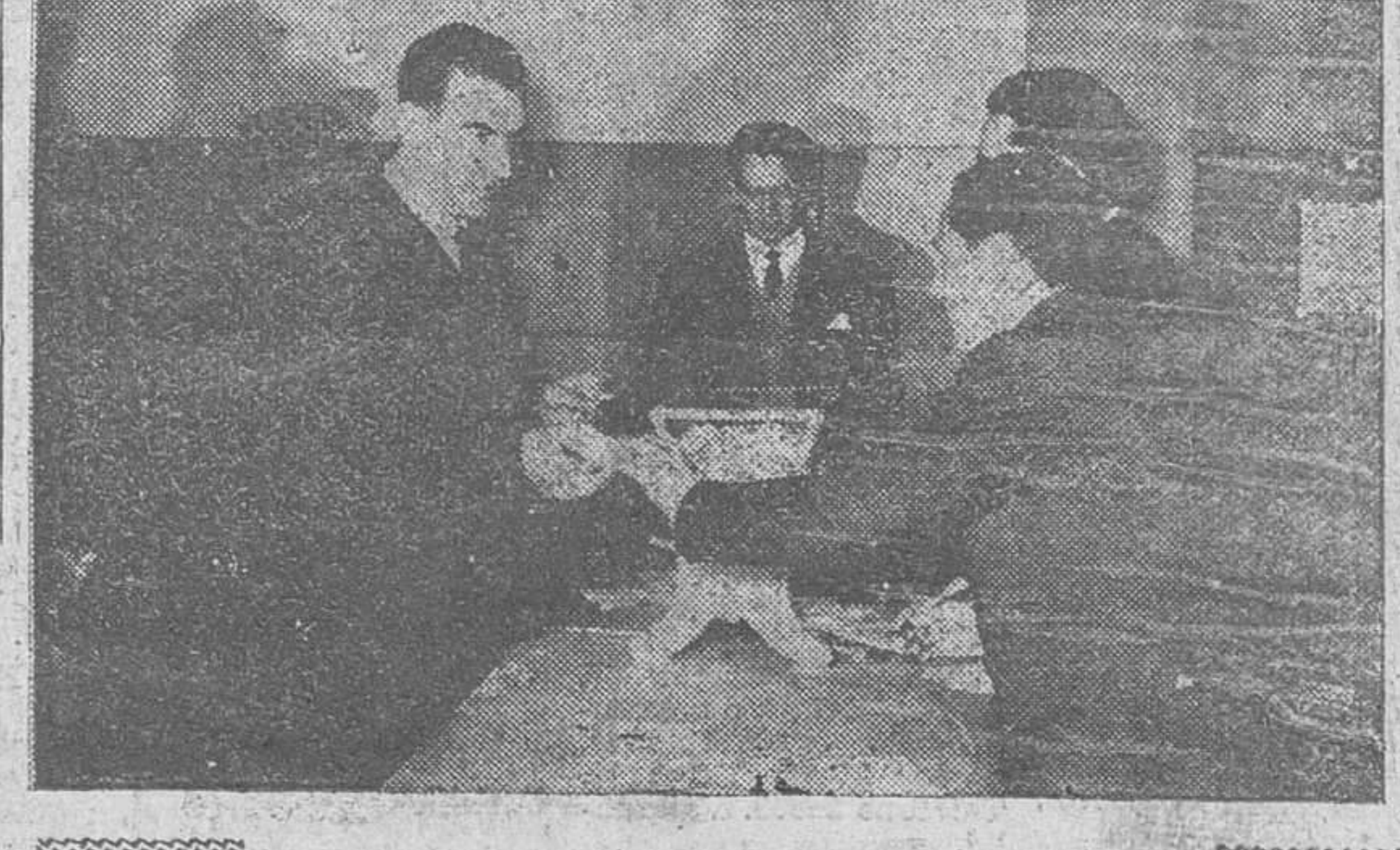
«Fede» captó a las tres primeras autoridades civiles de la ciudad cuando acudieron a depositar su voto el domingo último.