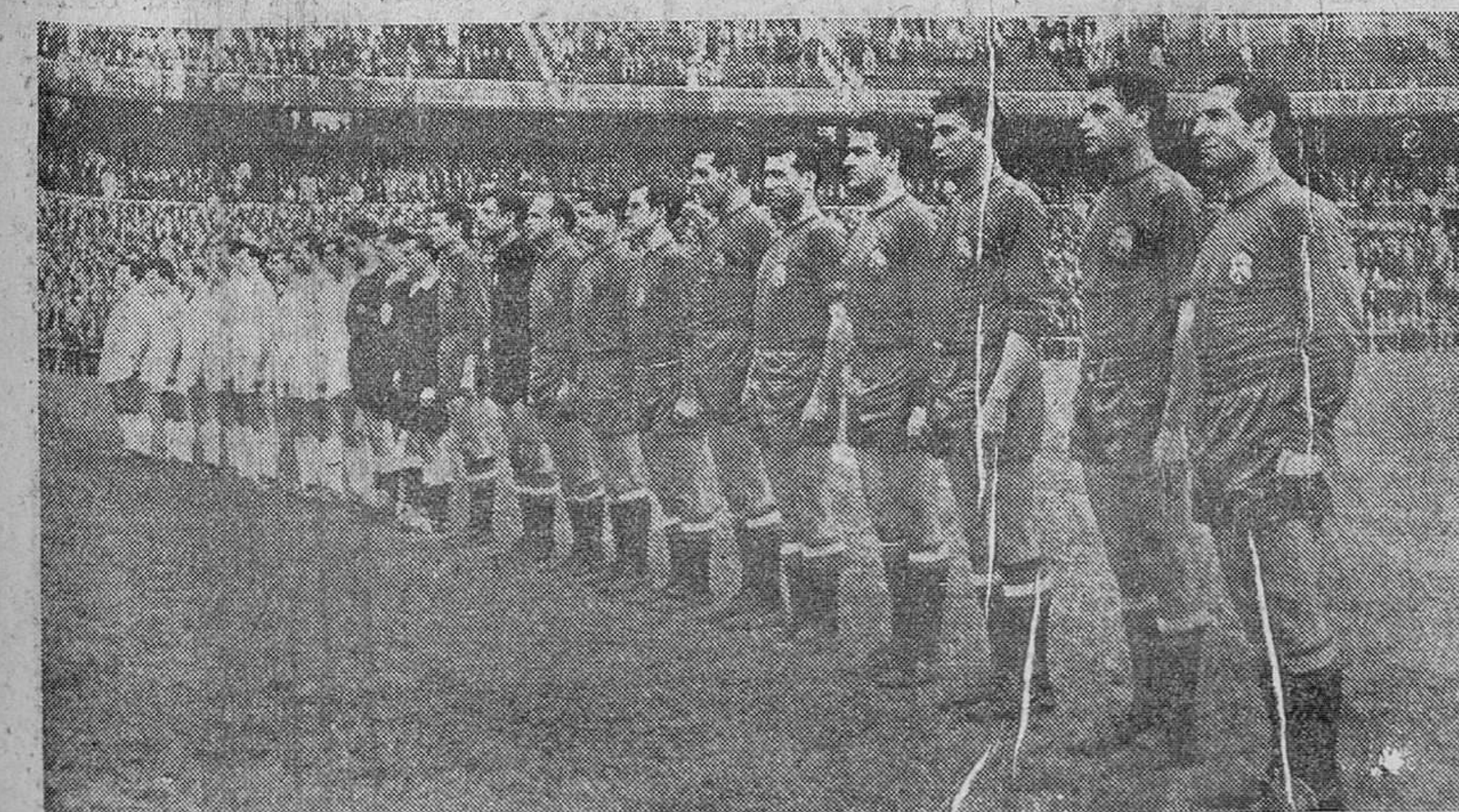
La selección nacional de fútbol venció a la inglesa. Los dos conjuntos alineados frente a la tribuna durante la interpretación de los himnos nacionales de Inglaterra y España. En primer término, el equipo de España.