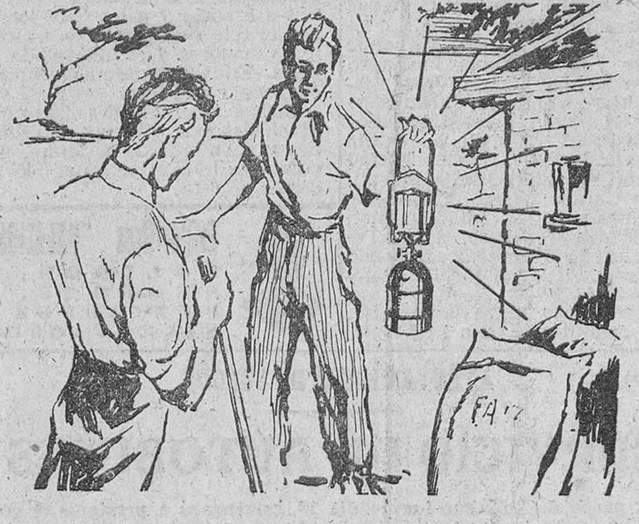
En el campo, el día no termina con el sol.