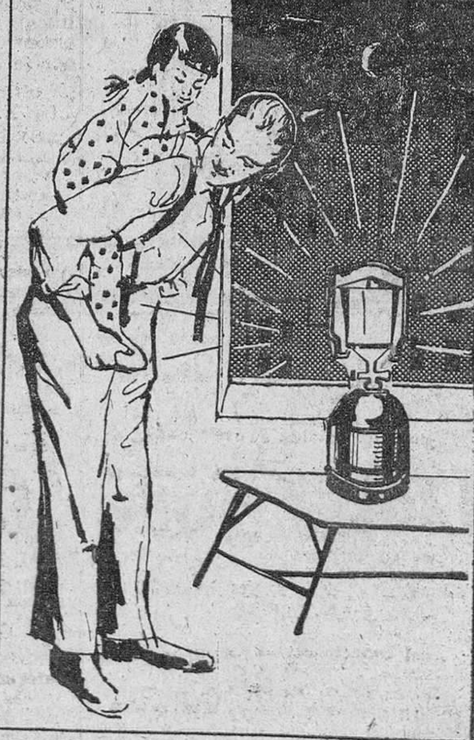
En el hogar, una lámpara auxiliar dispuesta a remediar apagones.