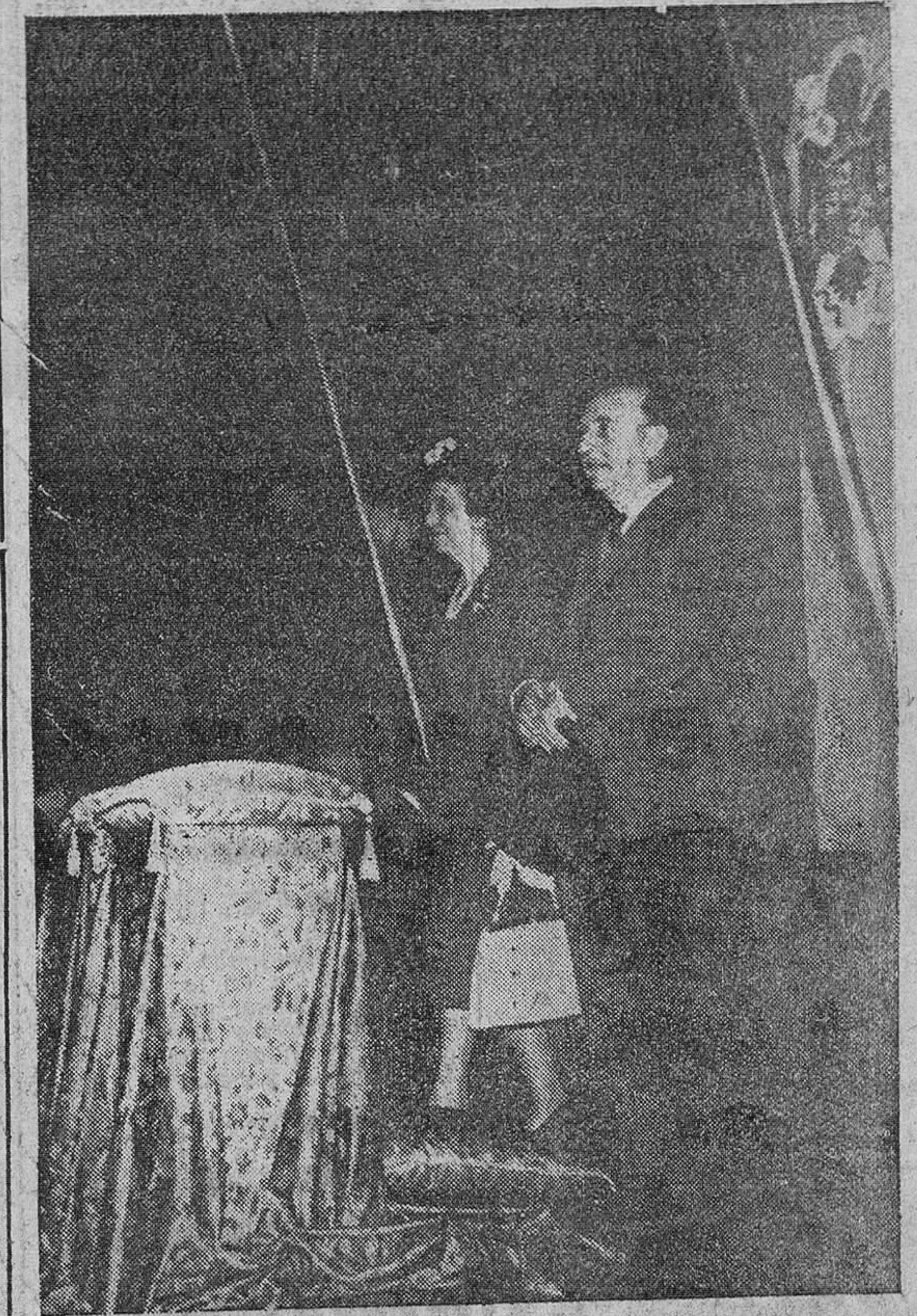
Monasterio de Nuestra Señora de Montserrat.—Su Excelencia el Jefe del Estado y su esposa, en el presbiterio, durante la interpretación de la Salve de Vitoria, durante su visita al Monasterio.

También estuvo S. E. en el Instituto Químico de Sarriá, fundado y regido por la Compañía de Jesús