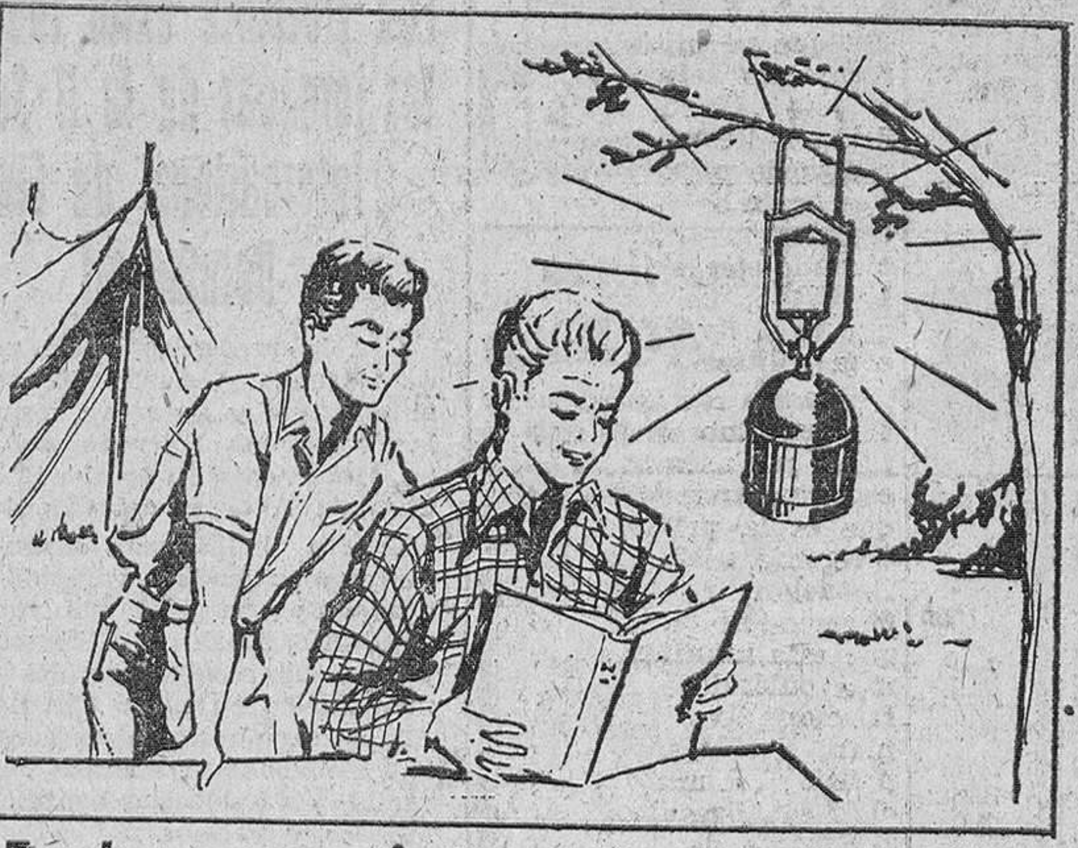
En las excursiones, el complemento que las hará más agradables.

Siempre está asegurado el suministro de gas butano y el recambio en toda España.