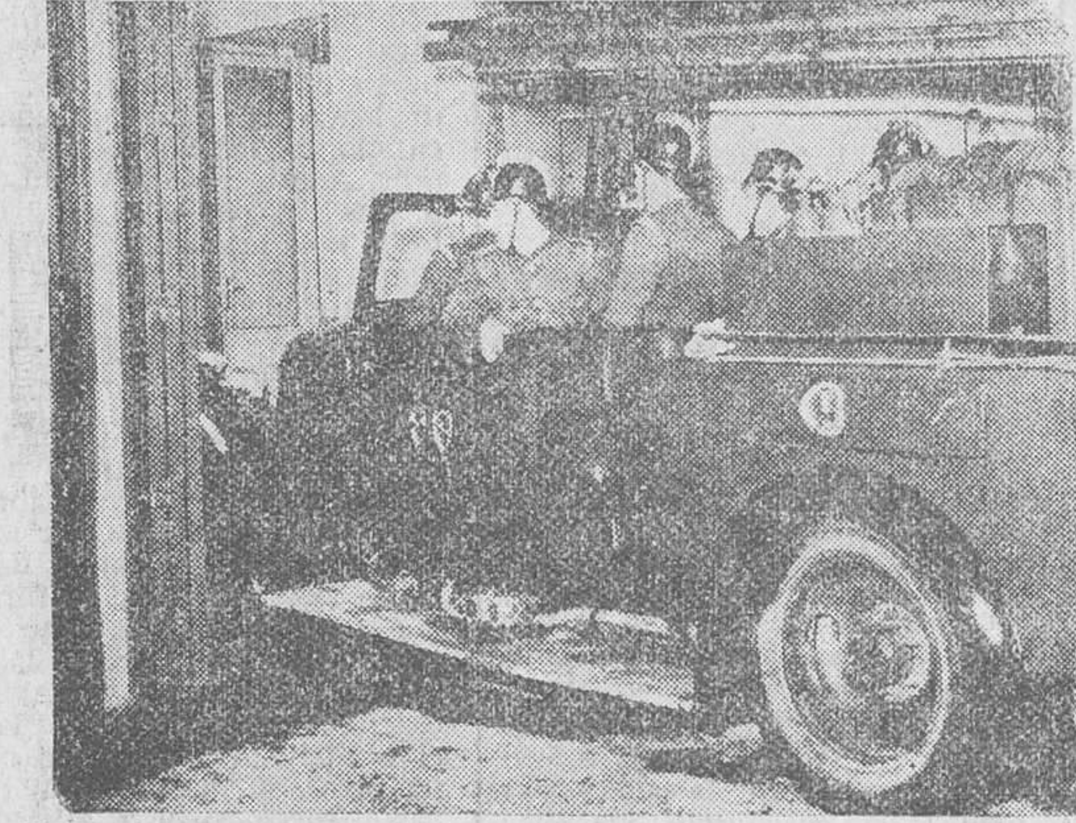
Cena interrumpida... Ha sonado la alarma y los «chombres sin Nochebuena» se aprestan a prestar su auxilio y quizás hasta su vida

UESTROS TELEFONOS Redacción 1280 Administración 2015