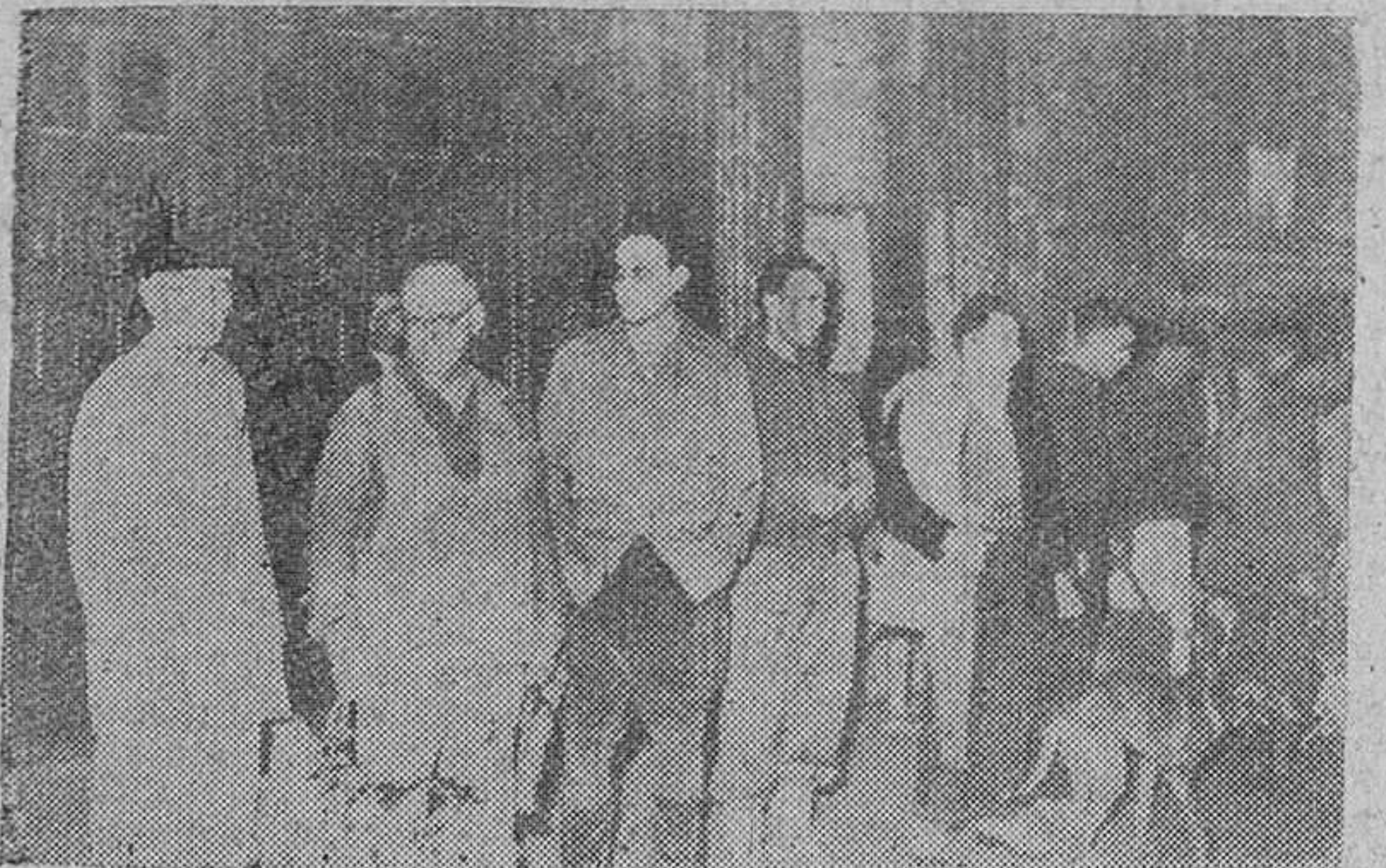
La fiesta de la Asunción de Nuestra Señora tuvo ayer, como todos los años, un acusado carácter campestre, por la multitud de excursionistas que se desplazaron de la capital. En nuestras "fotos" un grupo familiar de tantos como los que se formaron en los alrededores de la ciudad. Y, al pie, varios cazadores sorprendidos por "Fede" momentos antes de salir al campo, en la jornada inaugural de la temporada de caza.