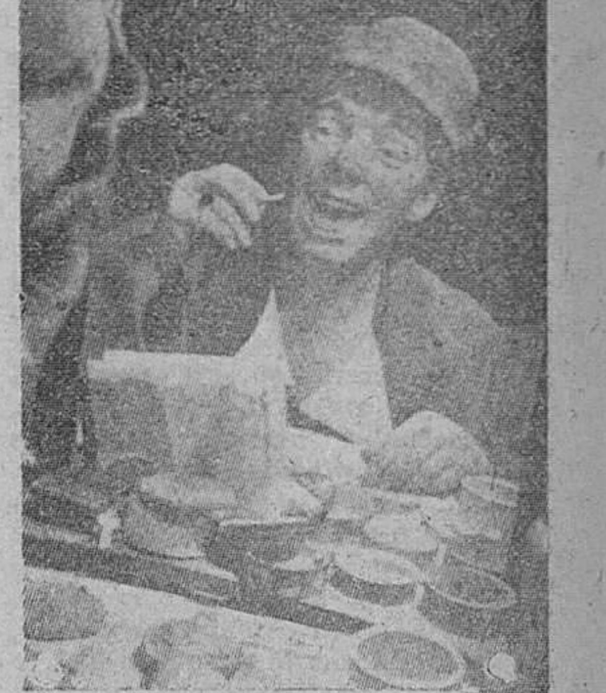
«EL PAYASO NOK» PREPARÁNDOSE EN SU «CAMERINO»

Ese mundo maravilloso de color y de luz de ilusión y de fantasía, recala una vez más en su ruta constante, para traernos toda la magnificencia de un espectáculo totalmente nuevo, que nos hará vivir unas horas inolvidables. Viene el CIRCO HUNGRIA DE BUDAPEST, con artistas que han traspasado el telón de acero para actuar en la Europa Occidental, con las más cotizadas atracciones mundiales. Llega a nuestra ciudad con su gran cortejo múltiple, que nos transporte al País de los Sueños. El esfuerzo, la emoción y lo imposible, se unen en este Circo, que ha sabido conquistar la admiración mundial. «Bienvenido sea el Circo Hungria de Budapest a la siempre acogedora ciudad de BURGOS!»