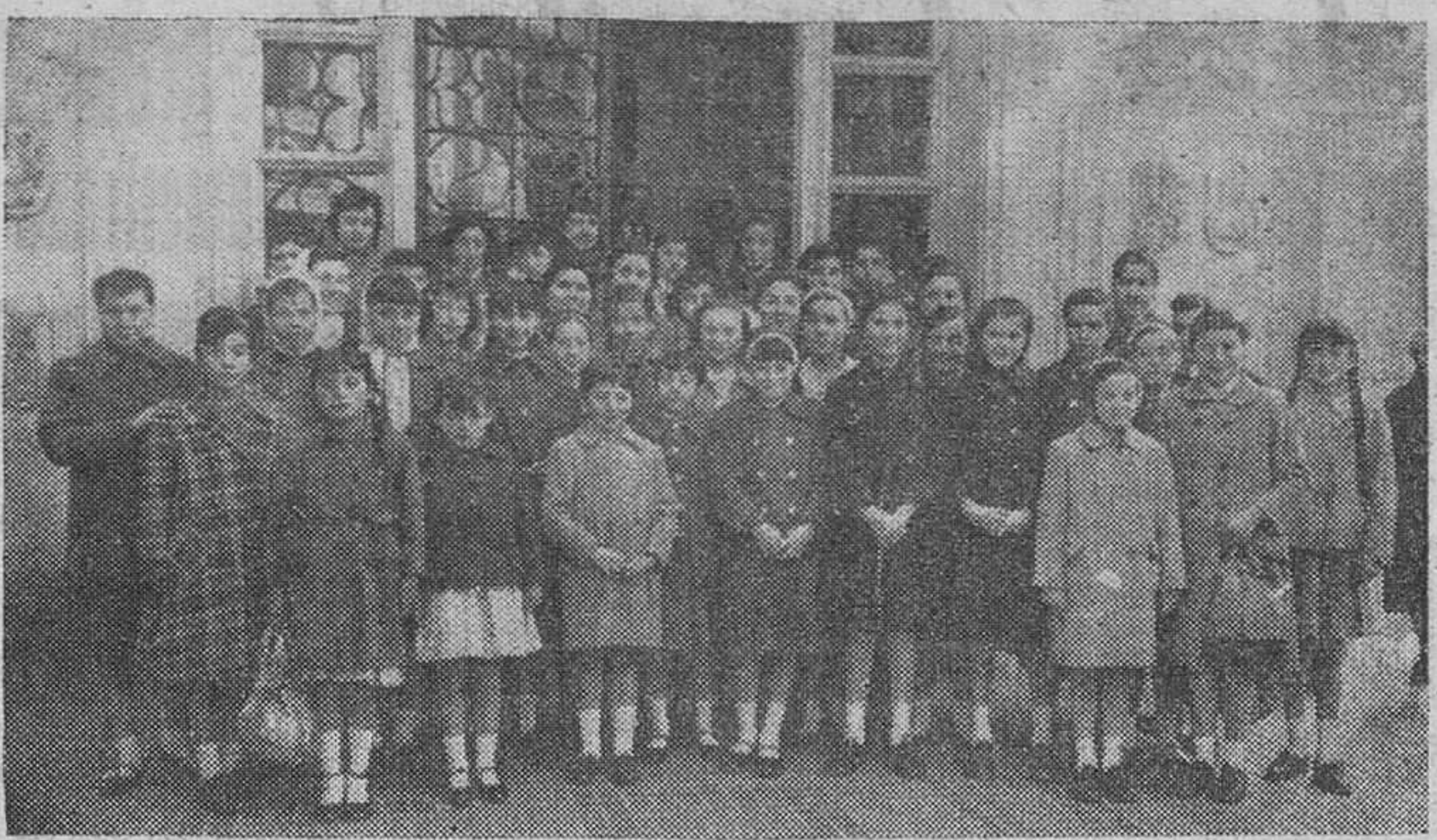
GRUPO DE NIÑAS QUE EL DOMINGO PASADO VISITÓ SANTANDER EN MAGNIFICA EXCURSION GRATUITA ORGANIZADA POR LA CAJA DE AHORROS MUNICIPAL PARA PREMIAR EL AHORRO ESCOLAR