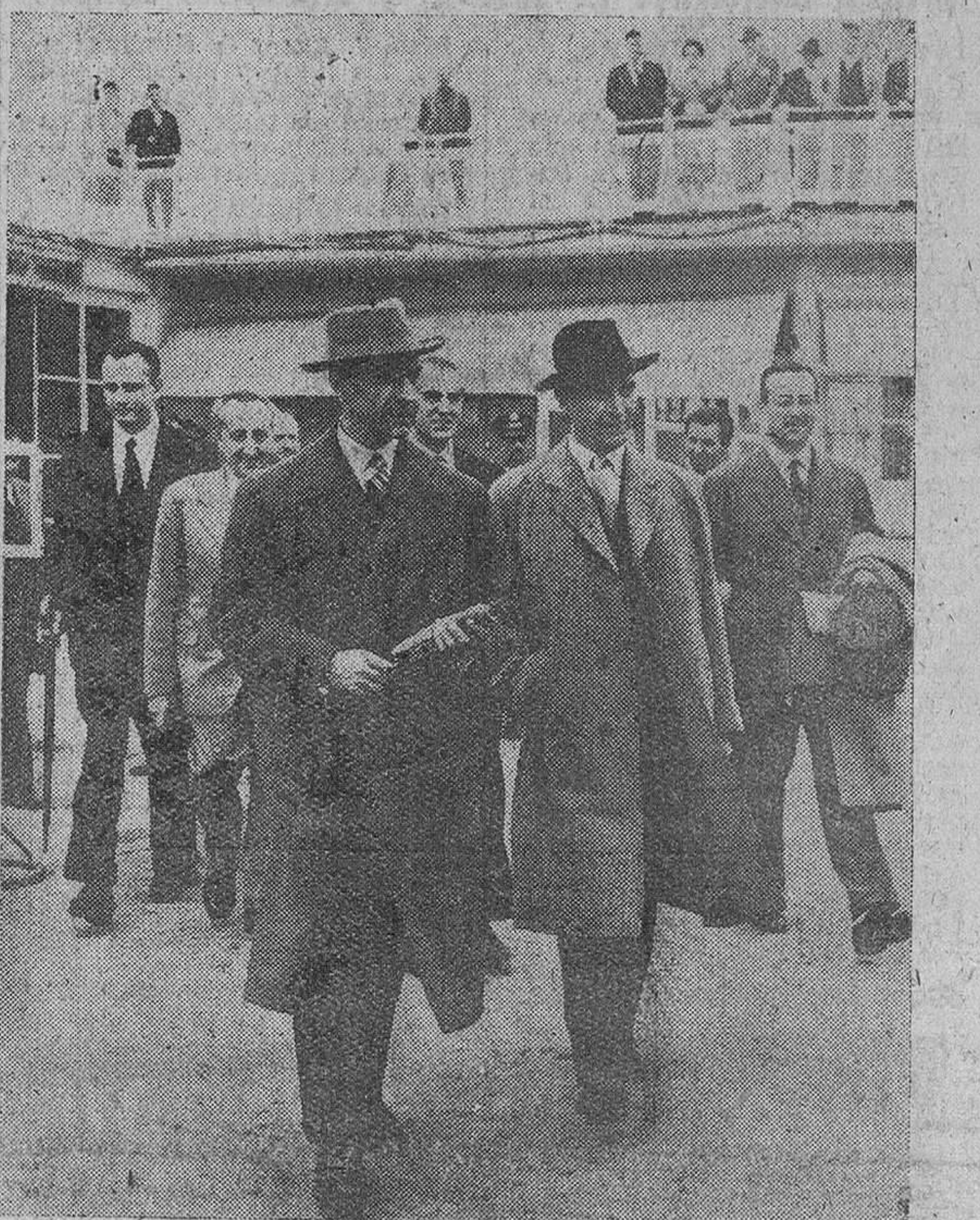
El ministro de Comercio, señor Ullastres, fotografiado en el aeropuerto de Barajas, antes de emprender su viaje a Londres, en visita oficial invitado por su colega británico Sir David Eccles.

Acuerdo con Francia y Portugal sobre paso de fronteras sin necesidad de visado