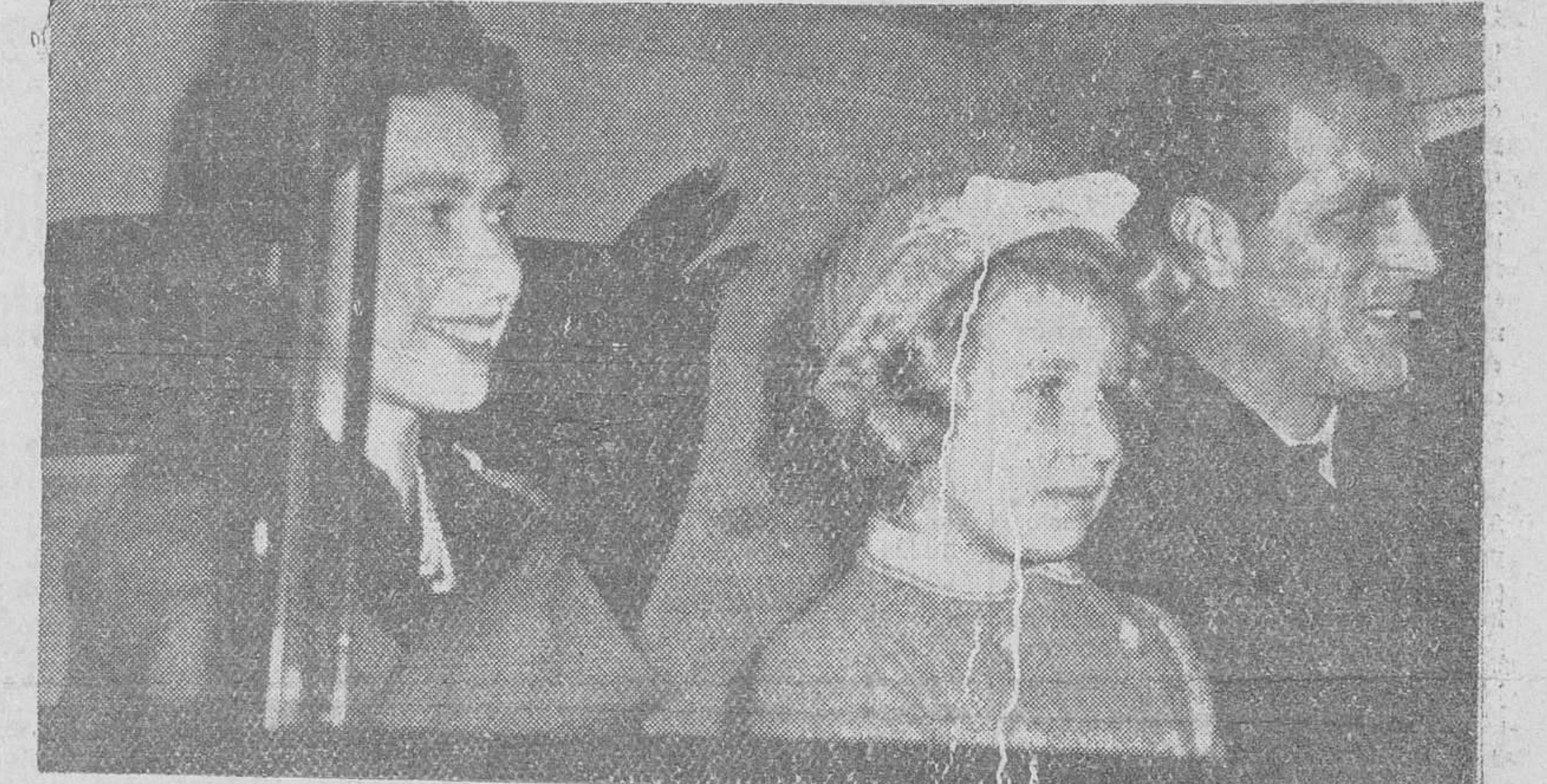
La Reina Isabel II y el Príncipe Felipe, dirigiéndose al Palacio de Buckingham, a su regreso del viaje realizado a los Estados Unidos. Les acompaña en el coche la Princesa Anna, que los recibió, en unión de la Reina Madre. La Princesa Margarita no pudo estar presente en el aeropuerto, a causa de un compromiso oficial y el Príncipe Carlos tampoco asistió, por estar en la escuela.