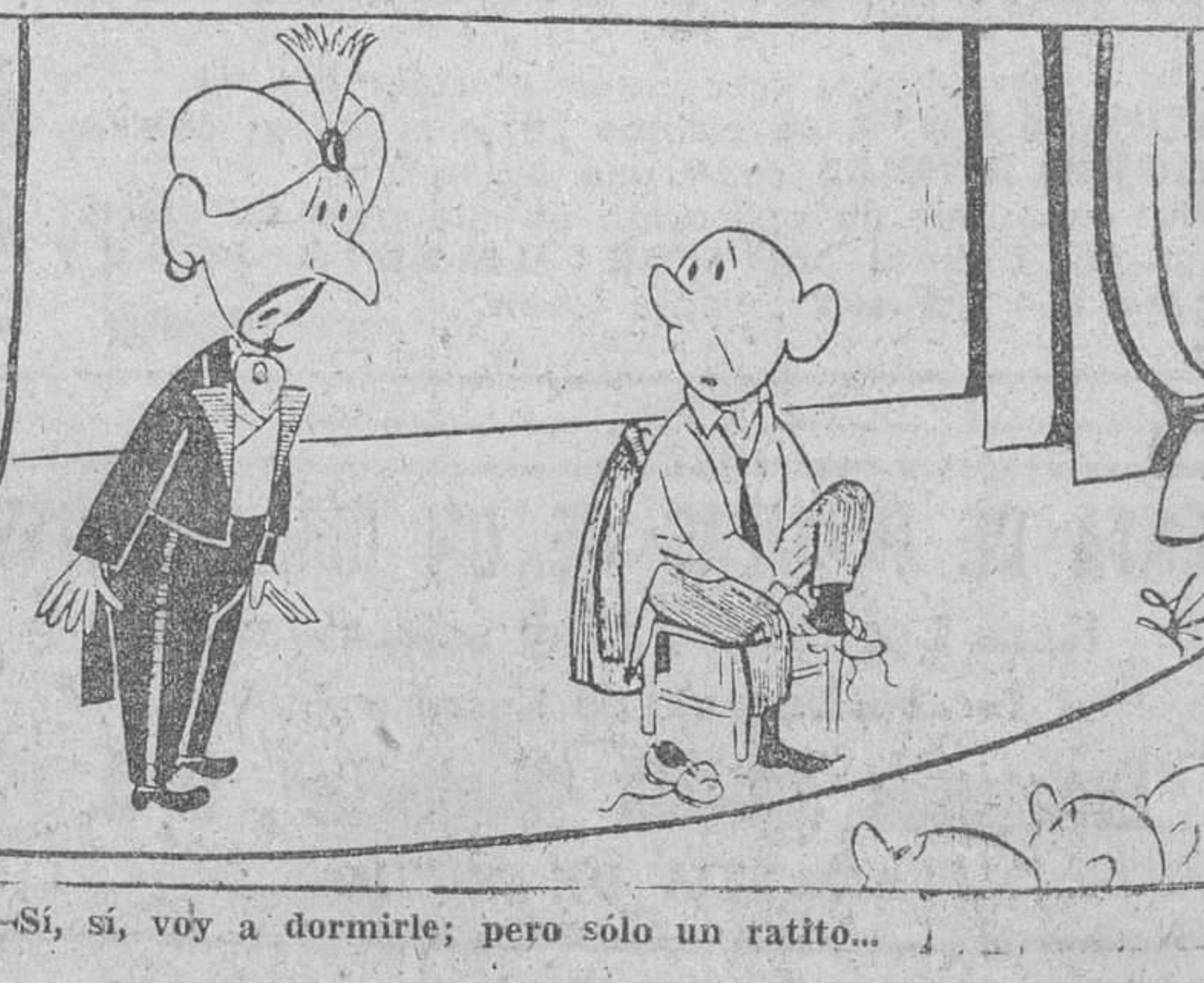
—Si, sí, voy a dormirle; pero sólo un ratito...