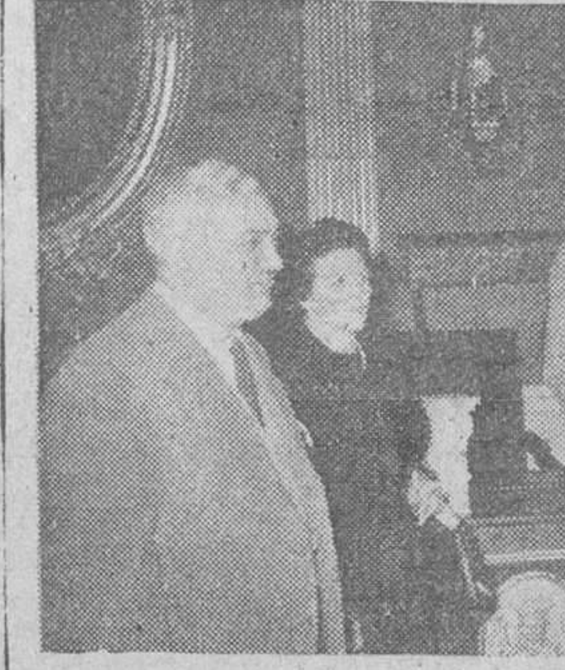
Ayer fue ofrecida en el Ayuntamiento, una recepción a varios delegados norteamericanos de Agencias de Viaje que recorren España y que visitaron nuestra ciudad.

Madrid. — (Crónica de "Tachin", en clusiva para DIARIO DE BURGOS).