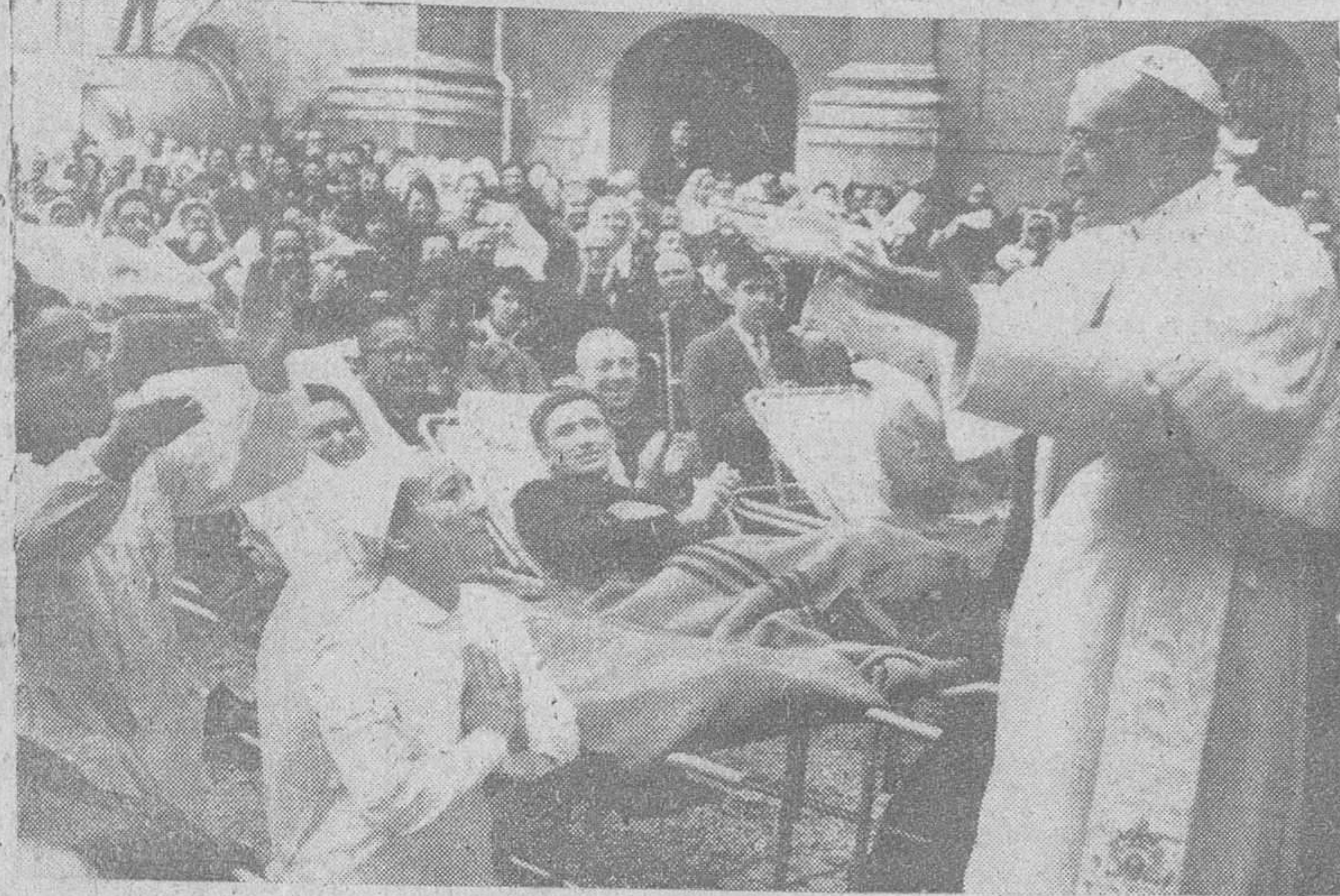
Ciudad del Vaticano. — El Santo Padre impartiendo su bendición a 5.000 enfermos reunidos en el patio de Belvedere, del Palacio Apostólico. — (Foto Clfra)