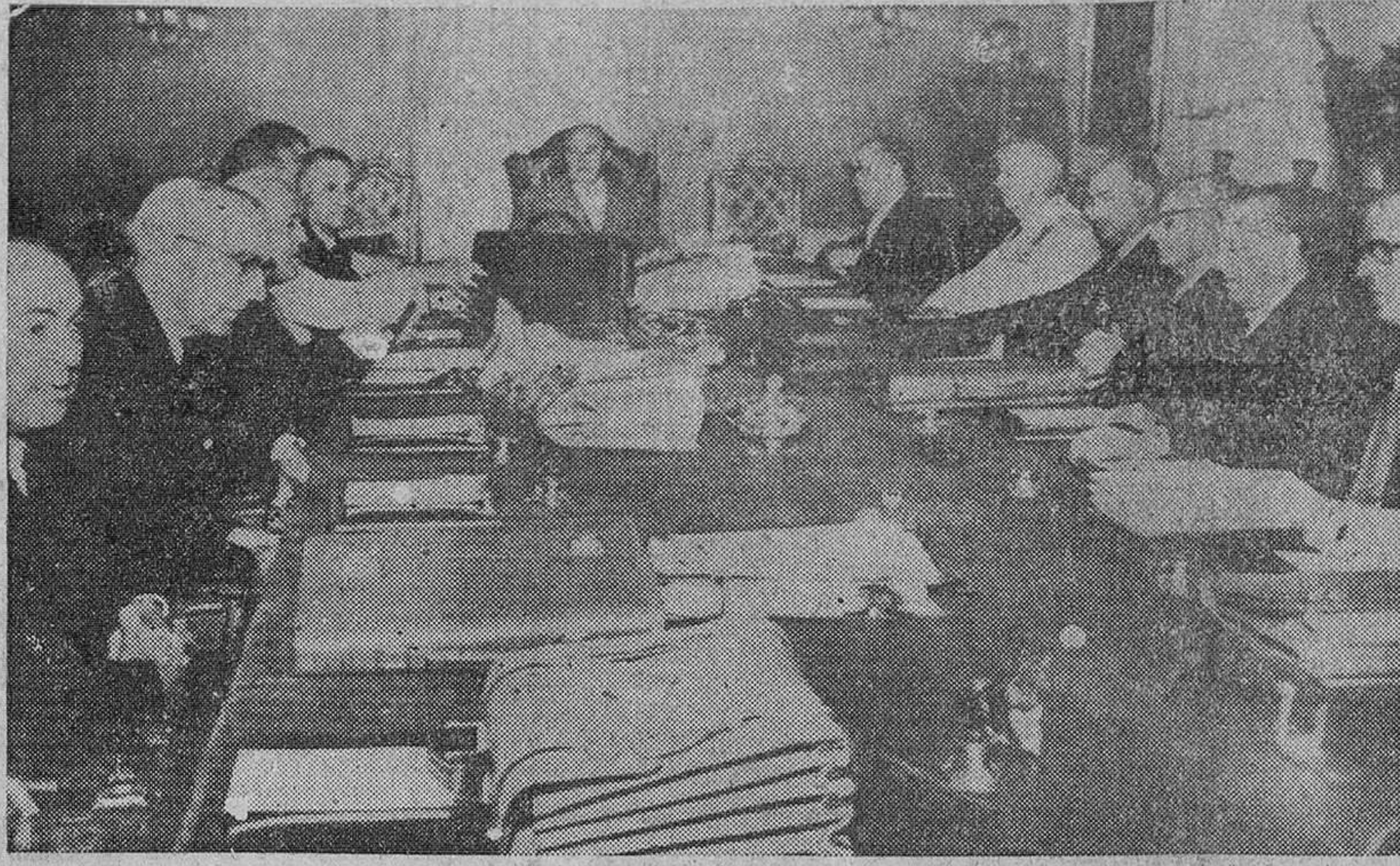
San Sebastián. — Su Excelencia el Jefe del Estado presidiendo el Consejo de ministros que comenzó en la mañana del viernes, en el Palacio de Ayete.