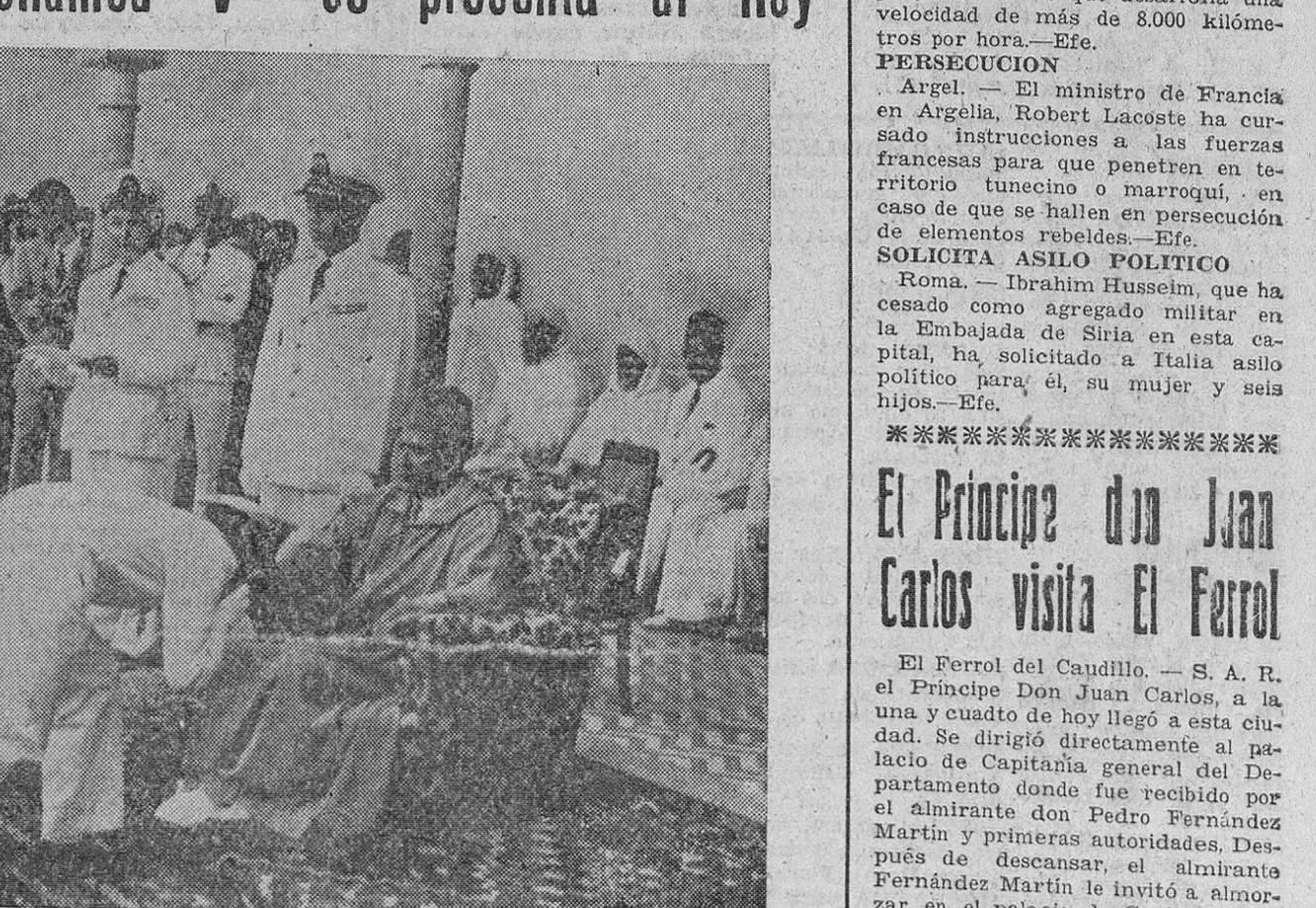
Rabat. — Rodeado por el Gobierno y los jefes militares, S. M. el Rey de Marruecos y su hijo el príncipe Muley Hassan, reciben el testimonio de adhesión y fidelidad de los 514 oficiales de las Escuelas Militares de Meknes, Saint Cyr y España y de los 240 suboficiales de la Escuela de Ahermoumou, que componen la promoción "Mohamed V".