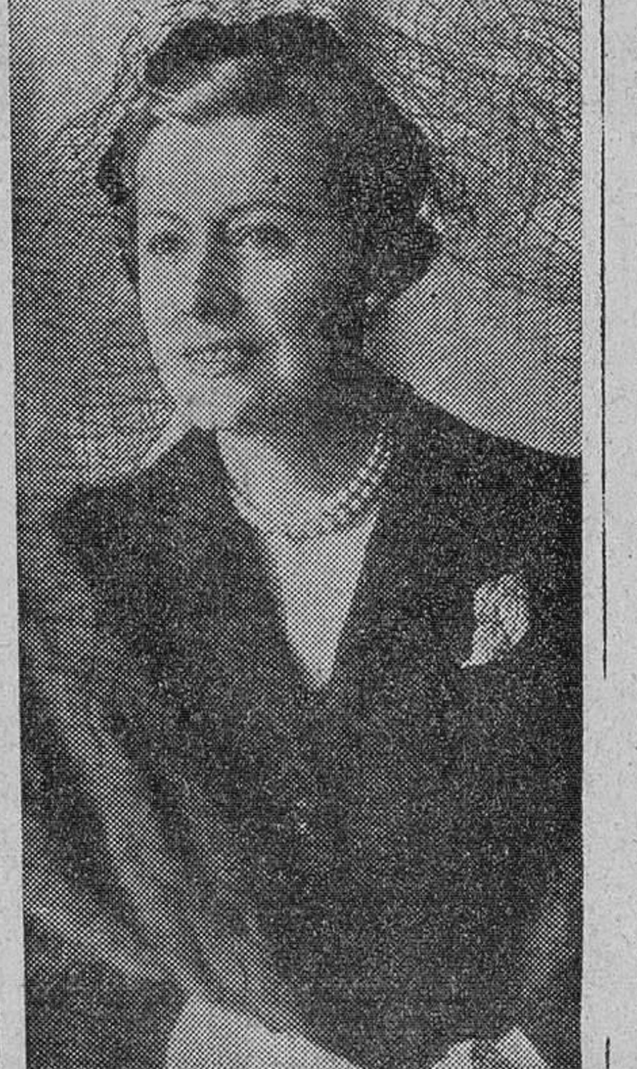
Irene Dunne, delegada de EE. UU. en la O. N. U.