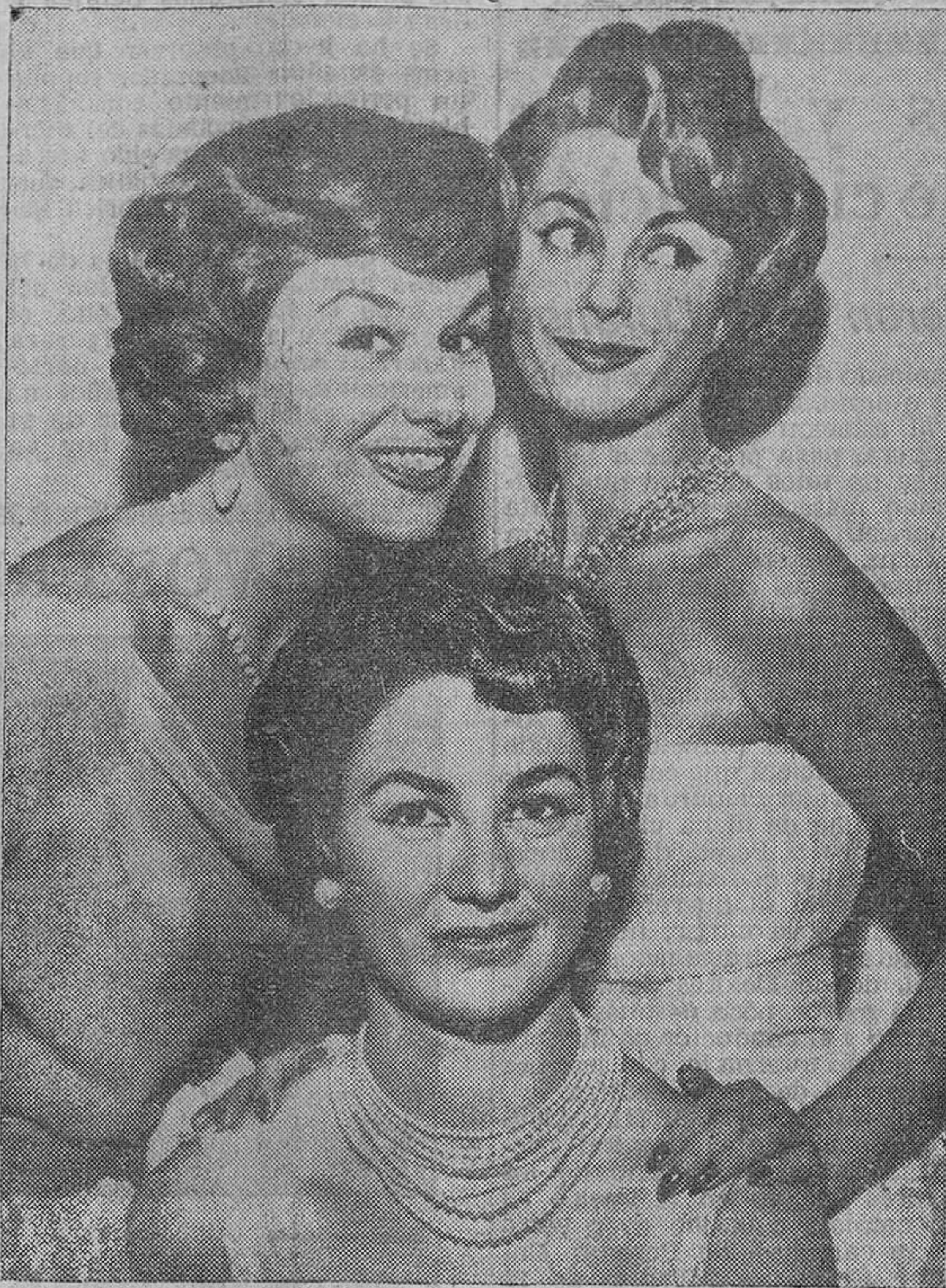
París.—La nueva línea de peinado creada por peluqueros parisinos a titulada «Linda amiga», es diferente a la de otros años, ya que se vuelve a la línea clásica, sin adornos ni tocados. En nuestra fotografía aparecen tres bellas maniqués francesas, que presentan de izquierda a derecha los peinados «Eblouissante» y «Spirituelle» y, debajo, el «Divine», todos dentro de la línea antes mencionada.