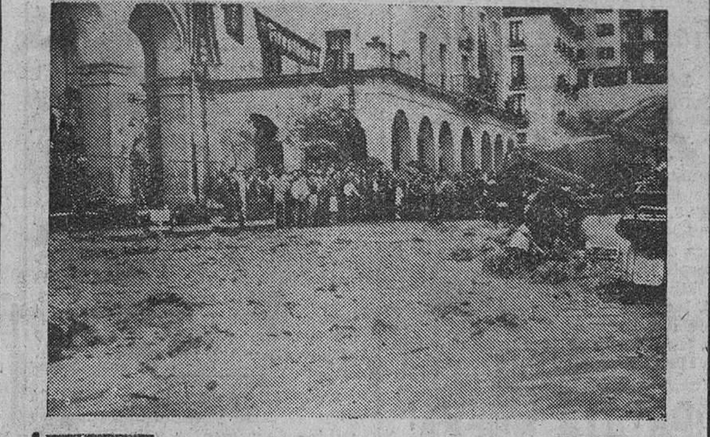
Eibar. — He aquí la caudalosa riada que se produjo en esta ciudad a causa de la lluvia torrencial caída durante tres cuartos de hora, el pasado sábado.