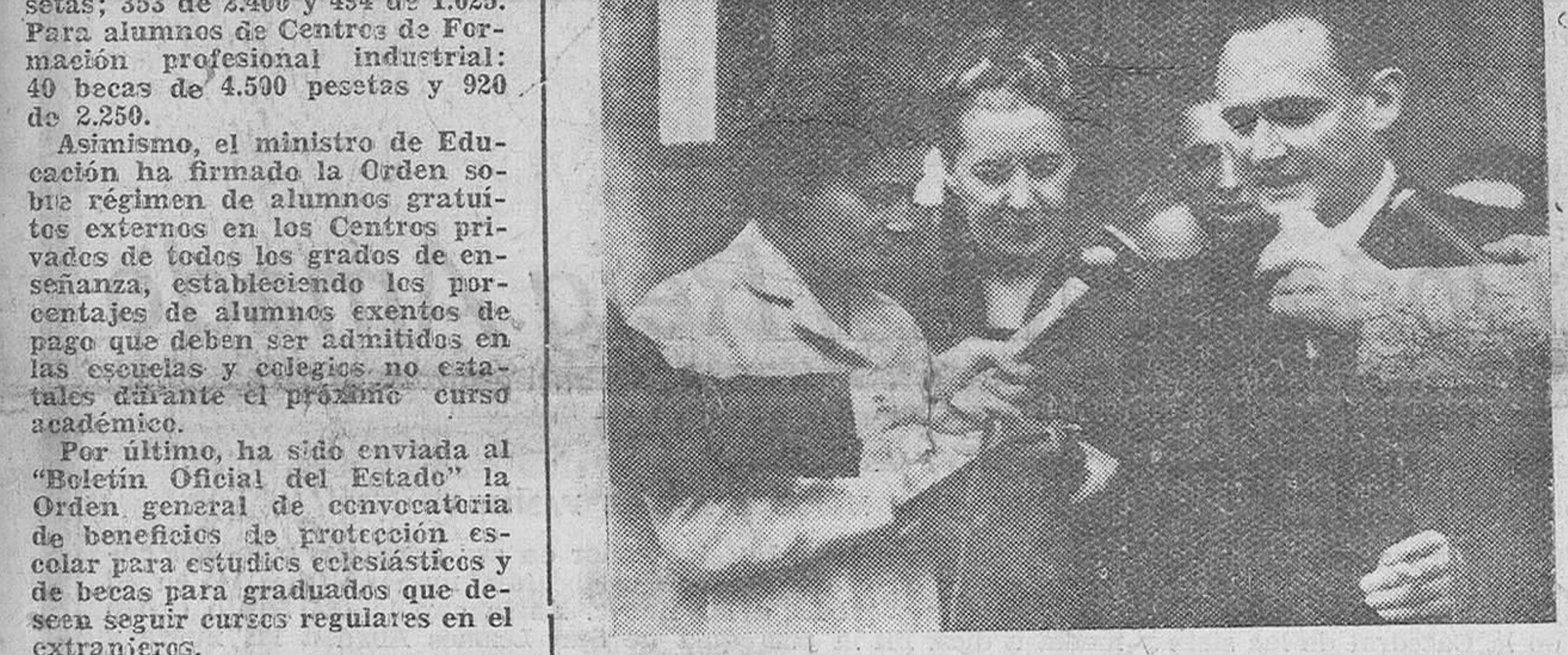
Paris. — Mr. Bourges-Maunoury, ministro de Defensa Nacional, que ha logrado formar Gobierno, es interrogado por los periodistas a la salida del Eliseo.

Ganó la votación por 242 votos contra 161