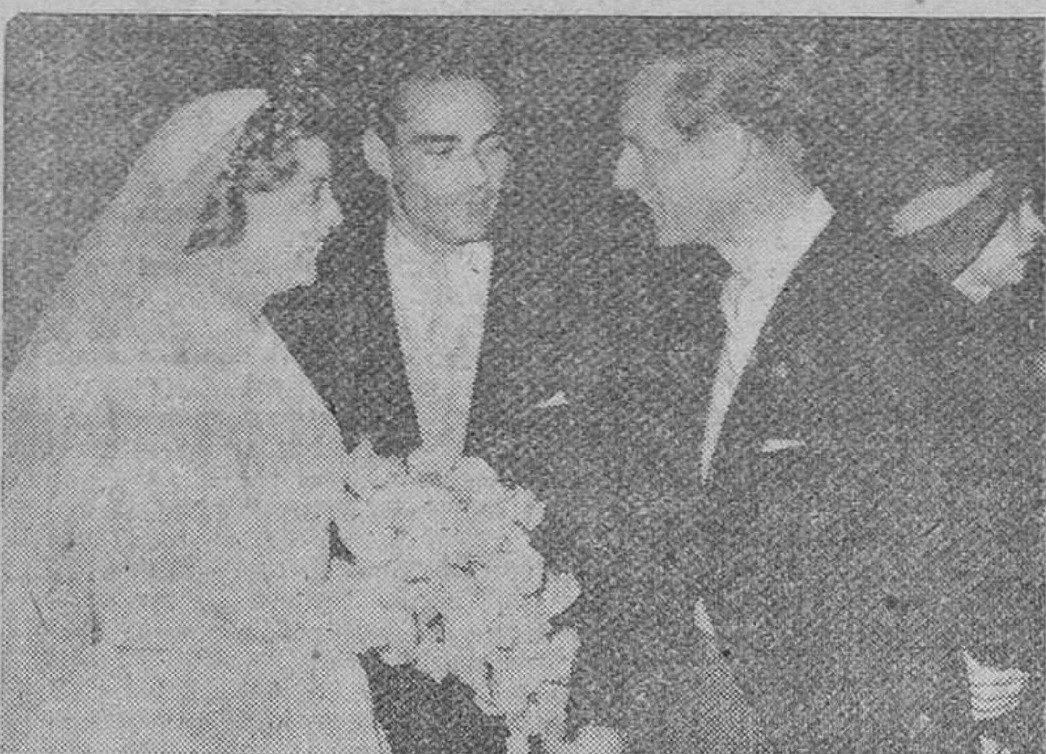
Castillo de Salen (Alemania). — El príncipe Felipe de Edimburgo, esposo de la Reina Isabel de Inglaterra, conversa con la princesa Margarita Von Baden y el príncipe Tomás de Yugoslavia (hermano del Rey Pedro), después de haber contraído éstos matrimonio en el castillo de Salen y a cuya ceremonia asistió como invitado.