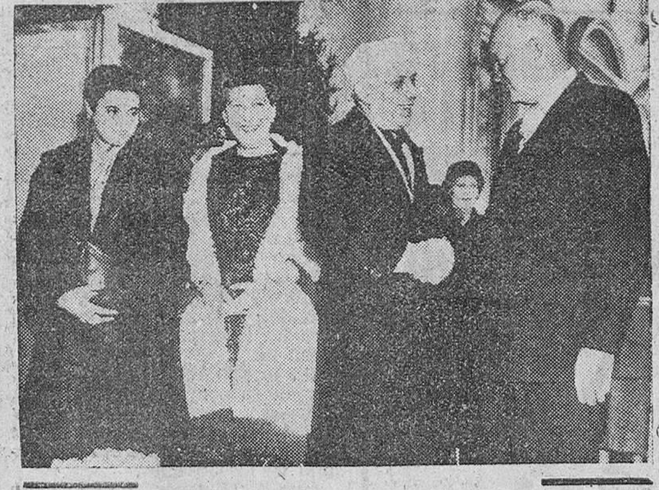
Washington. — El presidente Eisenhower estrecha la mano del primer ministro de la India, Jawaharlal Nehru, a la llegada de éste a la Casa Blanca, con motivo de su visita oficial de cuatro días. A la izquierda, la hija de Nehru, señora Indira Gandhi, acompañada de la esposa del presidente norteamericano.