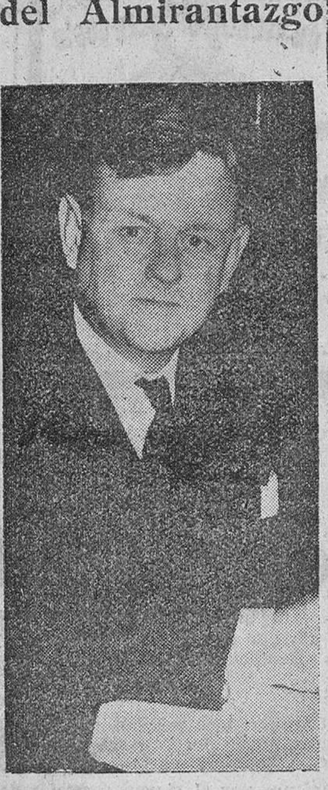
Lord Hallsham, nuevo primer Lord del Almirantazgo británico, que sucede en tal cargo a Lord Cillennning. Es también consejero de la Reina Isabel de Inglaterra.

Viena. — El vicepresidente de los Estados Unidos, Nixon, se ha entrevistado hoy con el presidente austriaco Körner y con el canciller Raab. Ha venido para estudiar el problema de los refugiados húngaros y permanecerá también algún tiempo con los dirigentes austriacos, visitando luego los campos de refugiados húngaros.