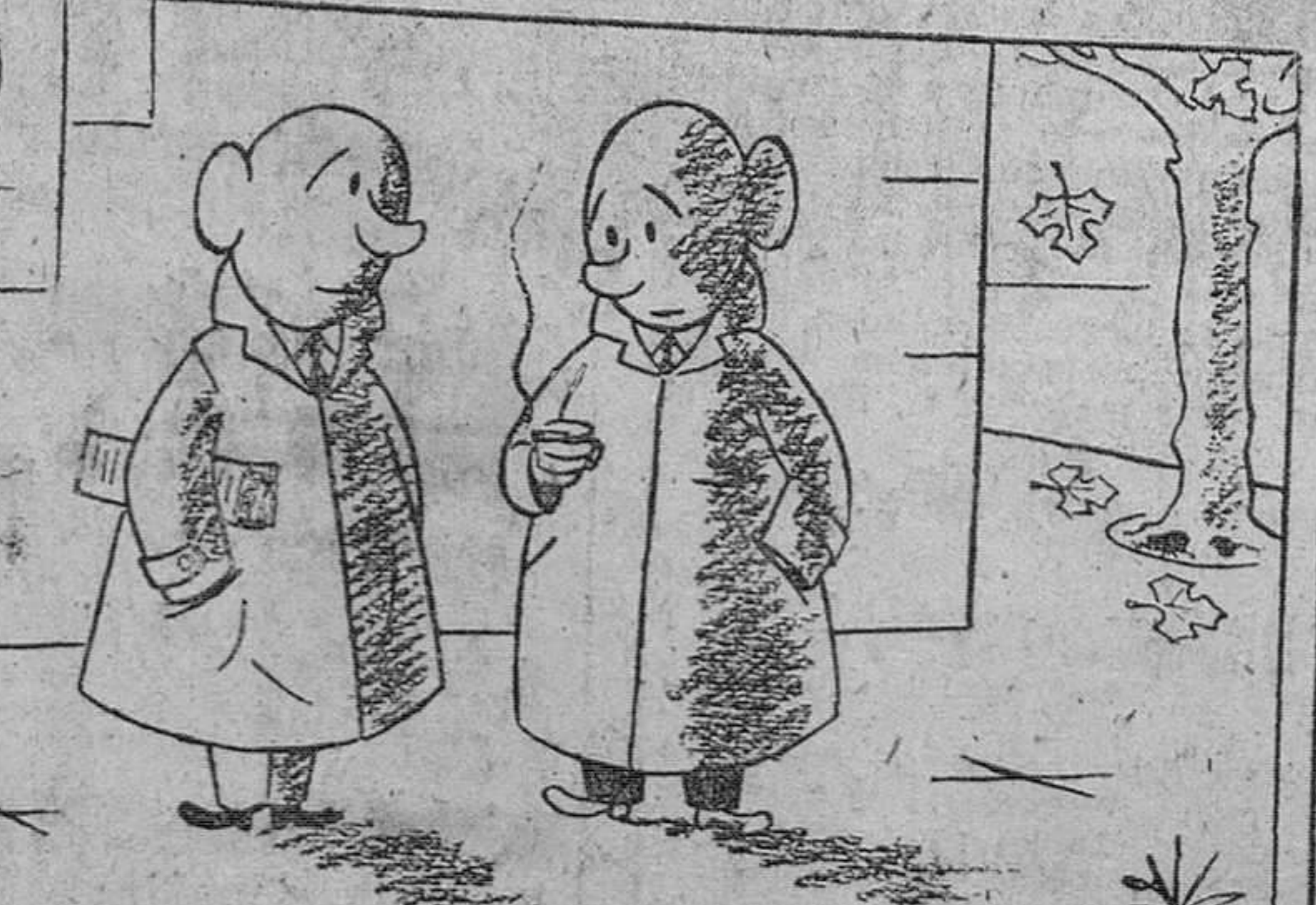
Me tiene preocupado la situación de Suoz. Y a mí el viaje del Burgos a Logroño.