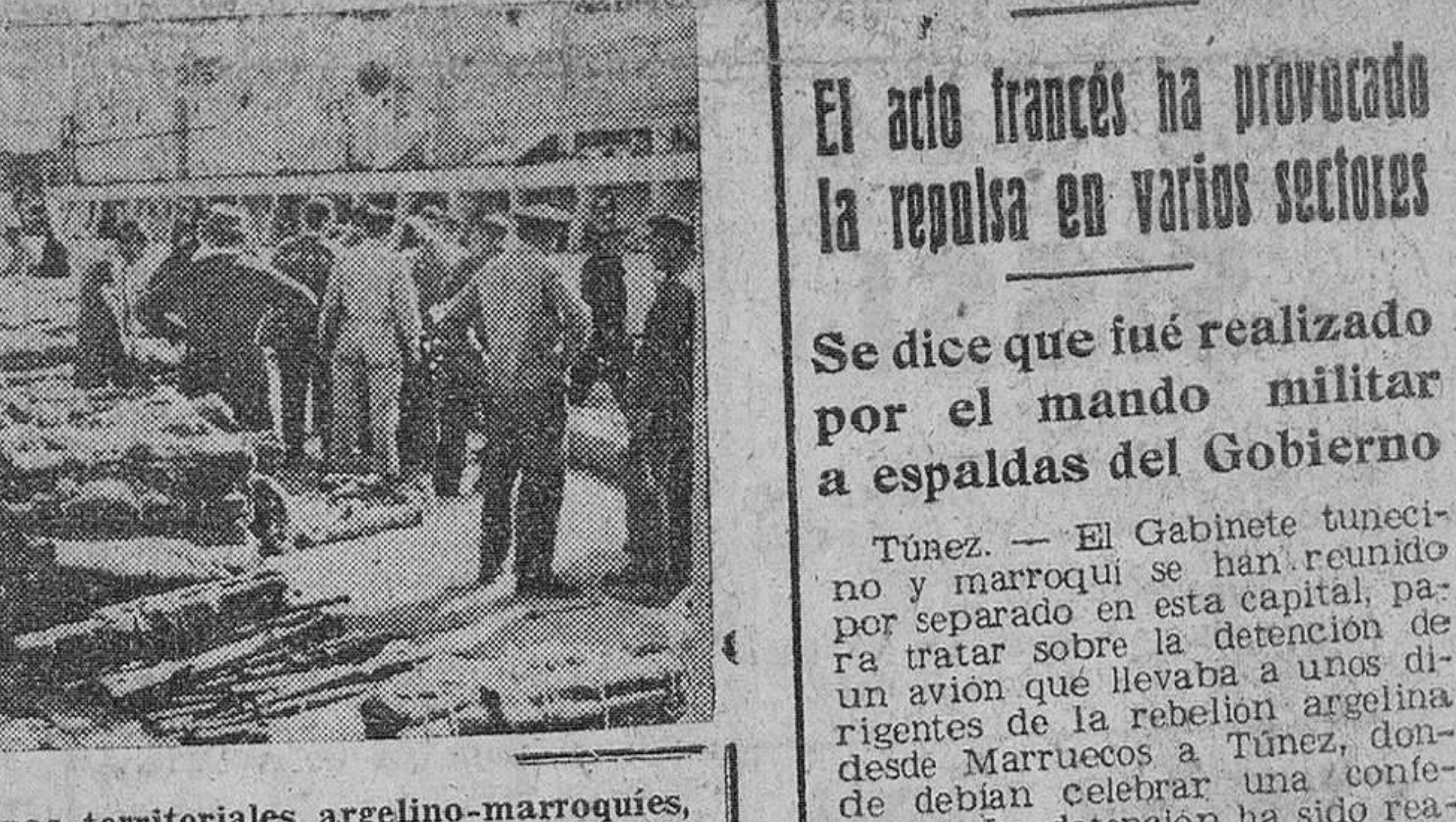
En el límite de las aguas territoriales argelino-marroquíes, un barco escolta francés apresó un navío contrabandista que transportaba setenta toneladas de armas y municiones destinadas a los rebeldes de Argelia. El barco-pirata "Athos", llevado a Mers-el-Kebir, cerca de Orán, fue inmediatamente desprovisto de su peligrosa carga.

Captura de un navío con 70 toneladas de armas para los fellaghas