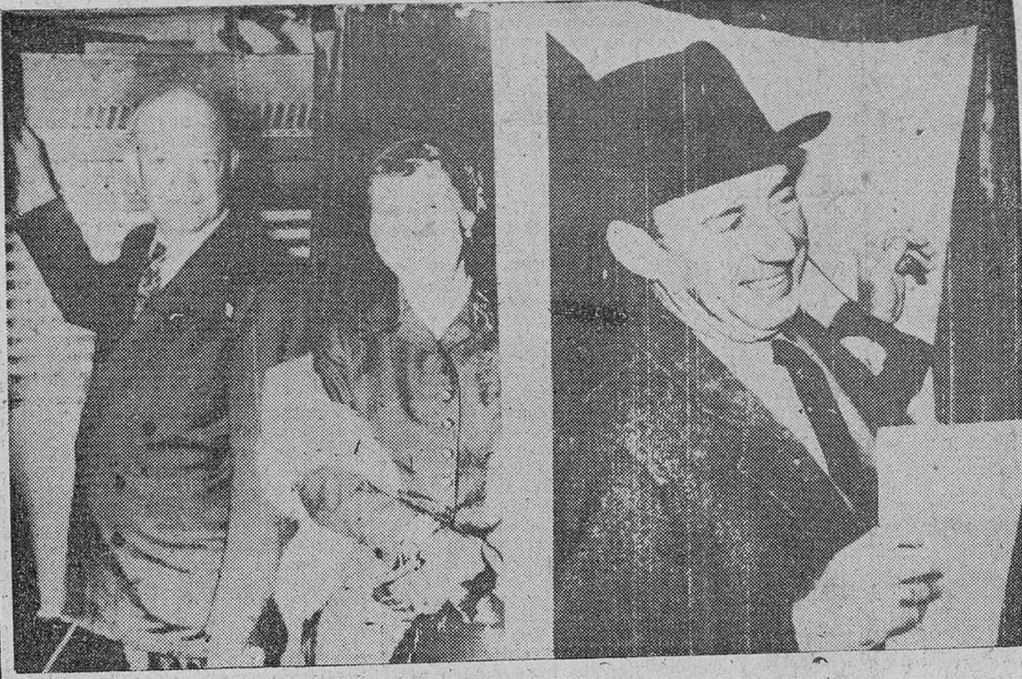
Una foto de hace cuatro años, que vuelve a cobrar actualidad. A la izquierda, el general Eisenhower, candidato republicano, acompañado de su esposa disponiéndose a emitir su voto en Nueva York. A la derecha, Adlai Stevenson, candidato demócrata, al ir a votar en Libertyville (Illinois).

Stevenson y Kefauver no anduvieron menos activos. Los dos han viajado constantemente y uno y otro han aprovechado todas las oportunidades para res y corresponsales de Prensa