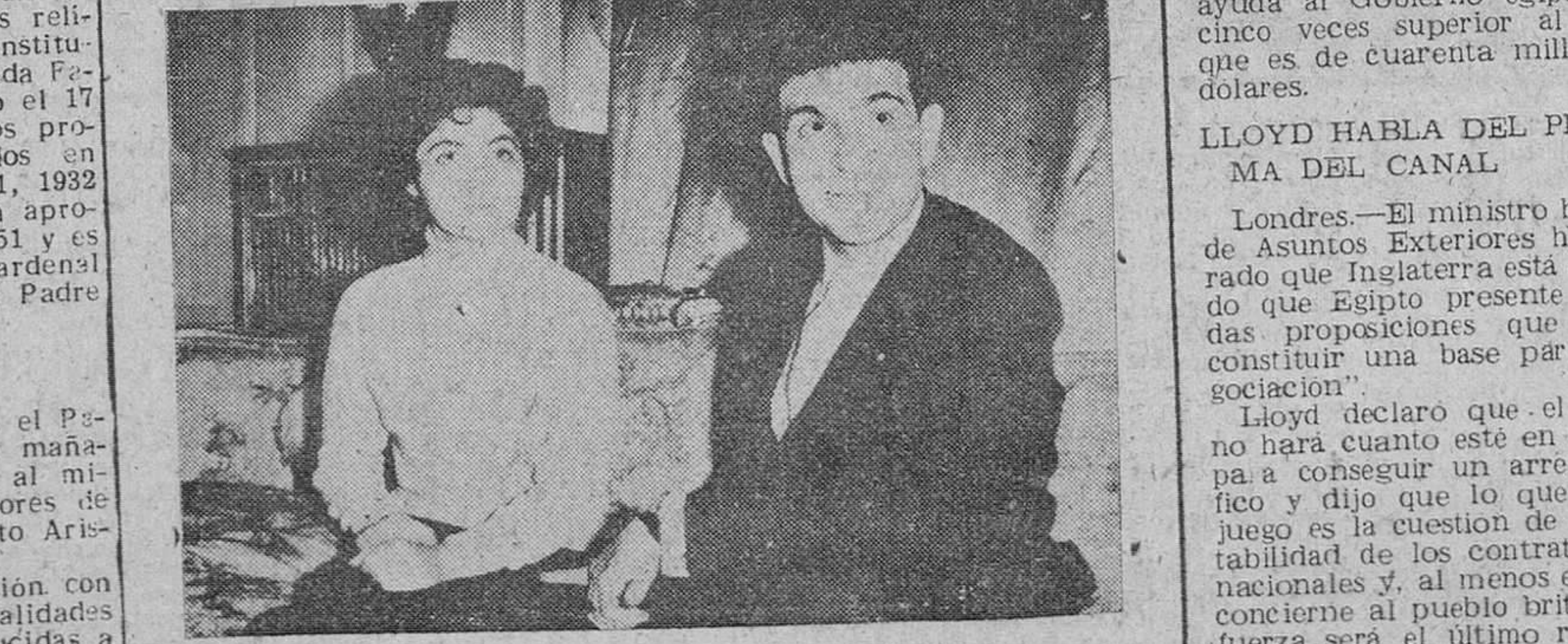
Teherán. — La hija única del Sha de Persia, princesa Shahnaz Pahlavi, con Ardeshtir Zahedi, hijo primogénito del general y ex-primer ministro de Persia, Fazlallah Zahedi, fotografiados en el palacio de la reina madre, el día que fue anunciado su compromiso matrimonial para el próximo mes de Noviembre. La princesa Shahnaz tiene 16 años y es hija del Sha y de su anterior esposa, la princesa Fawzia de Egipto.