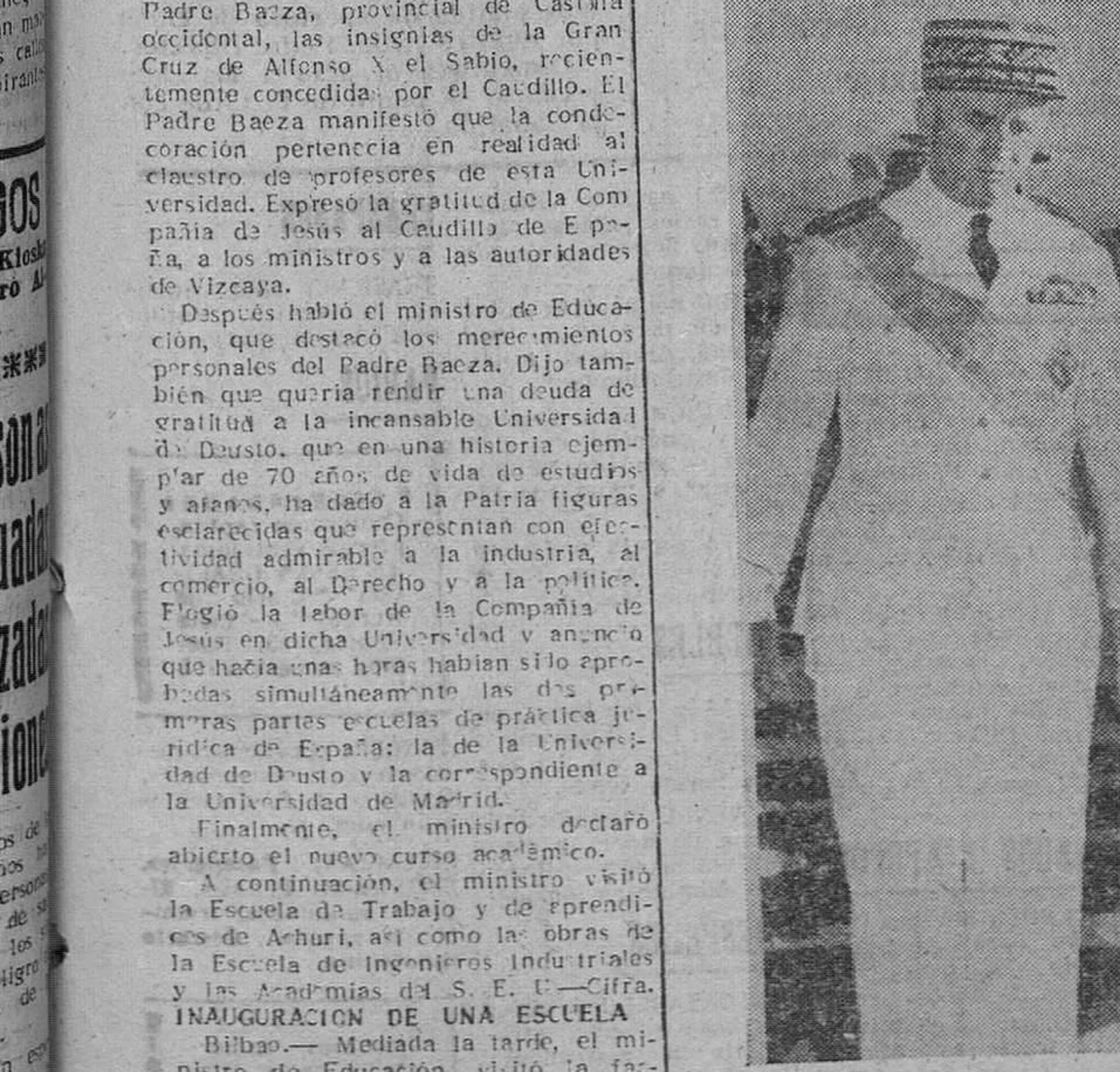
En el aeródromo de Salé, después de haber despedido al Sultán Ben Arafa, el Residente general francés, Boyer de LaTour, acompaña a Muley Abdallah Abdel Hafid, encargado por su primo, el Sultán, de velar por los asuntos de la Corona. — (Foto Gil del Espinar)