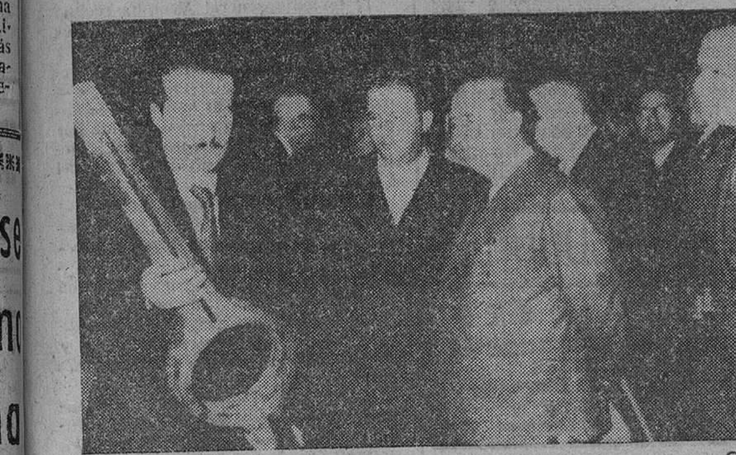
Barcelona. — Un momento de la visita del Caudillo a las instalaciones de la fábrica de automóviles SEAT, en los terrenos de la zona franca, con motivo de su inauguración oficial.