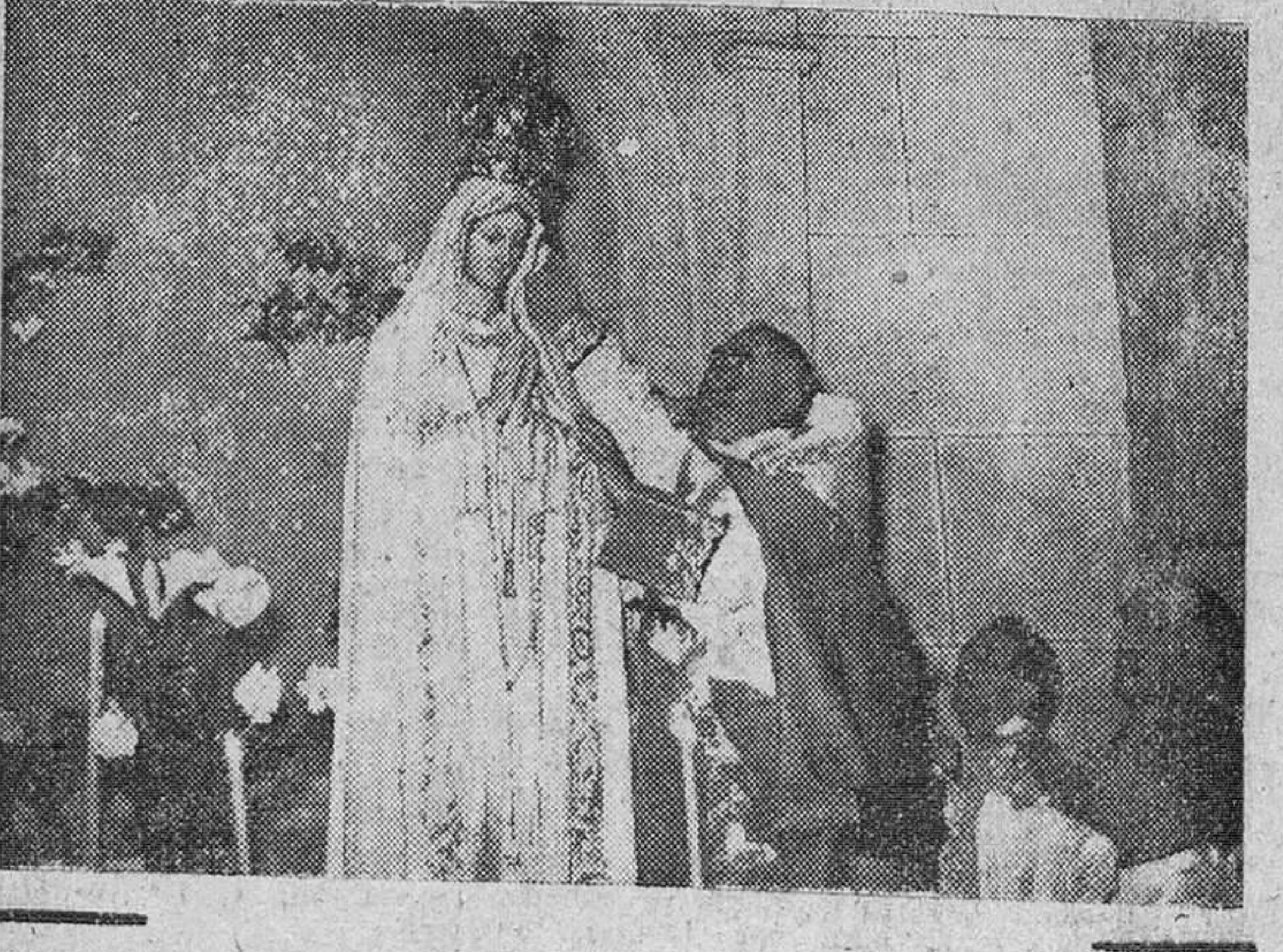
Como final del triduo que ha venido celebrándose en la iglesia parroquial de Santa Agueda, ayer tarde tuvo lugar la solemne coronación de la imagen de Nuestra Señora de Fátima, que se venera en dicho templo, acto en el que ofició el ilustrísimo señor vicario general de la diócesis, doctor don Buenaventura Díez y Díez, que aparece en la fotografía colocando sobre la cabeza de la Virgen la artística corona.