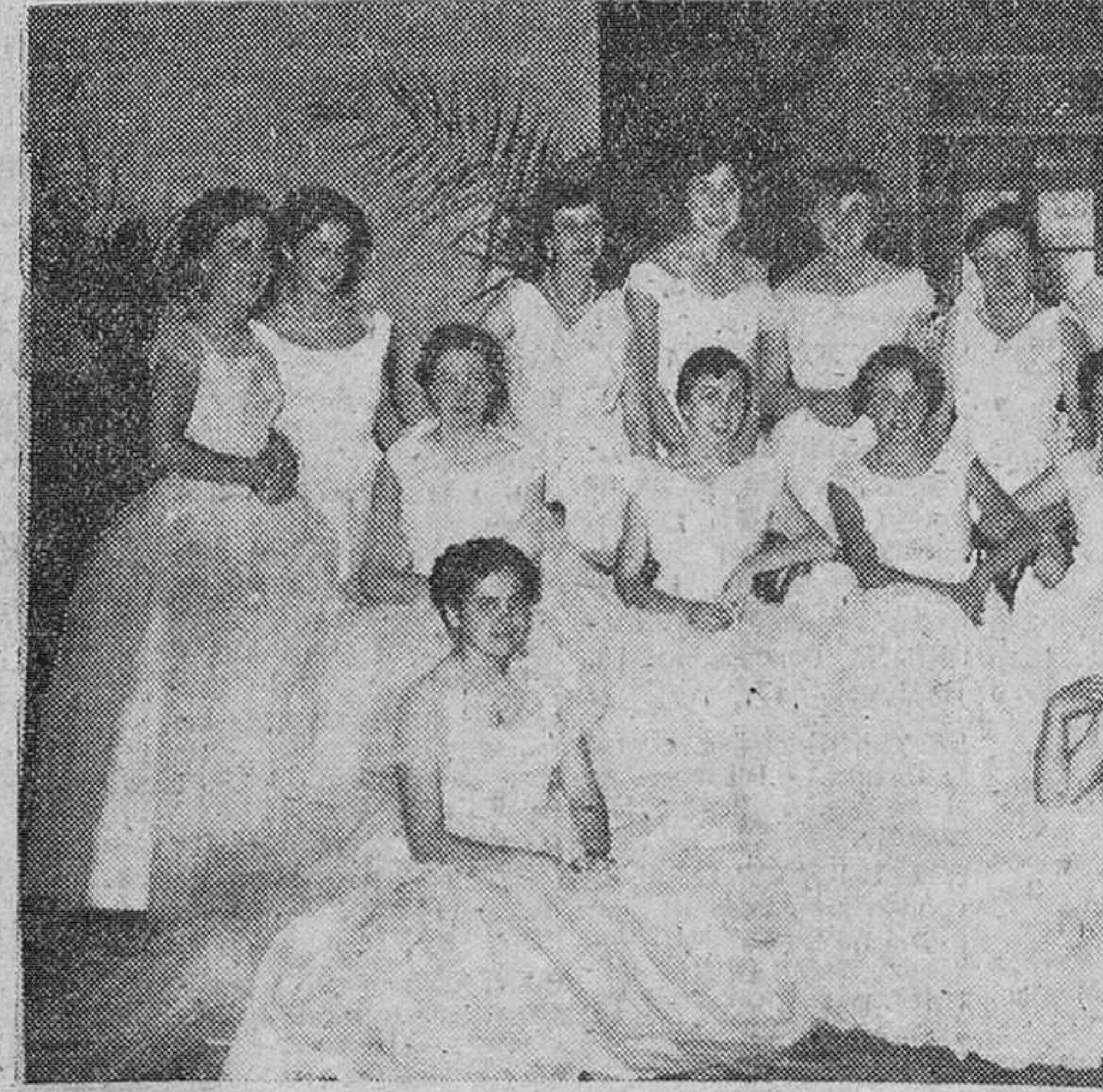
Un grupo de bellas y distinguidas señoritas burgalesas, que por vez primera vistieron galas de mujer, en el brillante baile de gala celebrado en la noche del pasado lunes, en la Academia de Ingenieros, como final de los actos patronales de dicha Arma. — (Foto Fedé).