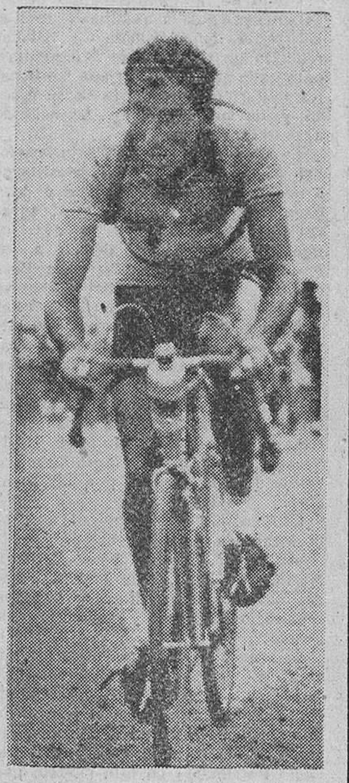
Rafael Geminiani ha arrebatado el "maillot" amarillo a Jesús Loroño. Esta es la principal consecuencia derivada de la etapa disputada ayer. El equipo francés corrió inteligentemente y al final tuvo su recompensa: Geminiani, líder.