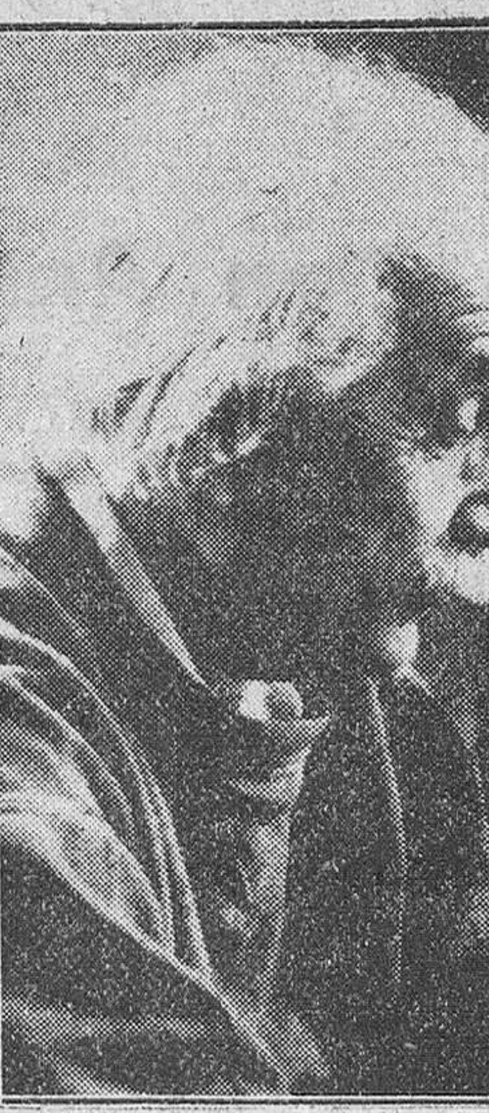
Princeton (Nueva Jersey). — El famoso físico doctor Albert Einstein ha fallecido en el hospital de Princeton.

Albert Einstein había cumplido 76 años el día 14 del pasado mes de marzo. No celebró la fecha. Einstein nació en el seno de una familia de fabricantes alemanes en Ulm. Sus primeros años de escolar no permitieron vislumbrar que con el tiempo se revelaría como un genio de las matemáticas. Aprendía las lecciones