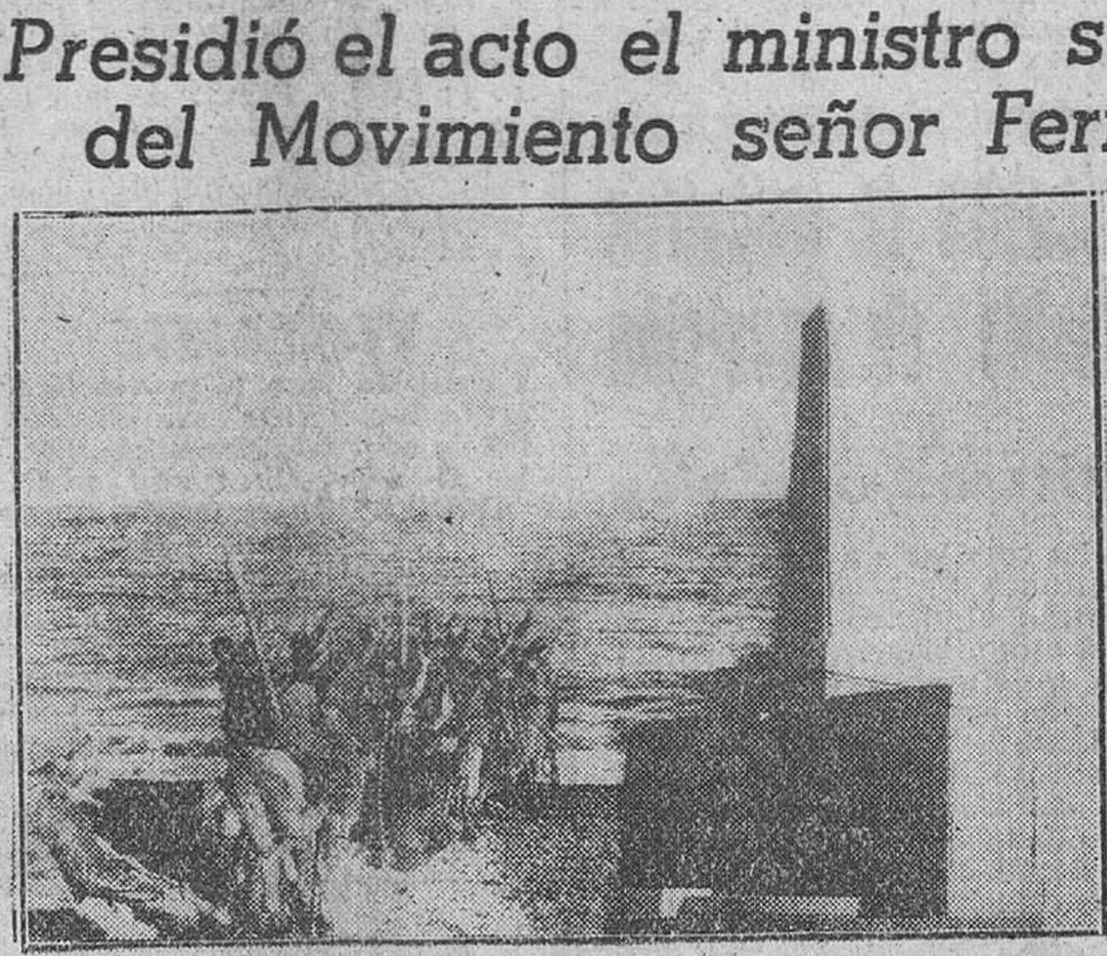
Una composición fotográfica en la que aparecen, a la izquierda, un grupo de combatientes del Ejército Nacional, entonando el himno de la Falange, a su llegada a la playa de Vinaroz el 15 de Abril de 1938. A la derecha, el monumento erigido por la Falange provincial de Castellón en dicho lugar, conmemorativo de aquella gesta y que fue inaugurado el pasado domingo.

Fué inaugurado un monumento conmemorativo de la llegada de las tropas nacionales al Mediterráneo Presidió el acto el ministro secretario general del Movimiento señor Fernández Cuesta