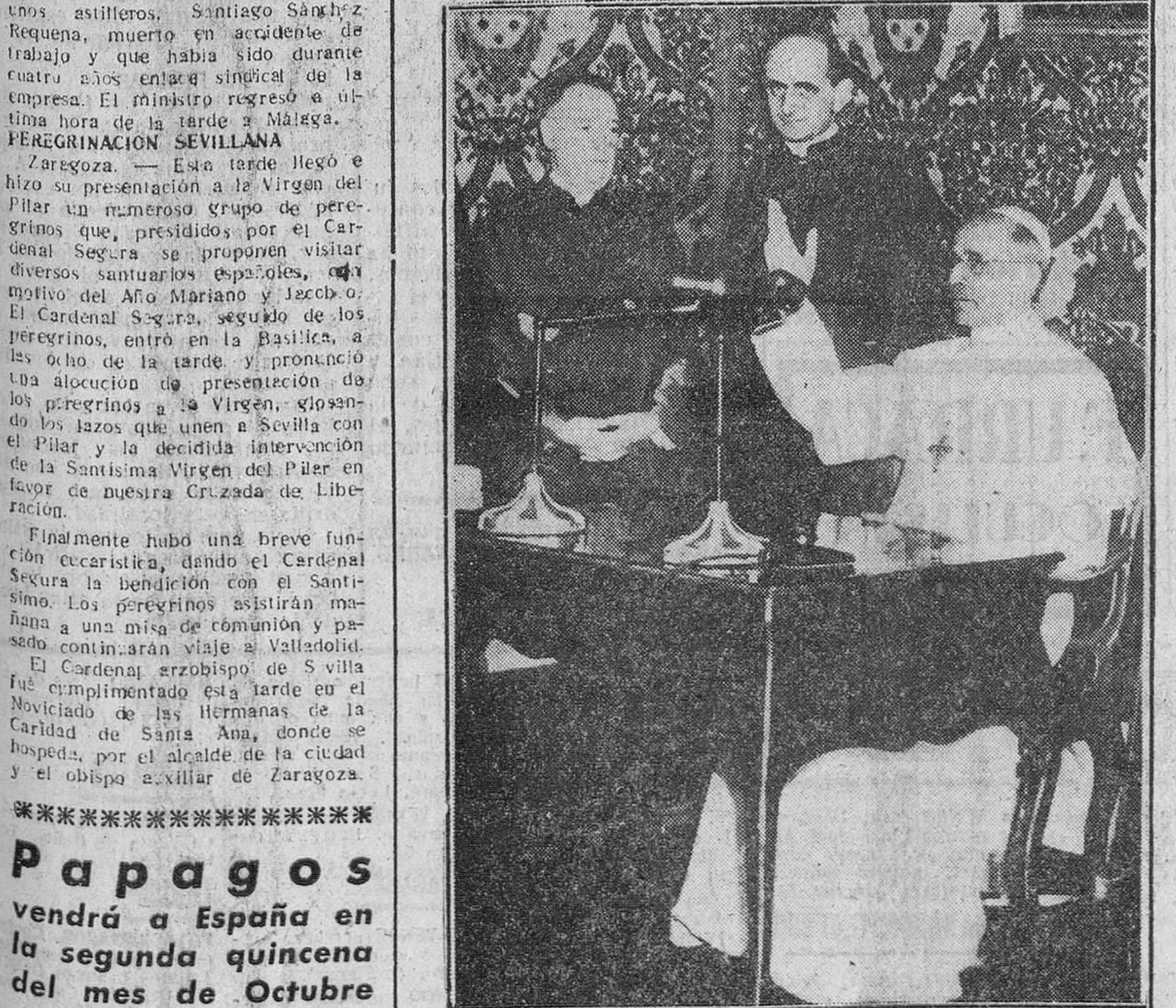
Castelgandolfo. — Su Santidad el Papa Pío XII, durante el mensaje que dirigió a través de los micrófonos de Radio Vaticano a los católicos canadienses, con motivo de la clausura del Congreso Mariano de Canadá.