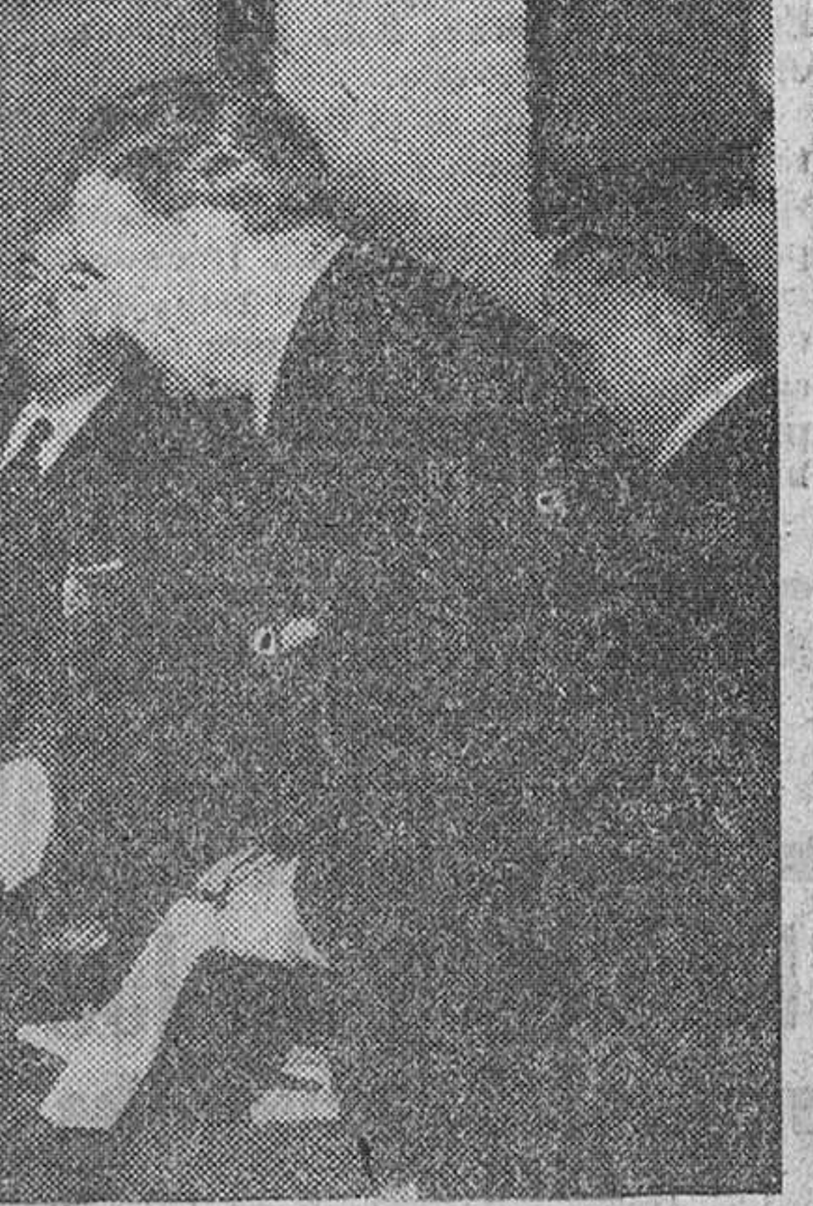
San Sebastián.—Un momento del canje de notas por el que se formaliza el acuerdo entre los Gobiernos de España y de los Estados Unidos, para la compra de productos españoles por Norteamérica, dentro de la modalidad denominada «of shore». Intervinieron el ministro de Asuntos Exteriores, Sr. Martín Artoja y el embajador de los Estados Unidos, Mr. Dunn, en presencia del ministro de Comercio, Sr. Arbúria y otras personalidades.