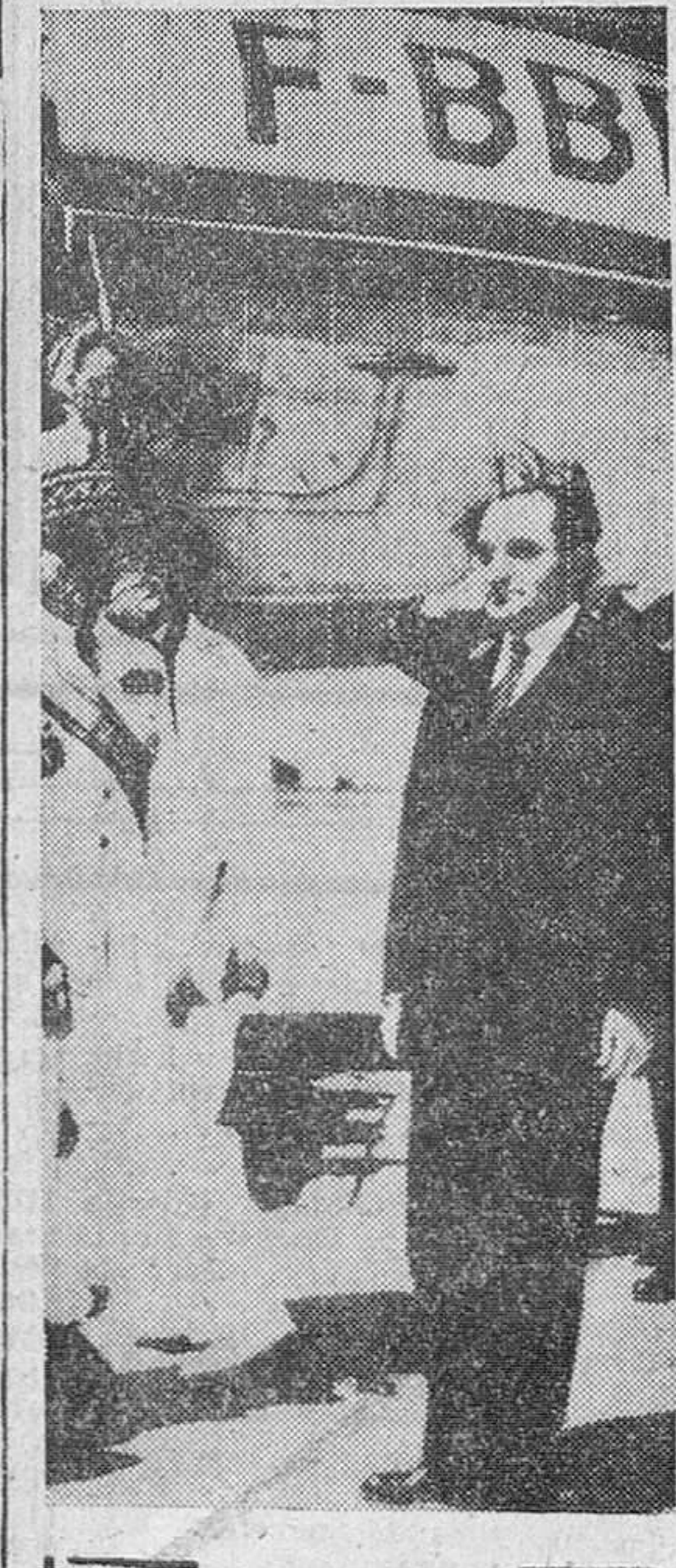
Túnez.—El primer ministro francés, Mendes-France, a su llegada al aeropuerto de esta capital, para hacer frente personalmente a la actual situación franco-marroquí.

La restauración del legítimo Sultán es solicitada por destacados notables marroquíes