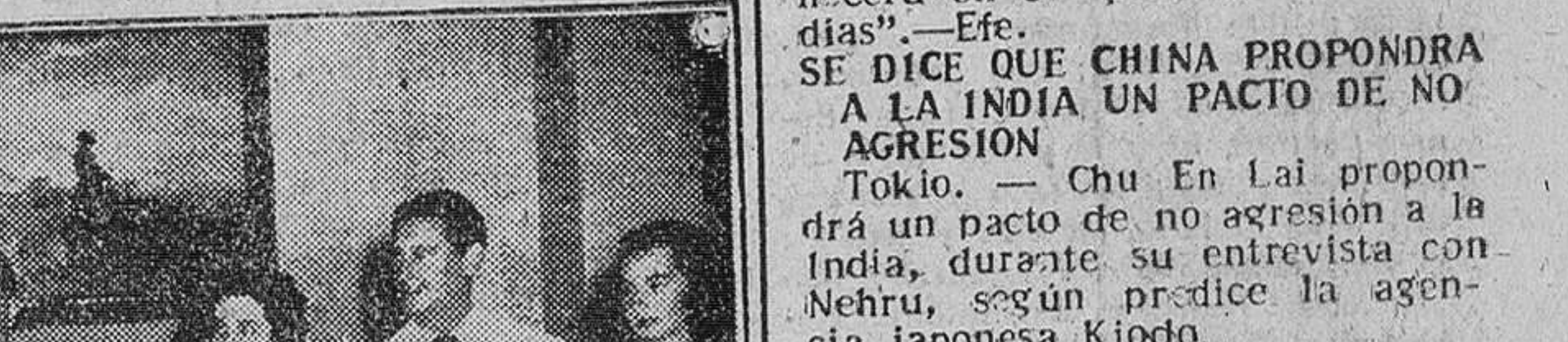
La Habana. — Los marqueses de Villaverde, acompañados de los embajadores de España, señores de Lojendio y otras personalidades, durante la recepción celebrada en la Embajada española, con ocasión de la llegada a la capital de Cuba de los hijos de Su Excelencia el Jefe del Estado español.