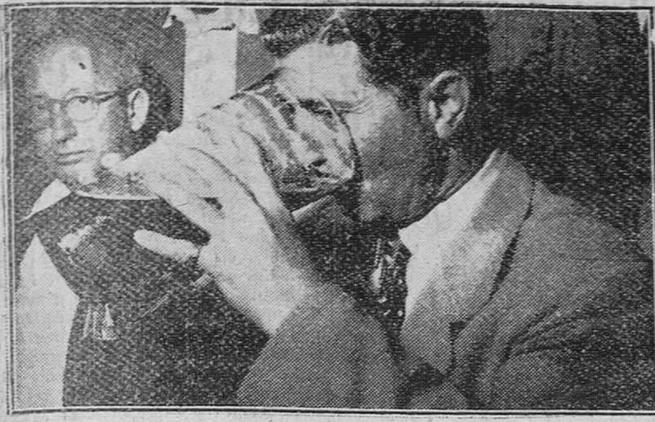
Madrid. — Uno de los participantes en las primeras eliminatorias del campeonato de bebedores de cerveza, que se celebra en esta capital, ingiriendo el contenido de esta descomunal "caña".