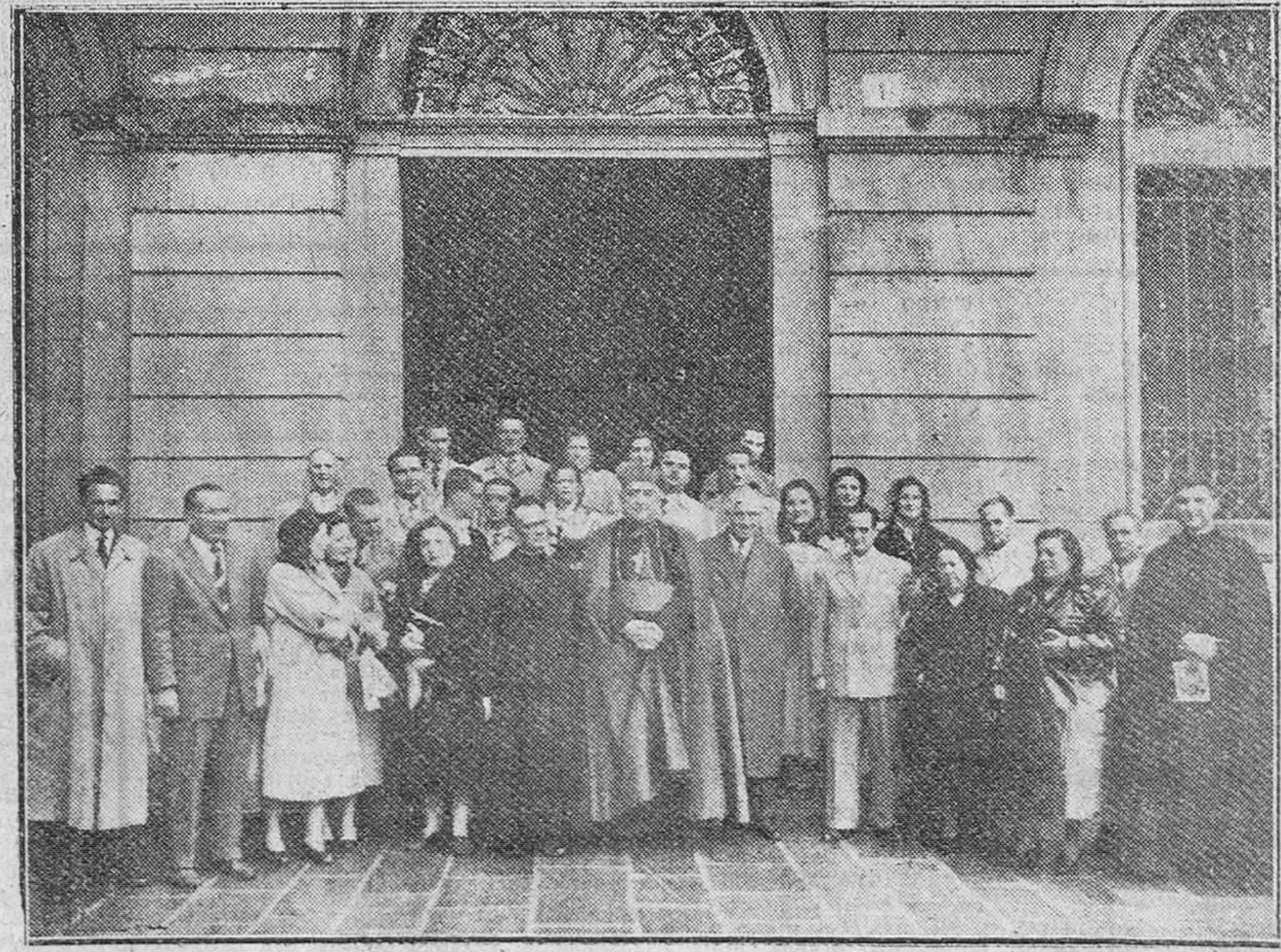
El Eminentísimo Cardenal - Arzobispo de Santiago, doctor Quiroga Palacios, posa para DIARIO DE BURGOS con el grupo de peregrinos que el lunes último ganaron el jubileo del Año Santo en la Basílica compostelana, formando parte de la excursión organizada por la Caja de Ahorros y Monte de Piedad del Circulo Católico de Obreros.