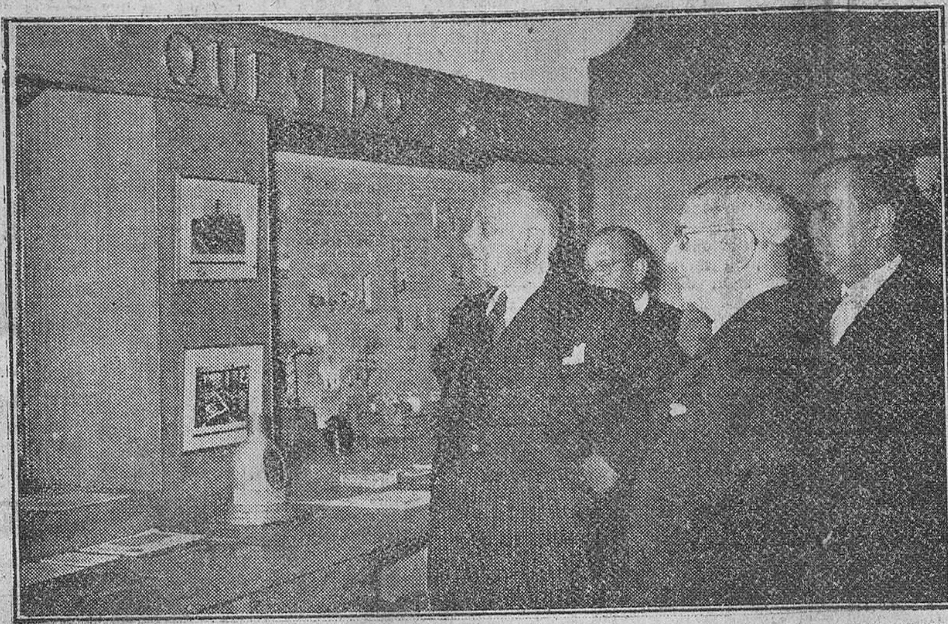
Madrid. — El generalísimo dominicano Rafael Leónidas Trujillo, acompañado del ministro subsecretario de la Presidencia, Sr. Carrero Blanco; del presidente del Instituto Nacional de Industria, Sr. Suanzes y otras personalidades, durante la visita efectuada a la exposición permanente del I. N. I.