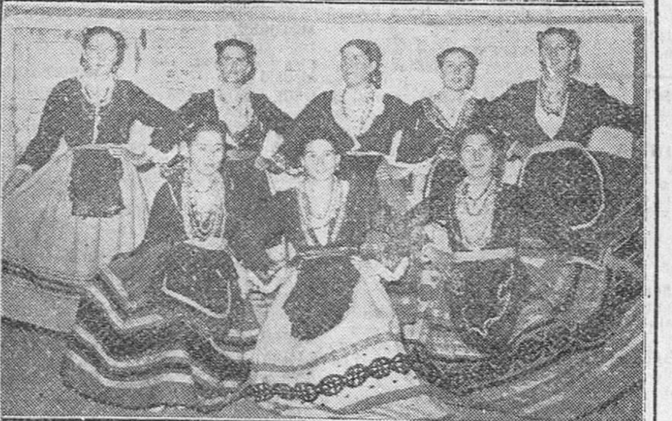
Grupo de danzas representante de Peñaranda de Duero, que ha obtenido el primer premio, en el concurso provincial de danzas de la Sección Femenina, celebrado en nuestra ciudad.