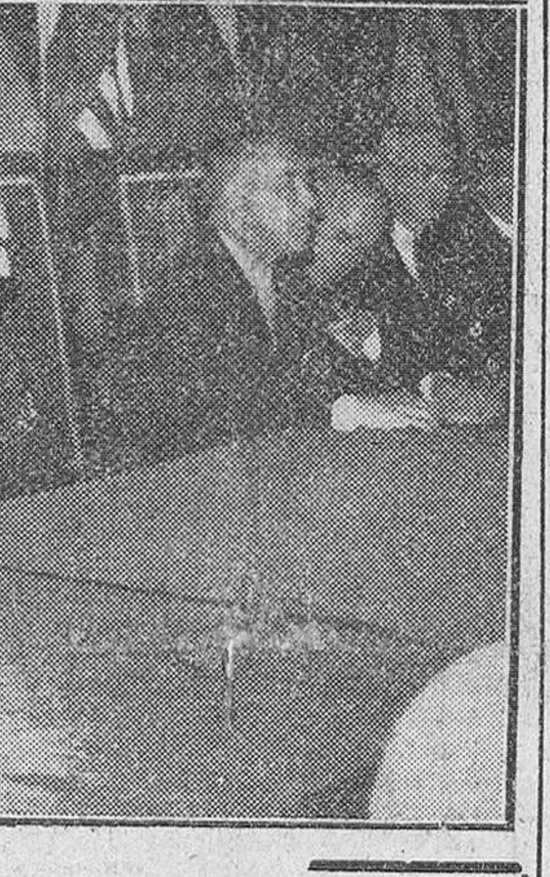
Madrid.—Bajo la presidencia de los ministros de Agricultura e Industria y de otras destacadas personalidades, se ha celebrado en el Instituto "Ramiro de Maeztu", la solemne sesión inaugural del X Congreso Internacional de Industrias Agrícolas y Alimenticias.