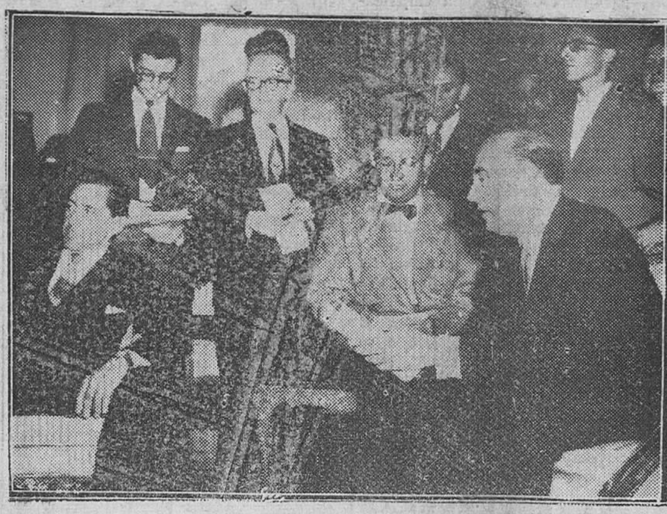
Washington. — El ministro de Comercio español, señor Arburú, hablando a los redactores de los principales periódicos norteamericanos, durante la conferencia de Prensa celebrada a su llegada a esta ciudad.